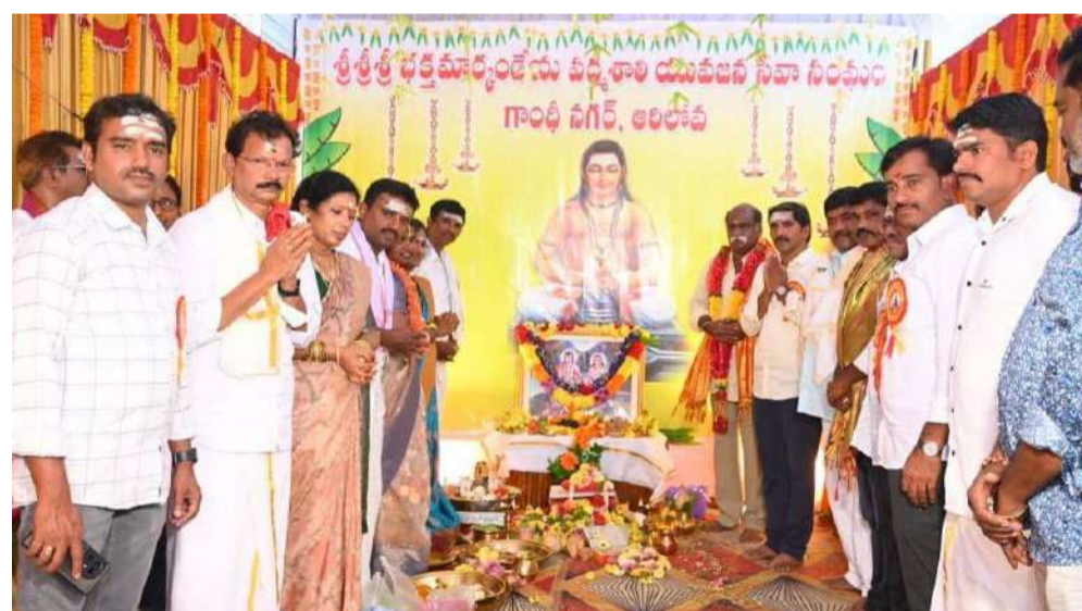
విశాఖ తూర్పు, పెన్ పవర్, మార్చి 20: జీవీఎస్ 11వ వార్డు గాంధీనగర్ లో పద్మశాలి యువజన సేవా సంఘం ఆధ్వర్యంలో గత ఆరు సంవత్సరాలగా శ్రీశ్రీశ్రీ భవనా ఋషి భద్రావతి ల పూజా మహోత్సవం

శ్రీ శ్రీ భక్త మార్కండేయ పద్మశాలి యువజన సేవా సంఘం ఆధ్వర్యంలో నిర్వహణ