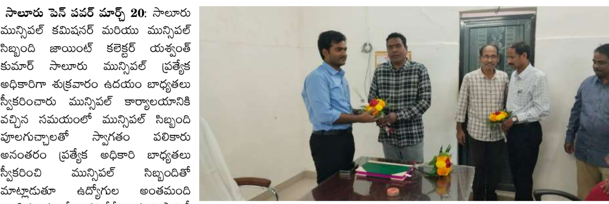
సాలూరు పెన్ పవర్ మార్చి 20: సాలూరు మున్సిపల్ కమిషనర్ మరియు మున్సిపల్ సిబ్బంది జాయింట్ కలెక్టర్ యశ్వంత్ కుమార్ సాలూరు మున్సిపల్ ప్రత్యేక అధికారిగా శుక్రవారం ఉదయం బాధ్యతలు స్వీకరించారు మున్సిపల్ కార్యాలయానికి వచ్చిన సమయంలో మున్సిపల్ సిబ్బంది పూలగుచ్ఛాలతో స్వాగతం పలికారు అనంతరం ప్రత్యేక అధికారి బాధ్యతలు స్వీకరించి మున్సిపల్ సిబ్బందితో మాట్లాడుతూ ఉద్యోగుల అంతమంది అంకితభావంతో పనిచేసే మున్సిపాలిటీ పరిధిలో ప్రజలకు ఎటువంటి ఇబ్బందులు లేకుండా తాగునీరు పారిశుధ్య పనులు నిర్వహణ చేయాలని ప్రత్యేక అధికారి యశ్వంత్ కుమార్ రెడ్డి ఆదేశాలు జారీ చేశారు.