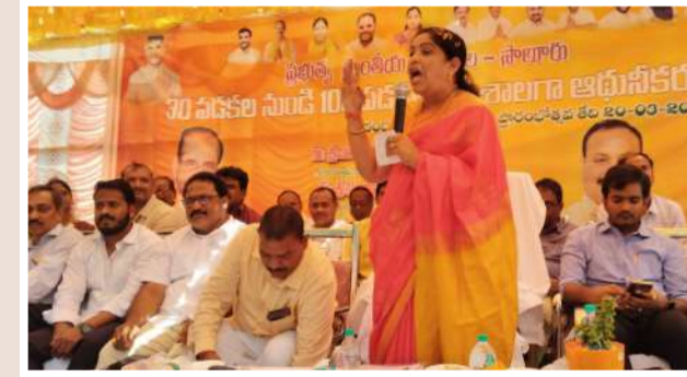
గిరిజన మహిళలకు ప్రసూతి కేంద్రం ఏర్పాటు చేయండి సాలూరు పెన్ పవర్ మార్చి 20: సాలూరు నూతనముగా నిర్మాణము చేసిన వంద పడకల ఏరియా ఆసుపత్రిని గిరిజన శాఖ మంత్రి జి సంధ్యారాణి, శుక్రవారం ఉదయం లంచనముగా ప్రారంభోత్సవం చేశారు. అనంతరం ఆమె మాట్లాడుతూ వైయస్సార్ పార్టీ అధికారములో ఉన్న

సమయంలో శంకుస్థాపన చేసి పునరులకే పరిమేషమ అయ్యారని అన్నారు. ఎమ్మెల్యేగా ఉన్న సమయంలో అప్పటి ముఖ్య మంత్రి చంద్రబాబు నాయుడుకు సాలూరు వంద పడకల ఆస్పత్రులుగా చేయాలని చెప్పడం జరిగిందని అన్నారు అప్పటిలో వైయస్సార్ ప్రభుత్వం అధికారంలో ఉన్న సమయంలో నిధులు మంజూరు చేయలేదని అన్నారు. శాసనసభ ఎన్నికలలో 2024 లో సాలూరు ఎమ్మెల్యేగా గెలుపొందడం జరిగిందని అన్నారు. సాలూరు నియోజకవర్గం పరిధిలో గిరిజన గ్రామాలు కొండలపై ఉన్న పంచాయతీ గిరిజనలు వైద్యం కోసం సాలూరు సిహెచ్ కి వస్తే అప్పటిలో కేవలం 30 పడకల ఆసుపత్రిగా ఉండేదని సిబ్బంది కొరత చాలీచాలని భవనాలు లేక వైద్యము అరకారంగా ఇండలేదని అన్నారు. గిరిజన గిరిజనేతర ప్రజలు వైద్యం కోసము చాలా ఇబ్బందులు. వడేవారిని అన్నారు. గిరిజన గ్రామంలో పర్వతించి గిరిజన ఆరోగ్య సమస్యలను గుర్తించి రాష్ట్ర ముఖ్యమంత్రి చంద్రబాబునాయుడు కు వంద పడకల