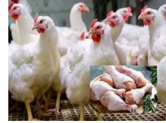
చెబుతున్నారు చికెన్ దుకాణ వ్యాపారులు. డిమాండ్ కు సరఫరా చిన్న బ్రాండుల కోళ్లు కూడా దొరకడం లేదట. అలాగే పార్టీ నిర్మాణాలు విజయవాడ పెంపకం ఆపేడం కూడా మరో కారణం అంటున్నారు. కోళ్లు డిమాండ్ కు తగిన విధంగా సరఫరా లేని కారణంగా చికెన్ ధరలు భారీగా పెరుగుతున్నాయని చెబుతున్నారు.

అందోళన కలిగిస్తోంది. ఇదిలా ఉంటే మరోవైపు కోడి గుడ్డు ధర మాత్రం పడిపోతున్నాయి. గతంలో ఒక గుడ్డు ధర రూ.8 వరకు ఉండగా.. ఇప్పుడు రూ.4.20 పైసల వద్ద కొనసాగుతోంది. కోడిగుడ్డు ఎగుమతి ఆగిపోవడంతో ధరలు పడిపోయాయని పార్టీ యజమానులు చెబుతున్నారు. అయితే వ్యాపానికి కోడిగుడ్డు తమిళనాడుకు తీసుకెళ్లి అక్కడి నుంచి గవ్వ దేశాలకు ఎగుమతి అవుతాయి. అయితే ప్రస్తుతం యుద్ధం కారణంగా గవ్వకు ఎగుమతులు నిలిచిపోయాయి. దీంతో గుడ్డు ధర అమాంతంగా పడిపోయింది. చికెన్ ధర పెరగడానికి బ్రాండుల కోళ్ల ఉత్పాదకత తగ్గడం, రంజాన్, ఇతర ఘంట్ల కారణంగా చికెన్ ధరలు పెరగడానికి కారణమని