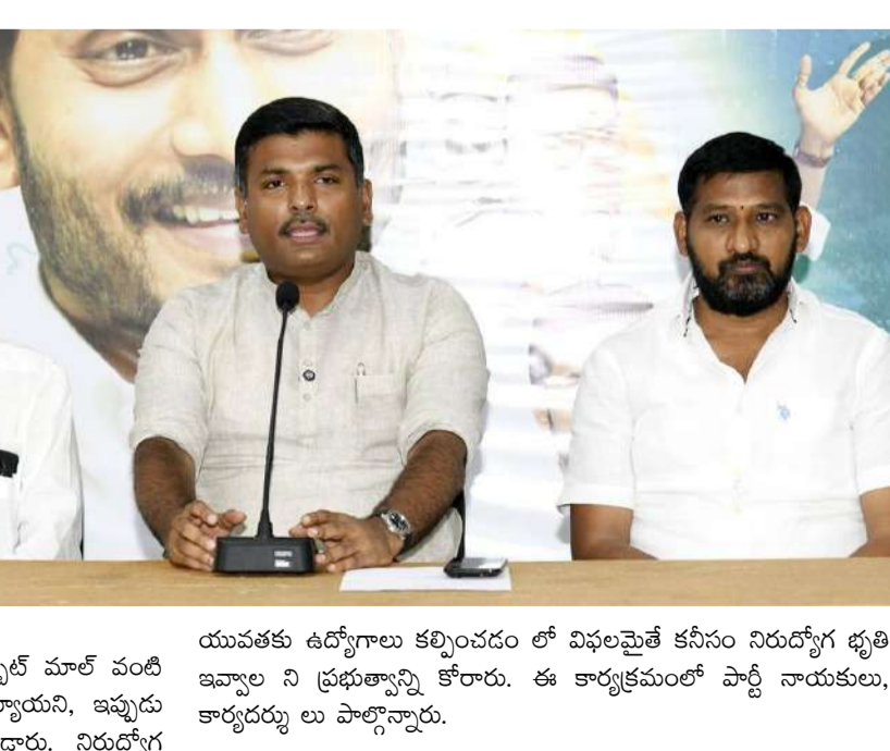
యువతకు ఉద్యోగాలు కల్పించడం లో విఫలమైతే కనీసం నిరుద్యోగ భృతి ఇవ్వాలని ప్రభుత్వాన్ని కోరారు. ఈ కార్యక్రమంలో పార్టీ నాయకులు, కార్యదర్శు లు పాల్గొన్నారు.

స్పష్టత ఇవ్వాలని డిమాండ్ చేశారు. ఎన్నికల సమయంలో ఇచ్చిన ఉద్యోగ హామీల పై శ్రేష్టపత్రం విడుదల చేయాలని కోరారు. రాష్ట్రంలో పరిశ్రమలు పారిపోతున్నాయని, పెట్టుబడులు తగ్గుతున్నాయని కూడా ఆయన ఆరోపించారు. కోకాకోలా, అల్లూబెక్, ఎల్ అండ్ టీ వంటి కంపెనీలు వెనక్కి వెళ్లిపోయిన విష యాన్ని ప్రస్తావించి, కడపలో జిందాల్ స్టీల్ ప్లాంట్ కూడా నిలిచిపోవడానికి కారణాలపై ప్రభు త్వం సమాధానం చెప్పాలని డిమాండ్ చేశారు. ఇదే సమయంలో, విశాఖలో ఇనార్పిట్ మార్ట్ వంటి ప్రాజెక్టులు తమ ప్రభుత్వ హయాంలోనే ప్రారంభమయ్యాయని, ఇప్పుడు కార్యదర్శు లు పాల్గొన్నారు.