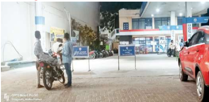
కూరగాయల ధరలు ఆకాశాన్నంటే ప్రమాదం ఉందని వ్యాపార వర్గాలు హెచ్చరిస్తున్నాయి. ఈ పరిణామాలన్నింటి నేపథ్యంలో సామాన్యుడి ఆర్థిక పరిస్థితి దిగజారుతుండగా మరోవైపు రైతులు కూడా వ్యవసాయ పనులకు అవసరమైన వాణులు, రవాణా సదుపాయాల కోసం అవ్వ పడుతున్నారు. పొలాల్లోని మిర్చి, మొక్కజొన్న పంటల తరలింపు కష్టంగా మారుతోంది. ప్రభుత్వం యుద్ధ ప్రాతిపదికన చర్యలు చేపట్టి పెట్రోల్ సరఫరాను పునరుద్ధరించాలని ప్రజలు కోరుతున్నారు. అయితే ఇంధన సరఫరా సాధారణ స్థితికి రావడానికి కొంత సమయం పట్టే అవకాశముందని అధికారులు చెబుతున్నారు. ఇదిలా ఉండగా ఇప్పటికే గ్యాస్ కొరత కారణంగా హోటళ్లు, టిఫిన్ సెంటర్లు, తోపుడు బండ్లు, వెల్డింగ్ వర్కర్లు, ఇతర చిన్న పరిశ్రమలు తీవ్ర ఇబ్బందులు ఎదుర్కొంటున్నాయి. కొన్ని హోటళ్లు, రెస్టారెంట్లు, చిరు వ్యాపారాలు తాత్కాలికంగా మూతబడ్డాయి. వాటిల్లో పనిచేసే వారు ఉపాధిని కోల్పోయారు. పట్టణంలోని గ్యాస్ ఏజెన్సీల వద్ద సిలిండర్ల కోసం ప్రజలు గంటల తరబడి క్యూల్లో నిలబడాల్సి వస్తోంది. ఇక్కడే గ్యాస్ లేక కట్టెల పొయ్యిలు వాడుతున్న ధృశ్యాలు కనిపిస్తున్నాయి. దీన్ని ఆసరాగా చేసుకుని కొంతమంది గ్యాస్ సిలిండర్లను భాక్స్ మార్కెట్లో రూ.2000-2500 వరకు విక్రయిస్తున్నారనే ఆరోపణలు వస్తున్నాయి.