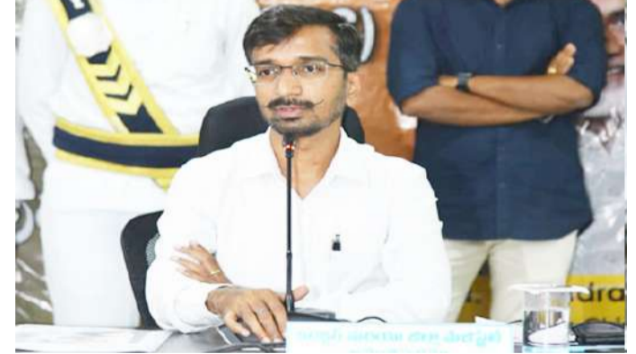
ఆ ప్రకటనలో తెలిపారు.