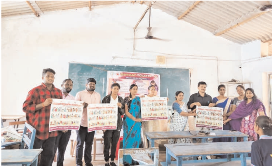
బాలికల భవిష్యత్తు కోసం సమగ్ర చర్యలు