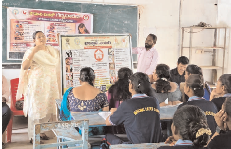
మూలస్థంభమని పేర్కొన్నారు. బాలికలు