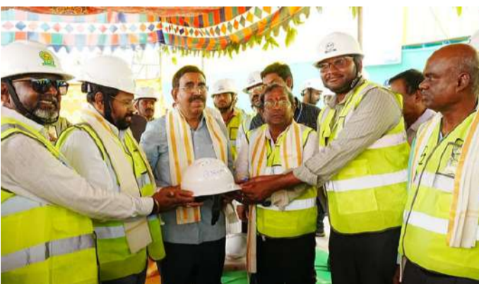
రిచ్చ్య చేసారని ప్రస్తుతం ప్రమాదం పై విచారణ జరుగుతుందన్నారు. ఎవరైనా ఉద్దేశపూర్వకంగా చేస్తే ఖచ్చితంగా చర్యలు తీసుకుంటామని ఆయన తెలిపారు.

అమరావతి: పెన్ పవర్ ప్రతినిధి మార్చి 26: అమరావతిలో రాష్ట్ర స్థాయి అధికారులంతా ఒకేచోట ఉండేలా సెక్టరియల్ కు ఐకానిక్ టవర్లను డిజైన్ చేశామని మున్సిపల్ మంత్రి నారాయణ తెలిపారు. అమరావతి రాజధానిలో నిర్మిస్తున్న ప్రధాన శాఖల టవర్ -3 కార్పర్ నోడ్ అమర్చే పనులకి మంత్రి పి నారాయణ బుద్ధవారం పూజ నిర్వహించి, పనులు ప్రారంభించారు. ఈ సందర్భంగా మంత్రి మాట్లాడుతూ ఈ టవర్లు నిర్మాణం వేగవంతంగా జరుగుతుందన్నారు. అత్యాధునిక డయాగ్నోస్టిక్ టెక్నాలజీతో నిర్మాణం జరుగుతుందన్నారు. గత ఏడాది వర్షాలు ఎక్కువగా రావడంతో 4 నెలల పాటు పనులకు ఆటంకం కలిగిందన్నారు. ఐకానిక్ భవనాలు, ప్రజాప్రతినిధులు, అధికారుల నివాసాలు, మౌలిక వసతుల పనులు వేగంగా జరుగుతున్నాయని తెలిపారు. అమరావతి నిర్మాణానికి సీఎం ప్రత్యేక ఫైనాన్స్ మోడల్ ఇచ్చారన్నారు. ప్రజలు కట్టే పనులు నుంచి ఒక్క రూపాయి కూడా అమరావతికి ఖర్చు పెట్టడం లేదన్నారు. అమరావతి సెల్ఫ్ ఫైనాన్స్ సీటీ అని తెలిపారు. అమరావతిలో అదనంగా ఖర్చు పెడుతున్నట్లు కొంతమంది అమరావతిపై దుష్ప్రచారం చేస్తున్నారని తెలిపారు. అమరావతిలో జరిగిన అగ్ని ప్రమాదంపై సీఎం చంద్రబాబు