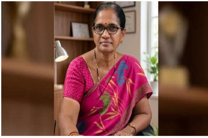
పని దినాలలో ఈ క్రింది నెంబర్లు సంప్రదించవచ్చుని తెలిపారు. 8712625038, 8712625039, 8712625073.