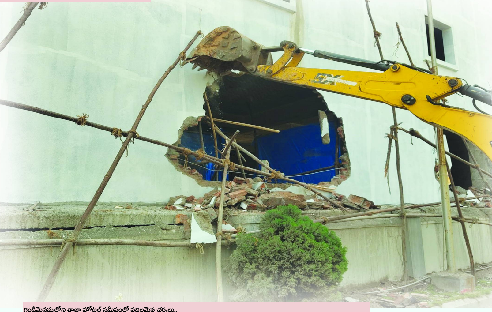
గండిమైసమ్మలోని తాజా హోటల్ సమీపంలో పదిలమైన చర్యలు..

దుండిగల్ సర్కిల్ బహుదూర్ పల్లి విలేజ్ లో సర్పాఠుర్ హైవేపై ఉన్న 1500 గజాల భారీ అక్రమ షెడ్యూలై, అధికారపార్టీ యువనాయకుని సిఫార్సులు ఉన్నాయి.. దీంతో ఏదో నాలుగు ఐదో రేకులు, ఓ చిన్న డ్యూమేజ్ చేసి కూర్చివేతలు ఫాటోలు పంపించారు.. ముఖ్యంగా ఈ షెడ్యూలై ఏసిపి శ్రీనివాస్ ఉదాసీనత కూడా తెలియజేయాలి.. సుమారు 1500 గజాలలో నిర్మించే ఈ షెడ్యూ నిర్మాణం గురించి ఆరంభమండి వివరణ కోసం, దుండిగల్ సర్కిల్ డిప్యూటీ కమిషనర్, టోన్ షానింగ్ అధికారి ఏసిపి, టోన్ షానింగ్ సెక్షన్ సూపర్ వైజర్, ఇద్దరు చైన్ మెన్ల దృష్టికి తీసుకెళ్ళినా ఏమి తెలియనట్లు వ్యవహరించారు.. ఎందుకంటే అధికారమే శాసనంగా సిఫార్సులు ఉన్నాయని, వెనకడుగు వేశారు.. "పెన్ పవర్" దినపత్రికలో వరస కథనాలు ప్రచురించి సైబరాబాద్ మున్సిపల్ కార్పొరేషన్ కమిషనర్ డిప్యూటీ (ఎక్స్) ద్వారా పలుమార్లు దృష్టికి తీసుకెళ్ళగా, 'పోరు పడలేక' అన్నట్లు తూతూ మంత్రంగా 'ఫాటోషూట్' చర్యలతో మహా అనిపించారు.. ఎందుకు తొందర.. ఓనాలుగు రోజులు గడిస్తే తెలిస్తుంది ముందర..!