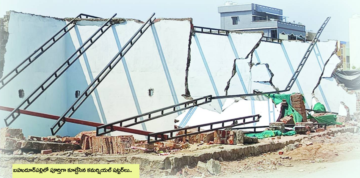
బహుదూర్ పల్లిలో పూర్తిగా కూల్చిన కమర్షియల్ షట్టర్లు..

జాగ్రత్తగా..! నెమ్మదిగా..! పిల్లలకు తగలకుండా..! ఫాటోషూట్ చర్యలు..!