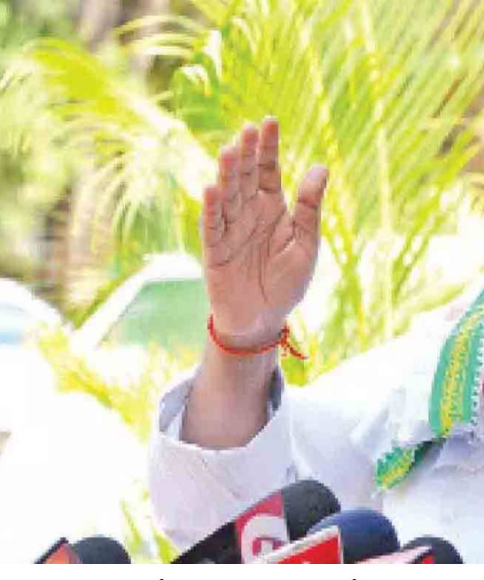
విచారణ జరిపిన హైకోర్టు.. కొంటర్ దాఖలు చేయాలని ఈ ఏడుగురు ఎమ్మెల్యేలకు ఆదేశాలు ఇచ్చింది. ఈ పార్టీ ఫిరాయింపుల వ్యవహారంలో తదుపరి విచారణను వచ్చే నెల 16వ తేదీకి వాయిదా వేస్తున్నట్లు హైకోర్టు స్పష్టం చేసింది. దీంతో పూర్తి అయిపోయింది అనుకున్న తెలంగాణ పార్టీ ఫిరాయింపుల కేసు మళ్లీ మొదటికి వచ్చింది. మరోవైపు.. ఖైతాబాద్ ఎమ్మెల్యే దానం నాగేందర్ కు ఇటీవలే హైకోర్టు నోటీసులు జారీ చేసిన సంగతి తెలిసిందే. బీజేపీ శాసనసభా పక్షనేత ఏలేటి మహేశ్వర్ రెడ్డి దాఖలు చేసిన పిటిషన్పై

హైదరాబాద్, మార్చి 26, పెన్ పవర్: తెలంగాణలో పార్టీ మారిన ఎమ్మెల్యేల విషయంలో స్పీకర్ తీర్పు వెలువరించినా.. ఈ వ్యవహారం మళ్లీ హైకోర్టుకు ఎక్కింది. స్పీకర్ నిర్ణయాన్ని రద్దు చేయాలంటూ.. పలువురు పిటిషన్లు దాఖలు చేశారు. తాజాగా ఆ పిటిషన్లను స్పీకర్లచేసిన తెలంగాణ హైకోర్టు.. కొంటర్ దాఖలు చేయాలని.. తాజాగా ఏడుగురు ఎమ్మెల్యేలకు నోటీసులు ఇచ్చింది. ఇక ఇప్పటికే ఇదే వ్యవహారంలో దానం నాగేందర్కు హైకోర్టు నోటీసులు ఇవ్వడం గమనార్హం. తెలంగాణలో పార్టీ ఫిరాయింపుల వ్యవహారం ఒక కొలిక్కి రావడం లేదు. పార్టీ మారినట్లు ఆరోపణలు ఎదుర్కొంటున్న 10 మంది ఎమ్మెల్యేల వ్యవహారంలో ఏదో ఒక నిర్ణయం తీసుకోవాలని నువ్వీకోర్టు ఇచ్చిన ఆదేశాలతో తెలంగాణ అసెంబ్లీ స్పీకర్ గడ్డం ప్రసాద్ కుమార్.. తన నిర్ణయాన్ని ఇటీవలే వెలువరించారు. 10 మంది ఎమ్మెల్యేలు పార్టీ మారినట్లు ఎలాంటి ఆధారాలు లేవని పేర్కొంటూ.. వారిపై అనర్హత వేటు వేయాలంటూ దాఖలైన పిటిషన్లను అన్నింటినీ కొట్టిపారేశారు. అయితే ఈ వ్యవహారం అంతటితో ఆగడం లేదు. స్పీకర్ గడ్డం ప్రసాద్ తీసుకున్న నిర్ణయాన్ని సవాల్ చేస్తూ.. మళ్లీ హైకోర్టులో పిటిషన్లు దాఖలుయ్యాయి. ఈ క్రమంలోనే పిటిషన్లపై చేసిన వాదనలను విన్న తెలంగాణ హైకోర్టు.. పార్టీ మారినట్లు ఆరోపణలు ఎదుర్కొంటున్న ఏడుగురు బీఆర్ఎస్ ఎమ్మెల్యేలకు తాజాగా నోటీసులు జారీ చేసింది. అదే సమయంలో స్పీకర్ గడ్డం ప్రసాద్ కుమార్ నోటీసులు ఇచ్చింది. ఇప్పటికే ఇదే వ్యవహారంలో దానం నాగేందర్కు హైకోర్టు నోటీసులు జారీ చేసింది. తాజాగా కాలే యాదయ్య, ఆరికెపూడి గాంధీ, ప్రకాష్ గౌడ్, పోచారం శ్రీనివాస్ రెడ్డి, బండ్ల కృష్ణమోహన్ రెడ్డి, తెల్లం వెంకట్రావులపై పిటిషన్లు దాఖలు అయ్యాయి. ఈ పిటిషన్లపై