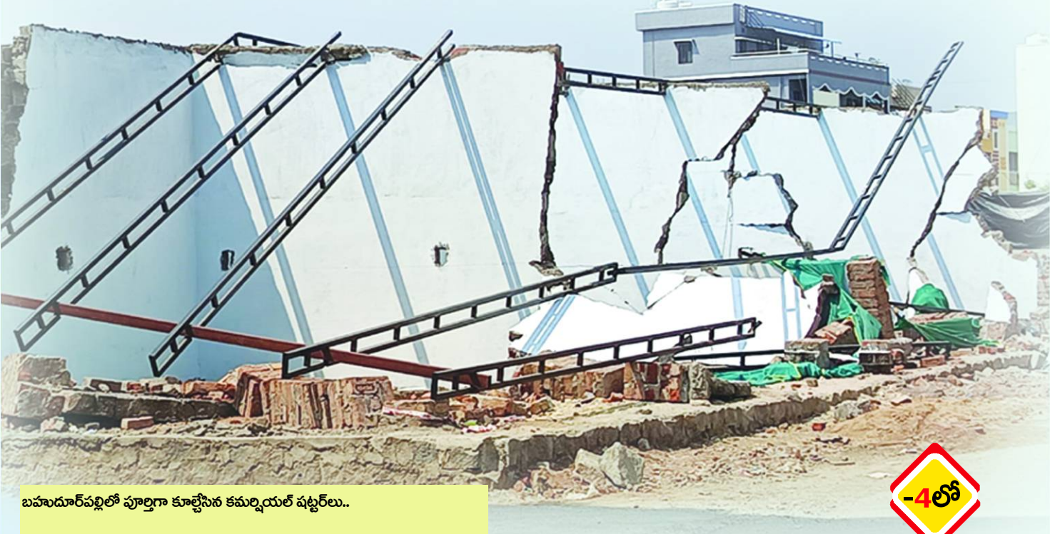
బహుదూరపుల్లో పూర్తిగా కూల్చిన కమ్మయల్ షెడ్యూల్..