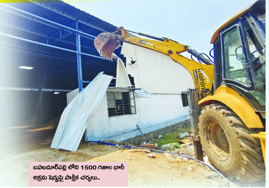
బహుదూరపుల్లోని 1500 గజాల భారీ అక్రమ షెడ్యూల్ పాక్షిక చర్యలు..

పిల్లి కక్కు మూసుకుని పాలు త్రాగినంత మాత్రాన తనను ఎవరూ చూడలేదని అనుకుంటుందట..! అదేవిధంగా ఎవరినీ అనుకున్నా మేము చేసేదే చేస్తం.. అనుకున్నదే సాధిస్తామనే ధోరణితో దుండిగల్ సర్కిల్ అధికారులు వ్యవహరిస్తున్నారని స్పష్టంపెట్టారు. దుండిగల్ టౌన్ ప్లానింగ్ అధికారులకు వచ్చిన సమస్య ఏమిటంటే..! తమ చుట్టూ ఉన్న మున్సిపాలిటీల ఏదో ఒక కూర్చివేతలు జరుపుతున్నారని.. తాము కూడా ఏదో ఒకటి చేయాలని భావించారు కాబోలు.. మరోవైపు దుండిగల్ సర్కిల్ సిఎస్పి పరిధిలో అలాంటి వాటికి చోటు ఉండదు.. వందలాది అక్రమ కట్టడాలను, నిత్యం పత్రికల్లో వచ్చే శీర్షికలతో.. ఉన్నతాధికారుల దృష్టికి తీసుకెళ్ళినా ప్రయోజనం శూన్యం.. దుండిగల్ టౌన్ ప్లానింగ్ అధికారులు గురువారం "పోరు పడలేకనే" ఏసీపీ శ్రీనివాస్ ఆధ్వర్యంలో కూర్చివేతలు జరిపినట్లు ఆరోపణలు వస్తున్నాయి.. వీటిపై నిన్ననే ఫిర్యాదు వచ్చినట్లు చర్యల ద్రామా.. గత రెండు నెలలుగా వార్తలు వచ్చినా నిమ్మకు నీరెత్తినట్లు వ్యవహారించడం "పిల్లి-పాల" సామెతను తలపిస్తుంది..