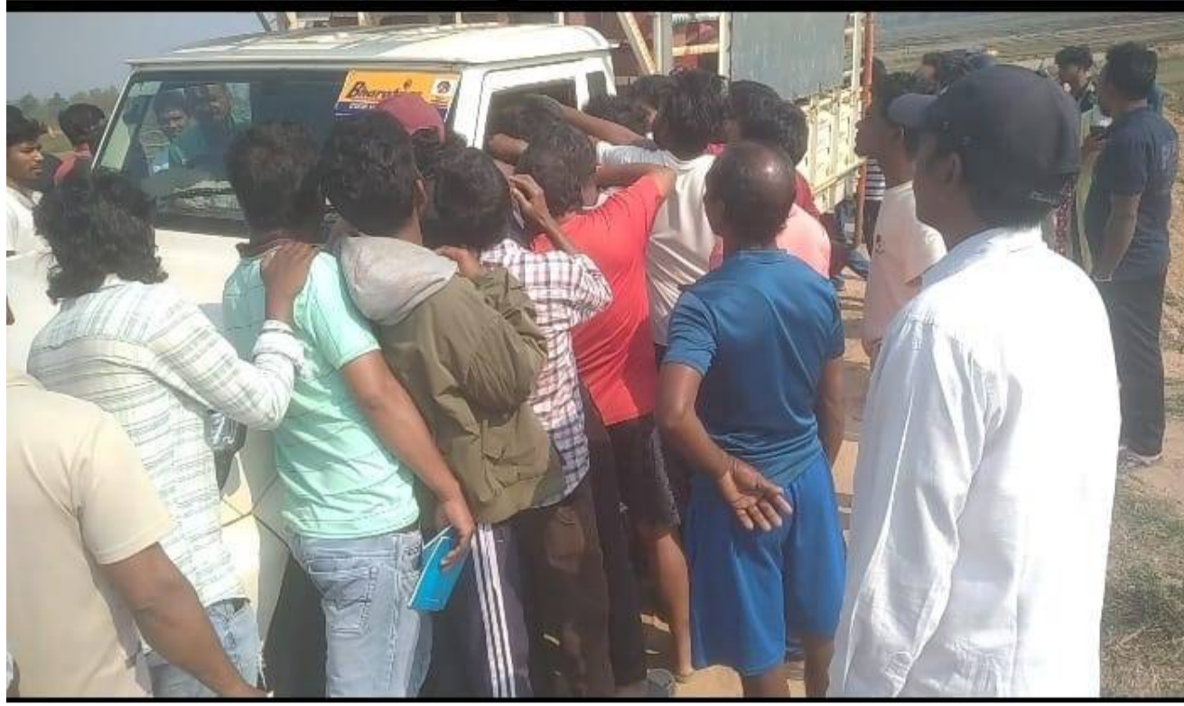
అరకులోయ పెన్ పవర్ 27: ప్రముఖ వర్కయింగ్ కేంద్రమైన ఆంధ్రప్రదేశ్ అంధాల అరకులోయ నియోజకవర్గం పరిధిలో వంట గ్యాస్ సిలిండర్ల పై ప్రజలు అవస్థలు, నల్లబజారులో తరలిపోతున్న వంట గ్యాస్ సిలిండర్ల ఒక

సిలిండర్లు 1500/ నుండి 3000/ రూపాయలకు అమ్ముతుంటున్నారని వినియోగదారులు గగ్గోలు. అరకులోయ గ్రామస్థలకు వంటగ్యాస్ వినియోగదారులకు భారత్ గ్యాస్ డీలర్లు చుక్కలు