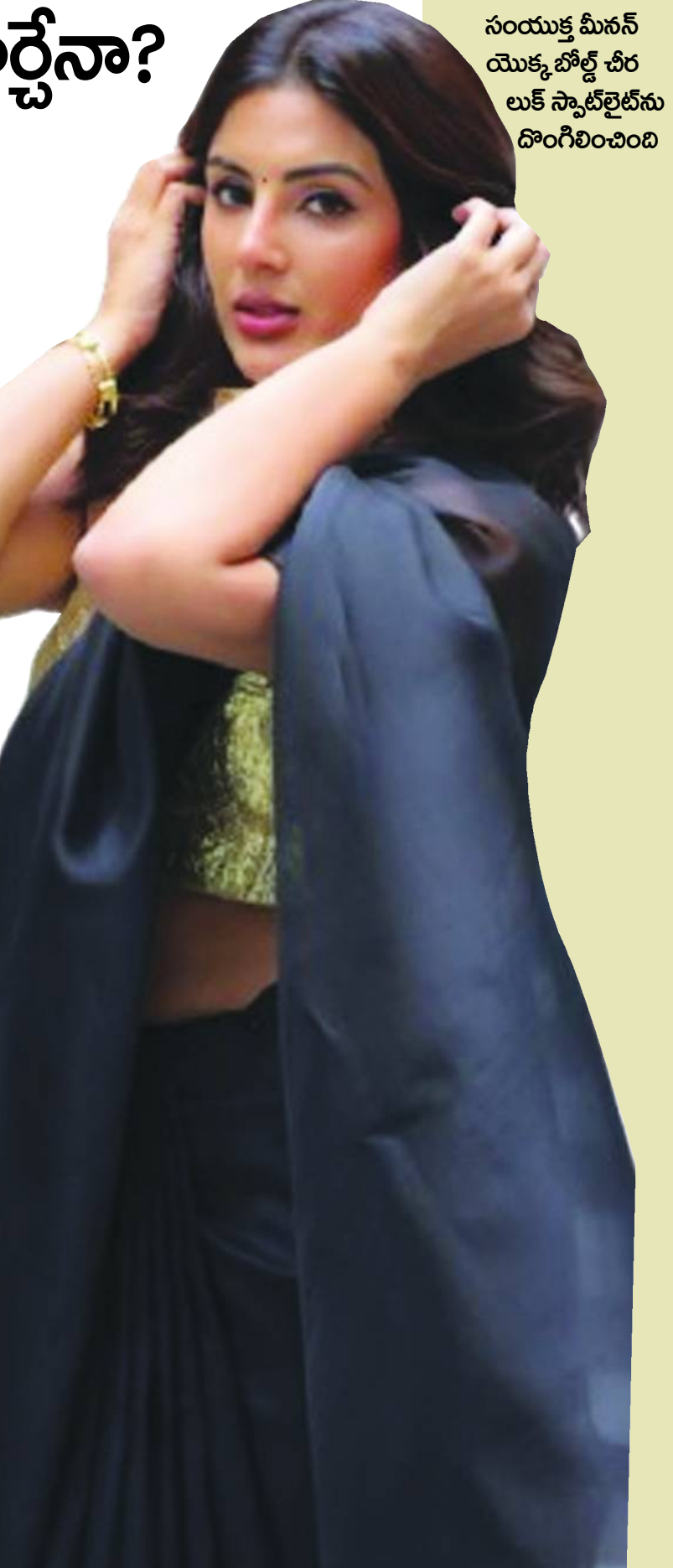
సంయుక్త మీనన్ యొక్క జోర్ట్ చీర లుక్ స్టాటల్ లోను డొంగిలించింది

పరిశీలిస్తున్నారు. ఒకరు 'ఉప్పెన' బ్యూటీ కృతి శెట్టి కాగా, మరొకరు కయాదు లోహర్. కృతి శెట్టి కెరీర్ మొదట్లో వరుస హిట్లు అందుకున్నప్పటికీ, ఈ మధ్య కాలంలో ఆమెకు ఒక్క సాలిడ్ హిట్ కూడా తగలేదు. అటు కయాదు లోహర్ కూడా తన అదృష్టాన్ని పరీక్షించుకునే వనిలో ఉంది. వీరిద్దరిలో అనిల్ ఎవరిని పైసల్ చేసినా, వారికి ఒక అదిరిపోయే కమ్ బ్యాక్ మూవీ డొరికినట్టేనని సినీ వర్గాల్లో చర్చ జరుగుతోంది. ఎందుకంటే ఇప్పటికే మినాక్షి చౌదరి లాంటి హీరోయిన్ కి తన సినిమాల ద్వారా మంచి సక్సెస్సు అందించారు. ప్రస్తుతం ఈమె వరుస సినిమాలలో అవకాశానందుకుంటూ దూసుకుపోతోంది. ఇక ఇప్పుడు మళ్ళీ అనిల్ రావుపూడి కొత్త సినిమాలో ఈ హీరోయిన్ల పేర్లు వినిపిస్తున్నాయి. కాబట్టి వీరి ఫేట్ మారుతుంది అనే కామెంట్లు వ్యక్తమవుతున్నాయి అనిల్ రావుపూడి అంటేనే 'హిట్' గ్యారెంటీ: ఇకపోతే అనిల్ రావుపూడి సినిమాలంటేనే మినిమం గ్యారెంటీ ఎంటర్టైన్ మెంట్ ఉంటుంది. పటాన్ నుండి మన శంకర వర ప్రసాద్ వరకు ఆయన ప్లాప్ ఎరగని దర్శకుడిగా పేరు తెచ్చుకున్నారు. హీరోయిన్లను చాలా ఎనర్జిటిక్ గా, బట్టిగా చూపించడంలో అనిల్ పైలే వేరు. అందుకే హిట్ కోసం కళ్ళలో ఒత్తులు వేసుకుని చూస్తున్న హీరోయిన్లకు అనిల్ సినిమా ఒక గోల్డెన్ ఛాన్స్ అని చెప్పాలి. ఈ సినిమాలో నటించే ఛాన్స్ కొట్టేస్తే, సక్సెస్ ఆటోమేటిక్ గా వారి భాతాలో పడిపోతుందని టాలీవుడ్ లో ఒక గట్టి నమ్మకం ఉంది.