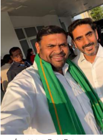
శ్రీకాళహస్తి, పెన్ పవర్, మార్చి, 28 : ఆంధ్రప్రదేశ్ రాష్ట్ర రాజధాని అమరావతికి చట్టబద్ధత కల్పించాలన్న లక్ష్యంతో కూటమి ప్రభుత్వం అసెంబ్లీ ప్రత్యేక సమావేశాన్ని ఏర్పాటు చేయడం శుభపరిణామంగా భావించబడుతోంది. రాష్ట్ర భవిష్యత్తుకు కీలకమైన ఈ అంశంపై ప్రభుత్వం ముందడుగు వేయడం పట్ల ప్రజల్లో సానుకూల స్పందన వ్యక్తమవుతోంది. ఈ సమావేశం అనంతరం మంత్రివర్గులు నారా లోకేశ్ ను మర్యాదపూర్వకంగా కలిసి, రాజధాని అమరావతి అంశంపై