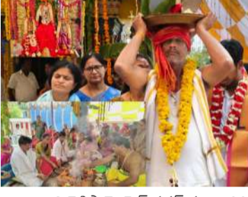
బుచ్చిరెడ్డిపాలెం పెన్ పవర్ మార్చి 28. బుచ్చిరెడ్డిపాలెం మండలం నాగమాంబాపురం శ్రీరామ కృష్ణ స్వామివారికి పట్టాభిషేకం శనివారం వైభవంగా నిర్వహించారు. స్వామి పరిమళ పుష్పాలతో ప్రత్యేక అలంకరణ చేసి, వేదమంత్రాలు