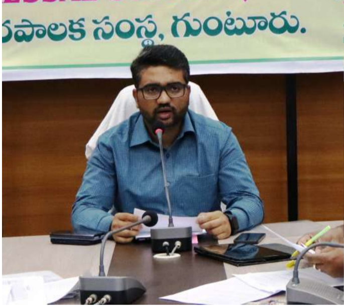
ఆదేశించామన్నారు. నిషేధ ఉత్తర్వులు ఉల్లంఘిస్తే చట్టపరమైన కఠిన చర్యలు తీసుకుంటామని స్పష్టం చేశారు. ప్రజారోగ్య అధికారులు, కార్యదర్శులు వార్డు ల వారీగా నిషేధం అమలును పర్యవేక్షణ చేయాలని ఆదేశించారు....