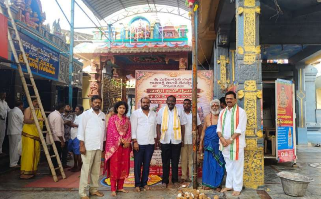
బుచ్చిరెడ్డిపాలెం పెన్ పవర్ మార్చి 28. జొన్నవారి క్షేత్రంలోని శ్రీ మల్లికార్జున స్వామి కామక్షితాయి దేవస్థానంలో మే 7, 2026 నుండి మే 17, 2026 వరకు వార్షిక బ్రహ్మోత్సవాలకు ఆది ఘట్టంగా నిర్వహించిన స్థంభ ప్రతిష్ఠ మహోత్సవం శనివారం ఆలయ ప్రాంగణం లో అత్యంత వైభవంగా జరిగింది. వేద మంత్రోచ్ఛారణల నడుమ, అర్చకుల ఆశీర్వాదాలతో ఈ పవిత్ర కార్యక్రమం భక్తిశ్రద్ధలతో నిర్వహించబడింది. దేవస్థానం అర్చకులు శాస్త్రోక్త విధానంలో స్థంభ ప్రతిష్ఠ నిర్వహించగా, భక్తులు పాల్గొని స్వామివారి, అమ్మవారి కృపకు పాత్రలయ్యారు. ఈ సందర్భంగా పూజా