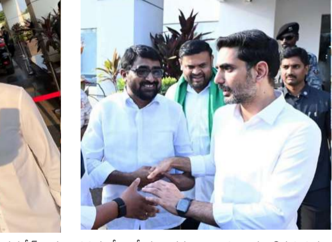
వివిధ కోణాల్లో చర్చించడం జరిగింది. రాష్ట్ర అభివృద్ధి దిశగా అమరావతి నిర్మాణానికి చట్టబద్ధత కల్పించడం అవసరమనే అంశంపై అభిప్రాయాలు వంచుకున్నారు. అలాగే, రేపు జరగనున్న తెలుగుదేశం పార్టీ ఆవిర్భావం దినోత్సవాన్ని పురస్కరించుకుని మంత్రివర్గులకు ముందస్తు శుభాకాంక్షలు తెలియజేశారు. ఈ సందర్భంగా పార్టీ భవిష్యత్ కార్యాచరణపై కూడా స్పష్టంగా చర్చ జరిగినట్లు సమాచారం.