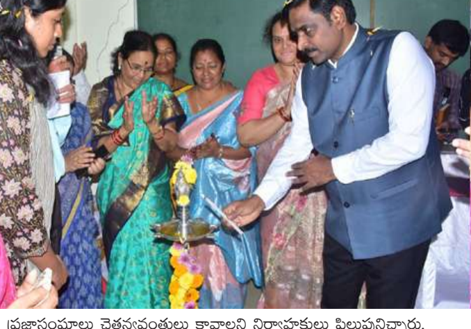
అంశాల్లో మహిళలు, ప్రజాసంఘాలు చైతన్యవంతులు కావాలని నిర్వాహకులు పిలుపునిచ్చారు.