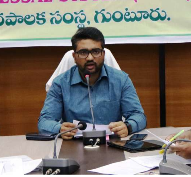
ఆదేశించామన్నారు. నిషేధ ఉత్తర్వులు ఉల్లంఘిస్తే చట్టపరమైన కఠిన చర్యలు తీసుకుంటామని స్పష్టం చేశారు. ప్రజారోగ్య అధికారులు, కార్యదర్శులు వార్డ్ ల వారీగా నిషేధం అమలును పర్యవేక్షణ చేయాలని ఆదేశించారు....