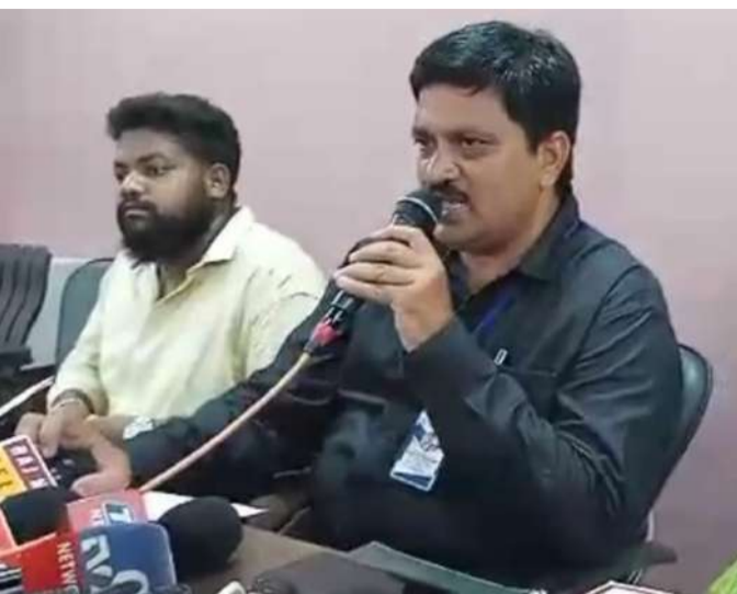
స్థిరత్వం, పెట్టుబడులు, ఉపాధి అవకాశాలు పెరుగుతాయి. గ్రామీణ వైద్యుల జాతీయ పార్టీ తరఫున మేము స్పష్టం చేస్తున్నాం---అమరావతి శాశ్వత రాజధానిగా కొనసాగాలని మేము బలంగా కోరుతున్నాం. దీనిపై ప్రభుత్వం వెంటనే స్పష్టమైన నిర్ణయం తీసుకోవాలి." ఇకపై కూడా ప్రజా ప్రయోజనాల కోసం, ముఖ్యంగా గ్రామీణ ప్రాంతాల అభివృద్ధి కోసం మా పార్టీ పోరాటం కొనసాగిస్తుందని తెలిపారు...