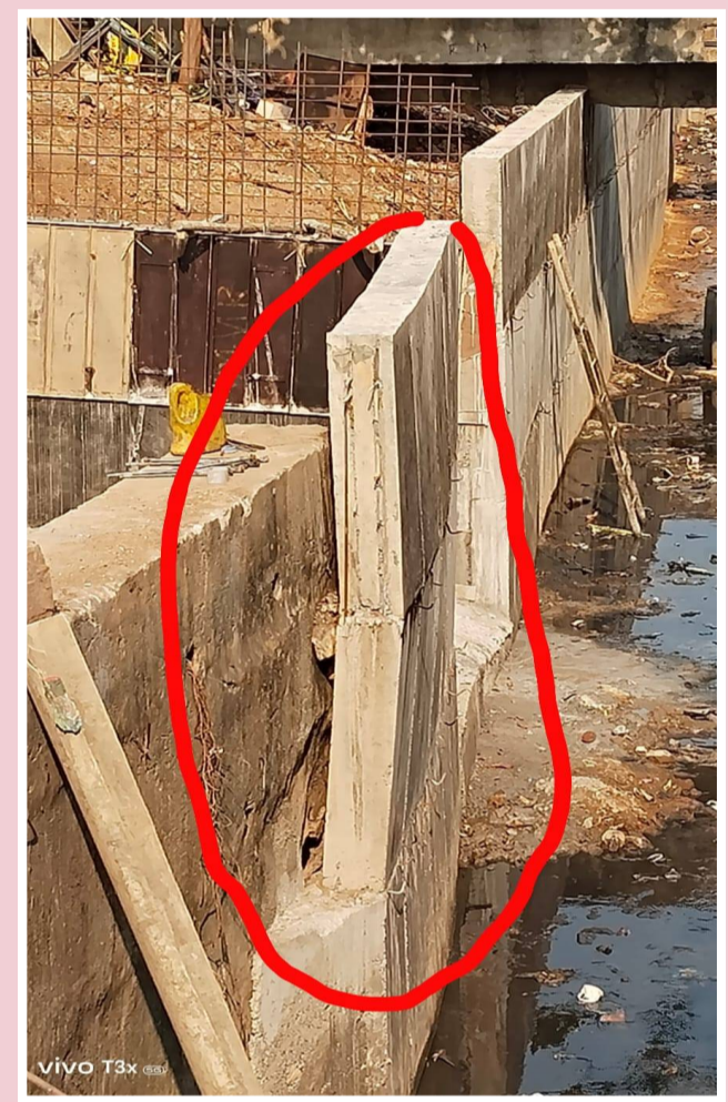
విశాఖ తూర్పు, పెన్ పవర్, మార్చి 28: తూర్పు నియోజకవర్గం 13 వ వార్డు శ్రీకాంత్ నగర్ శివాజీ నగర్ 2 ప్రాంతాలలో కొట్ల రూపాయిల