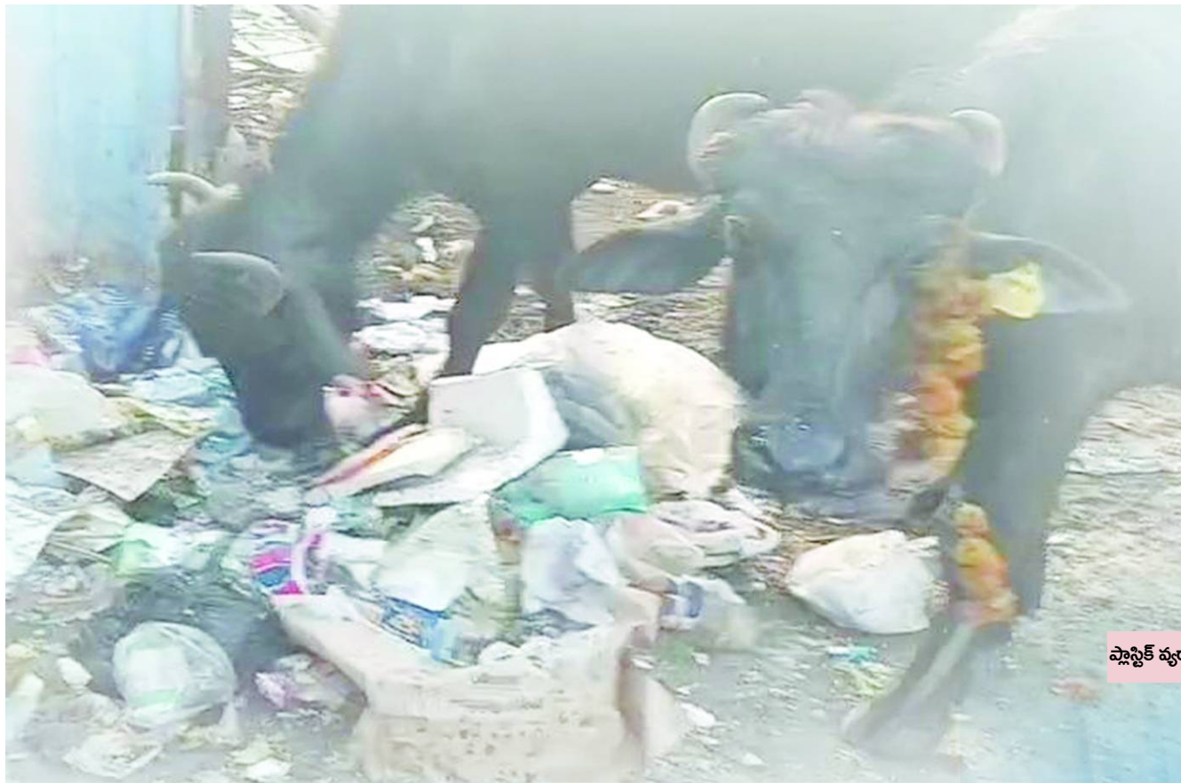
ప్లాస్టిక్ వ్యర్థాలను మేతగా తింటున్న పశువులు..