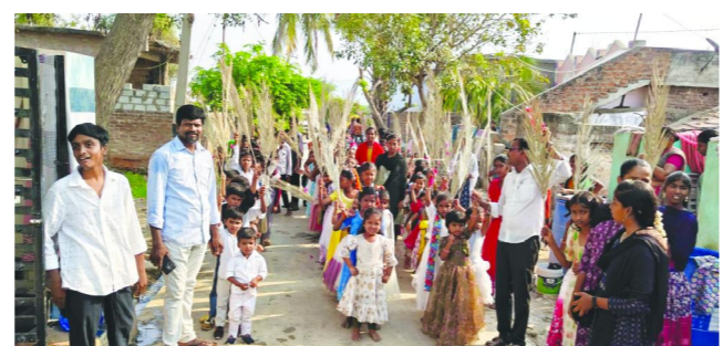
పుల్లల చెరువు పెన్ పవర్ మార్చి 29

మండల వ్యాప్తంగా క్రైస్తవులు మట్టల ఆదివారం ఘనంగా నిర్వహించారు.పట్టణ, గ్రామాల్లోని వీధుల్లో ఈత మట్టలతో ఊరేగింపు నిర్వహించారు. చర్చిలలో ప్రత్యేక ప్రార్థనలు చేశారు.పుల్లల చెరువు మండల కేంద్రంలో క్రైస్తవ భక్తి భావాలు ఉట్టిపడేలా తెలుగు బాప్టిస్ సంఘం నండేక్ స్కూల్ విద్యార్థులు నిర్వహించిన ప్రత్యేక ప్రార్థనా ర్యాలీ ఆదివారం ఆకట్టుకుంది. గుడి ప్రైడే సందర్భంగా ముందస్తుగా నిర్వహించే మట్టల ఆదివారము ఆదివారంలో భాగంగా విన్నూరులు వీధి వీధి తిరుగుతూ హోసన్నా జయం...హోసన్నా జయం...రాజుల రాజుకే జయం.. క్రీస్తు