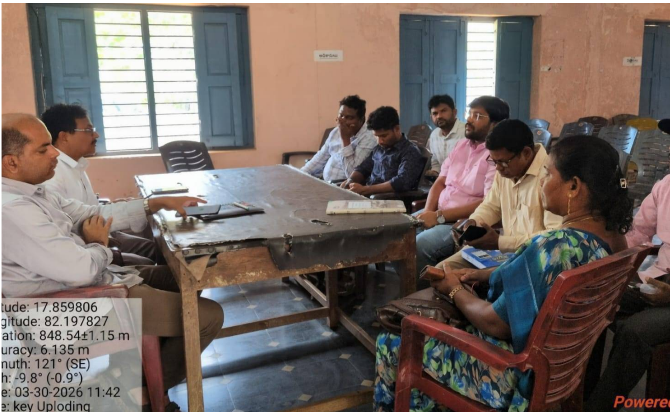
Latitude: 17.859806 Longitude: 82.197827 Altitude: 848.54±1.15 m Accuracy: 6.135 m Azimuth: 121° (SE) Pitch: -9.8° (-0.9°) Date: 03-30-2026 11:42 Key: Uploding