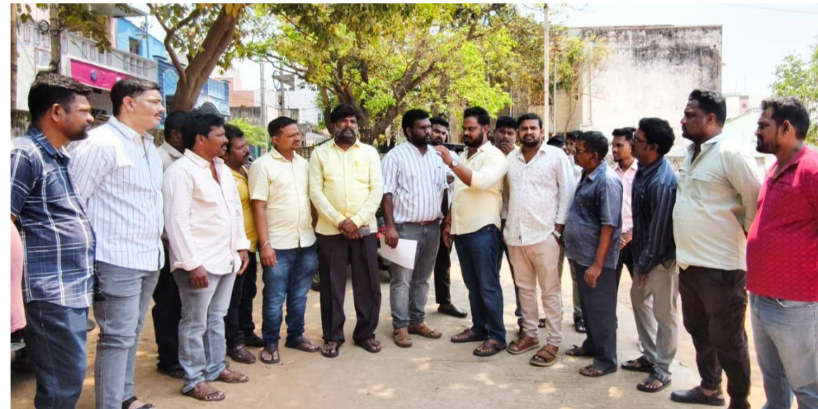
గాజువాక : పెన్ పవర్ , మార్చి 30 గ్రామాల్లో ఉన్న సంఘాల ఆహ్వానం మేరకు రాష్ట్ర గ్రీనింగ్ అండ్ జీవీఎస్ 75వ వార్డ్, ఎస్సి కాలనీ సీతానగరం , నెల్లిముక్కు బ్యూటీఫికేషన్ డైరెక్టర్, విశాఖ జిల్లా తెలుగుద్రువత