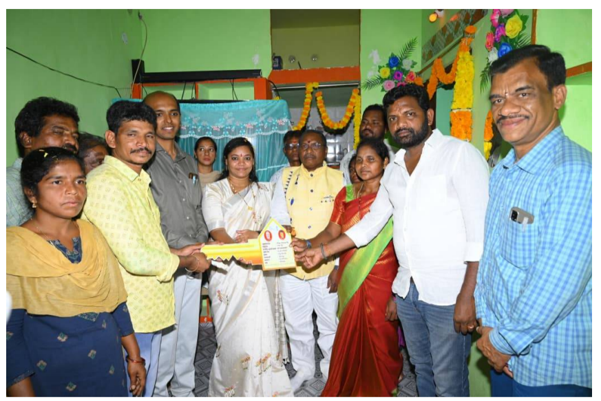
రాష్ట్రవ్యాప్తంగా 2.5 లక్షల గృహ ప్రవేశాలు రంపచోడవరం ఎమ్మెల్యే శిరీషా దేవి

గంగవరం/ రంపచోడవరం, పెన్ పవర్, మార్చి 30: పేదల సాంతింటి కల సాకారం చేయాలనే లక్ష్యంతో కూటమి ప్రభుత్వం పనిచేస్తోంది. రంపచోడవరం ఎమ్మెల్యే, రాష్ట్ర ఎస్సీ సంక్షేమ కమిటీ చైర్మన్ శిరీషా దేవి ఆధ్వర్యంలో సోమవారం రంపచోడవరం మండలం భీరంపల్లి గ్రామంలో సామాజిక గృహ ప్రవేశాల కార్యక్రమాన్ని ఘనంగా నిర్వహించారు. ఈ సందర్భంగా ఆమె మాట్లాడుతూ రాష్ట్రవ్యాప్తంగా రెండో విడతలో భాగంగా ఏకకాలంలో 2.5 లక్షల గృహ ప్రవేశాలను నిర్వహించడం ద్వారా పేదలకు ఇళ్ల కలను నిజం చేస్తున్నామని పేర్కొన్నారు. పోలవరం