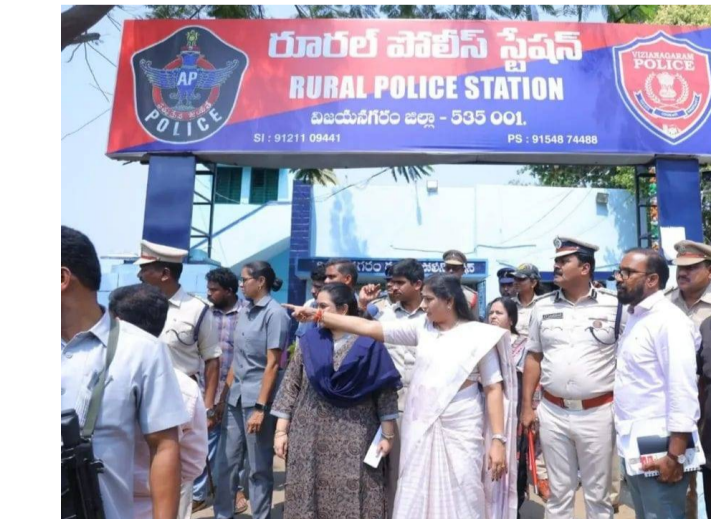
స్టాఫ్ రిపోర్టర్ పెన్ పవర్, విజయనగరం. మార్చి 30 : విజయనగరం జిల్లా పర్యటనలో భాగంగా హోం మంత్రి అనిత స్థానిక సబ్ జైలు