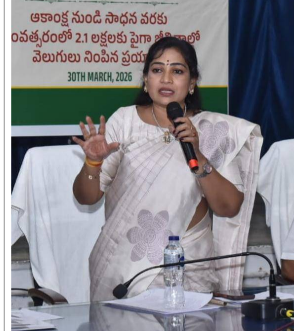
స్టాఫ్ రిపోర్టర్ పెన్ పవర్ విజయనగరం. మార్చి 30: పి-4 కార్యక్రమం ద్వారా సమసమాజ స్థాపన జరగాలిని హోం మరియు వివత్తుల నిర్వహణ శాఖ మంత్రి వంగలపూడి అనిత పేర్కొన్నారు. సోమవారం కలెక్టరేట్ కార్యాలయ ఆడిటోరియంలో నిర్వహించిన రాష్ట్ర ప్రభుత్వం

హోం మరియు వివత్తుల నిర్వహణ శాఖ మంత్రి వంగలపూడి అనిత