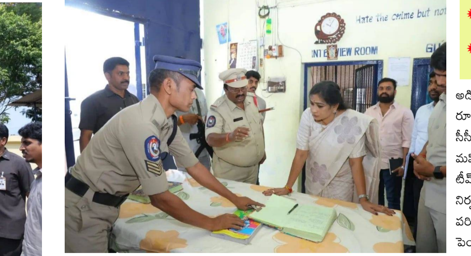
మరియు రూరల్ పోలీస్ స్టేషన్లను ఆకస్మికంగా తనిఖీ చేశారు. జైలులో రికార్డులను పరిశీలించి, ఖైదీలతో నేరుగా మాట్లాడి వారికి అందుతున్న భోజన సదుపాయాలను మంత్రి అనిత స్వయంగా