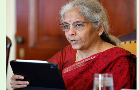
- మిగతా 2లో