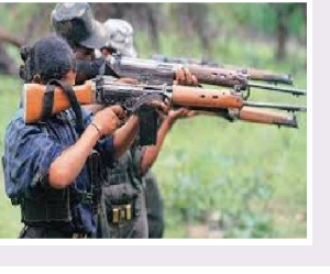
- మిగతా 2లో