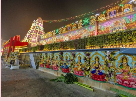
- మిగతా 2లో