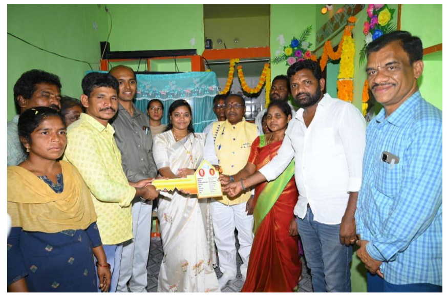
రాష్ట్రవ్యాప్తంగా 2.5 లక్షల గృహ ప్రవేశాలు రంపచోడవరం ఎమ్మెల్యే శిరీష దేవి

గంగవరం/ రంపచోడవరం, పెన్ పవర్, మార్చి 30: పేదల సాంతింటి కలను సాకారం చేయాలనే లక్ష్యంతో కూటమి ప్రభుత్వం పనిచేస్తోంది రంపచోడవరం ఎమ్మెల్యే, రాష్ట్ర ఎస్సీ సంక్షేమ కమిటీ చైర్మన్ శిరీష దేవి అన్నారు. సోమవారం రంపచోడవరం మండలం ధీరంపల్లి గ్రామంలో సామాజిక గృహ ప్రవేశాల కార్యక్రమాన్ని ఘనంగా నిర్వహించారు. ఈ సందర్భంగా ఆమె మాట్లాడుతూ రాష్ట్రవ్యాప్తంగా రెండో విడతలో భాగంగా ఏకకాలంలో 2.5 లక్షల గృహ ప్రవేశాలను నిర్వహించడం ద్వారా పేదలకు ఇళ్ల కలను నిజం చేస్తున్నామని పేర్కొన్నారు. పోలవరం