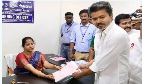
- మిగతా 2లో