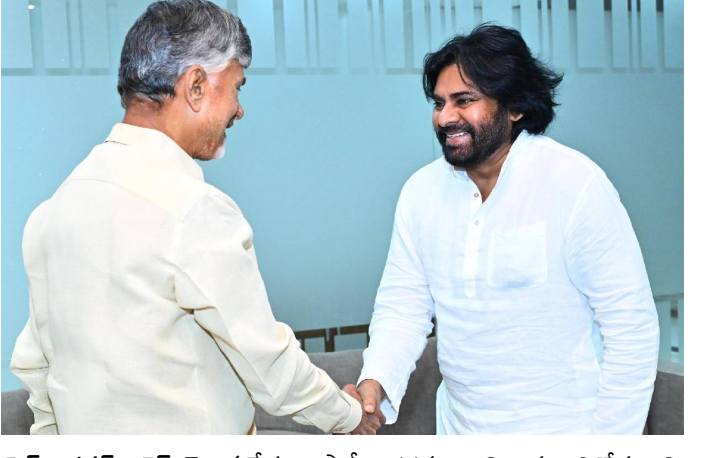
- మిగతా 2లో