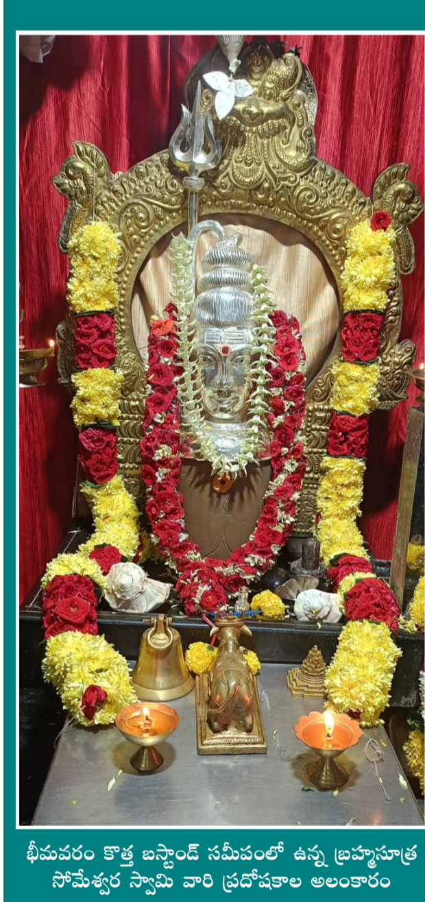
భీమవరం కొత్త బస్టాండ్ సమీపంలో ఉన్న బ్రహ్మసూత్ర సోమేశ్వర స్వామి వారి ప్రదోషకాల అలంకారం

చోడం చూస్తున్న అధికారులు సీతానగరం, పెన్ పవర్, మార్చి 30: ఇసుక రవాణా వాహనదారుల నిర్లక్ష్యానికి ద్విచక్ర వాహనదారులు బలైపోతున్నారు. ఇసుక లారీలలో నిబంధనలకు విరుద్ధంగా వాహన సామర్థ్యానికి మించి టన్నులకొద్దీ ఇసుక రవాణా సాగిస్తున్నారు. దీంతో సీతానగరం మండలంలోని ఇసుక ర్యాంపుల నుండి జరుగుతున్న తోలకాలలో అధికారులు చోడం చూస్తున్నారని వాదనలు బలంగా వినిపిస్తున్నాయి. ఇసుక లోడ్ చేసుకుని వస్తున్న లారీల నుండి నీరు కారుతూ వెనుక నుంచి వస్తున్న వాహనదారులకు బరకం కప్పక పోవడంతో ఇసుకతో పాటు నీళ్లు కూడా దారి కనబడకుండా చేస్తున్నారని వాహనదారులు ఆరోపిస్తున్నారు. నేషనల్ గ్రీన్ ట్రిబ్యూనల్ ప్రకారం నదీ గర్భంలో రోడ్ల నిర్మాణాలు చేయవచ్చా అనుమతులకు మించి నీళ్లు కారేవిధంగా నదీ గర్భంలో ఇసుక తవ్వకాలు జరపవచ్చా అనే సందేహాలు ప్రజల్లో వెలువెత్తుతున్నాయి. ప్రభుత్వ శాఖల మధ్య సమన్వయ లోపంతో ర్యాంపుల నిర్వాహకులు వరంగా మారింది. కొన్ని ఇసుక ర్యాంపులో రాత్రి పగలు తేడా లేకుండా తోలకాలు జరుగుతున్న అడపా దడపా కేసులు నమోదు చేస్తు చేతులు దులుపుకుంటున్న అధికారులు అనే వాదనలు బలంగా వినిపిస్తున్నాయి. దీనితో ర్యాంపుల నిర్వాహకులు తమ ఇష్టానుసారంగా నదీ గర్భంలో 200 పవర్ జెసిపి లతో అనుమతులకు మించి లోతుకు తవ్వతూ పర్యావరణానికి హాని చేసినట్లుగానే పాటు లంక గ్రామానికి పెనుముప్పుగా మారబోతుంది అనడంలో సందేహం లేదు. దీనిపై అధికారులు చట్ట ప్రకారం కఠిన చర్యలు తీసుకోవాలని ప్రజలు ముక్తకంఠంలో కోరుతున్నారు.