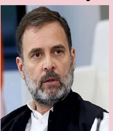
- మిగతా 2లో