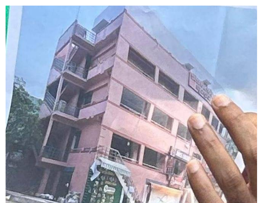
పండుగ... కార్యాలయం బయట మీడియాతో మాట్లాడుతూ, నగరంలో ఎక్కడైనా అక్రమ నిర్మాణాలను జరిగితే ఇవి ఎం ఎమ్మెల్యేకు పండుగేనని, వెంటనే అతని అనుచరులు రాబందుల్లాగా వాలిపోయి లక్షల రూపాయలు ముడుపులు వసూలు చేస్తున్నారని ఆరోపించారు. నిర్మాణం సైజును బట్టి ఐదు లక్షల నుంచి 50 లక్షల వరకు ముడుపులు వసూళ్ళు చేస్తున్నారని ఆరోపించారు. అక్రమ నిర్మాణాలను నియంత్రించాల్సిన మున్సిపల్ కార్పొరేషన్ అధికారులు ముడుపులు మత్తులో పడి అక్రమణదారులను ప్రోత్సహిస్తున్నారని, ప్రభుత్వ ఆధారానికి గండి కొడుతున్నారని భరత్ విమర్శించారు. నగరంలో వందలాది అక్రమ భవన నిర్మాణాలు విస్తృతంగా సాగుతున్నాయని భవన గతున్నాయని సీటీ వైపు కనీసం కన్వెన్షి చూసిన ప్రజా ప్రతినిధులు గాని , అధికారులు గానీ లేరన్నారు. నిత్యం రాకపోకలు సాగించే కమిషనర్ తో సహా అధికారులకు ఈ అక్రమ బిల్డింగ్ కనిపించలేదా అని ప్రశ్నించారు. ఈ బిల్డింగ్ జి ప్లన్ ఫోర్ లో , ఎటువంటి సెట్ బ్యాక్ లు లేవని, భవిష్యత్తులో ఏమైనా ప్రమాదాలు జరిగితే ఎవరిది బాధ్యత అని ఆయన ఆందోళన వ్యక్తం చేశారు. ఈ బిల్డింగ్ అక్రమ నిర్మాణం పై చర్యలు తీసుకోవాలని మహమ్మద్ ఉస్మాన్ అనే వ్యక్తి హైకోర్టును ఆశ్రయించినట్లు తెలిపారు. కార్పొరేషన్ అధికారులు విచారణ జరిపి నిర్మాణం అక్రమమని నిర్ధారణ చేసినట్లయితే చర్యలు తీసుకోవచ్చని ఆదేశించినట్లు భరత్ తెలిపారు. మున్సిపల్ కార్పొరేషన్ అధికారులు స్థానిక ప్రజా ప్రతినిధి వత్తిడికి లొంగి యజమానిపైన గాని , అక్రమ నిర్మాణాలపై చర్యలు తీసుకోవడం లేదని విమర్శించారు.

అక్రమ నిర్మాణాలను జరిగితే ఇవి ఎం ఎమ్మెల్యేకు