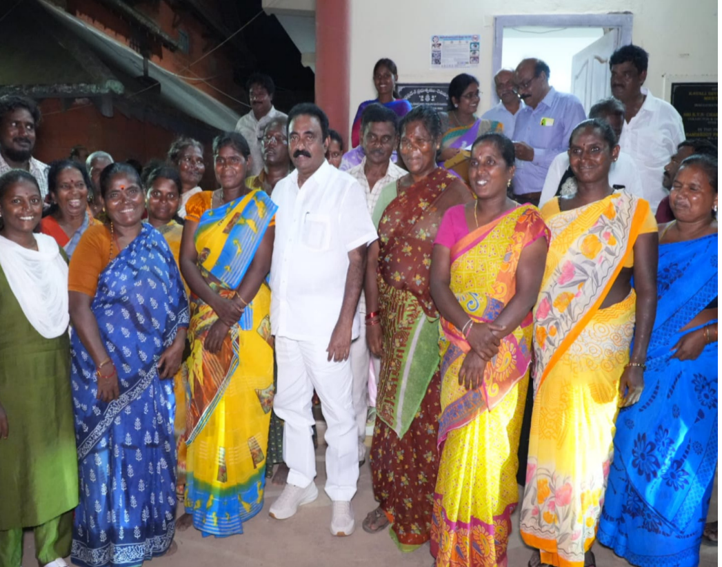
సమాజంలోని ప్రతి వర్గం కలిసికట్టుగా పని చేయాల్సిన అవసరం ఉందని సమావేశంలో స్పష్టం చేశారు. ఈ కార్యక్రమంలో అన్ని శాఖల అధికారులు, పాల్గొన్నారు.

ముందుండి సహకరించాలని ఆయన అన్నారు. ప్రభుత్వం పేదల పిల్లలకు నాణ్యమైన విద్యను అందించేందుకు కట్టుబడి ఉందని, విద్య ద్వారానే వారి భవిష్యత్తు మారుతుందని ఎమ్మెల్యే స్పష్టం చేశారు. విద్య, ఆరోగ్యం, ఉపాధి రంగాల్లో ప్రభుత్వం అమలు చేస్తున్న పథకాలు పేదల జీవితాల్లో మార్పు తీసుకువస్తున్నాయని పేర్కొన్నారు. రాష్ట్ర ముఖ్యమంత్రి నారా చంద్రబాబునాయుడు రాష్ట్ర అభివృద్ధిలో కీలక పాత్ర పోషిస్తున్నారని ఎమ్మెల్యే తెలిపారు. 2047 నాటికి పేదలందరినీ బంగారు కుటుంబాలుగా తీర్చిదిద్దాలనే లక్ష్యంతో ముఖ్యమంత్రి ఎంతో కృషి చేస్తున్నారని కొనియాడారు. రాష్ట్ర సమగ్ర అభివృద్ధి కోసం ముఖ్యమంత్రి తీసుకుంటున్న నిర్ణయాలు, అమలు చేస్తున్న పథకాలు ప్రజలకు మేలు చేస్తున్నాయని అన్నారు. ఈ కార్యక్రమంలో అధికారులు, ప్రజాప్రతినిధులు, స్వచ్ఛంద సంస్థల ప్రతినిధులు పాల్గొని తమ సూచనలు, అభిప్రాయాలను వెల్లడించారు. పేదల అభివృద్ధి కోసం ప్రభుత్వంతో పాటు