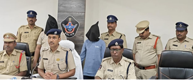
యానం,పరిసర ప్రాంతాల్లో దొంగతనాలకు పాల్పడ్డారు.. దొంగతనం చేసిన దబ్బలతో సోదీ,గోవా, ముసోరి, ప్రాంతాలకు విహారయాత్రలకు వెళుతూ ఉంటారు...!