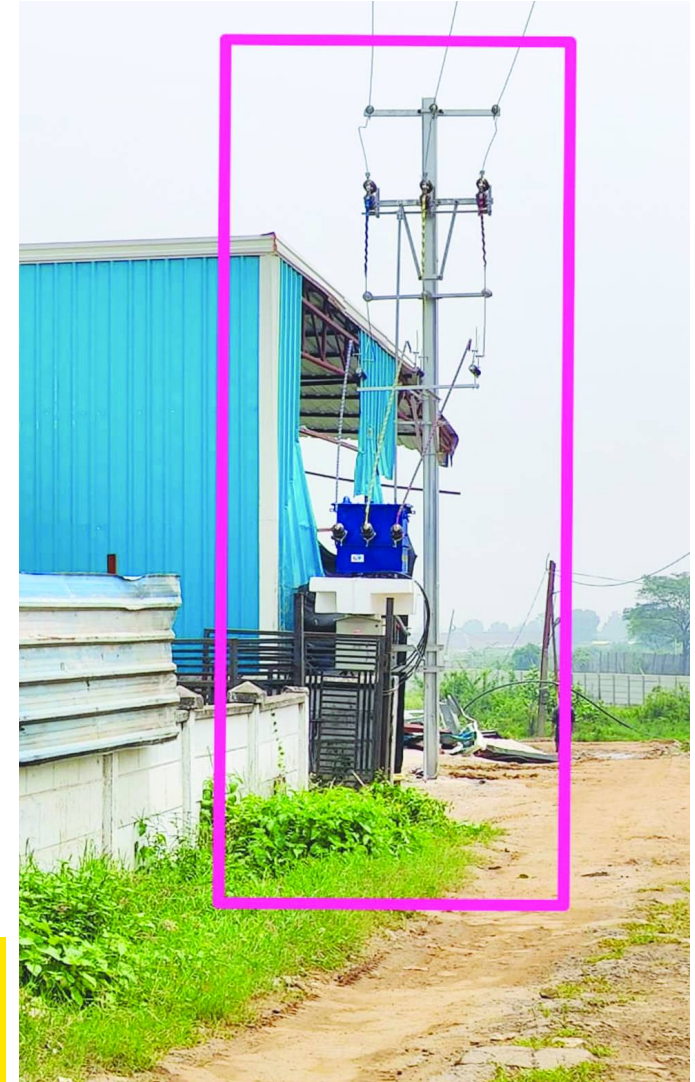
రెవెన్యూ కౌన్సిలర్ అక్రమ షెడ్యూల్, విద్యుత్ అధికారుల పైవేటు ట్రాన్స్ఫార్మర్..