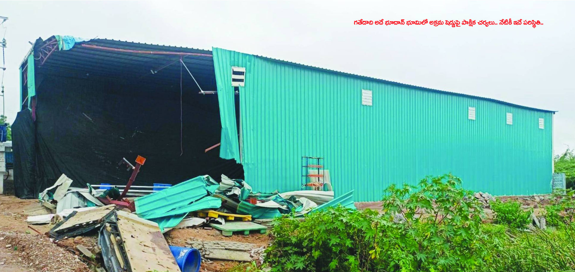
గతేదాది అదే భూదాన్ భూమిలో అక్రమ షెడ్యూల్ పాక్షిక చర్యలు.. నేటికీ ఇదే పరిస్థితి..