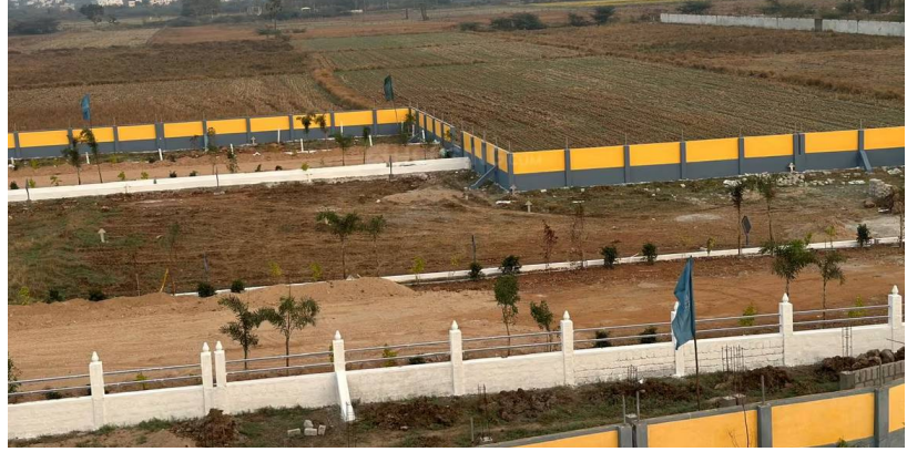
సమ్మిల్ తర్వాత అంతర్జాతీయ సంస్థలు ఇక్కడ డేటా సెంటర్లు ఏర్పాటు చేసేందుకు ఆసక్తి చూపుతుండటంతో భూములు ఉన్న వాళ్లు చాలా జాగ్రత్తగా నిర్ణయాలు తీసుకుంటున్నారు.

లేఅవుట్ ఎక్కడ ఉంటుంది? అనే గందరగోళంలో ఉన్నారు. ఈ సృష్టత వచ్చే వరకు కొత్త రిజిస్ట్రేషన్లు చేయడం కంటే, ఉన్న భూమిని కాపాడుకోవడం మిన్న అని రియల్టర్లు భావిస్తున్నారు. ప్యూవర్ సిటీ ప్రభావం కేవలం ముచ్చర్ కే వరిమితం కాకుండా, కందుకూర్, యాచారం, మహేశ్వరం, ఆమనగల్ వరకు పాకింది. 20 కిలోమీటర్ల రేడియస్ లో ఎక్కడ చూసినా ప్యూవర్ సిటీ కి చేరువలో ఉన్న వెంచర్ల గురించే చర్చ జరుగుతోంది. శ్రీశైలం హైవే, నాగార్జున సాగర్ హైవేలను కలిపేలా ప్రతిపాదించిన 41 కిలోమీటర్ల గ్రీన్ ఫీల్డ్ ఎక్స్ ప్రెస్ వే ఈ ప్రాంతపు రూపురేఖలను మార్చబోతోంది. దీంతో ఎకరం ధర కొన్ని చోట్ల కోట్లకు చేరుకోగా, చిన్న ఇన్వెస్టర్లు మాత్రం ఇప్పుడు అదుగు పెట్టాలా వద్దా అనే సందర్భంలో వద్దారు. తెలంగాణ ప్రభుత్వం దీనిని కేవలం ఒక సిటీగా కాకుండా, భారతదేశపు మొదటి నెట్ జిరో గ్రీన్ ఫీల్డ్ స్మార్ట్ సిటీగా తీర్చిదిద్దాలని లక్ష్యంగా పెట్టుకుంది. గ్లోబల్ ఏబి