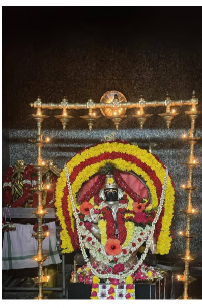
సమన్వయంతో కార్యక్రమాన్ని విజయవంతంగా నిర్వహించారు.