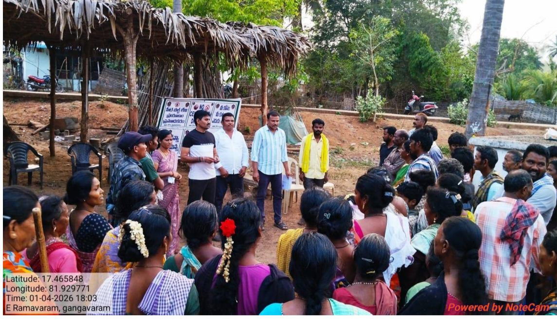
Latitude: 17.465848 Longitude: 81.929771 Time: 01-04-2026 18:03 E Ramavaram, gangavaram