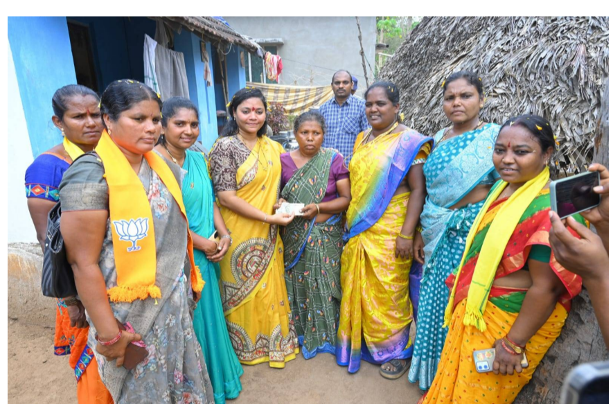
రంపచోడవరం ఎమ్మెల్యే శిరీష చేపి