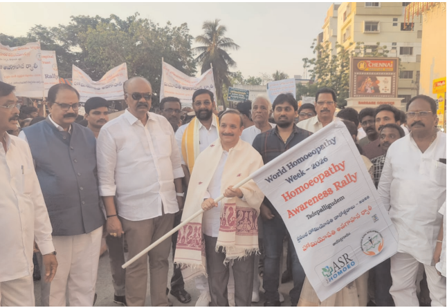
పి.ఎన్.ఆర్ హెచ్.ఎం.సి మరియు యు.వి.ఆర్.డి.టి ఆధ్వర్యంలో భారీ ర్యాలీ

తాడేపల్లిగూడెం, పెన్ పవర్, ఏప్రిల్ 01: ప్రపంచ హోమియోపతి అవగాహన వారోత్సవాల ప్రారంభం సందర్భంగా, పి.ఎన్.ఆర్ హోమియోపతికే మెడికల్ కాలేజీ ౬ హాస్పిటల్ మరియు ఉమర్ అలీషా రూరల్ డెవలప్ మెంట్ ట్రస్ట్ సంయుక్త ఆధ్వర్యంలో నేడు తాడేపల్లిగూడెంలో భారీ హోమియోపతి అవగాహన ర్యాలీ నిర్వహించబడింది. భారతీయ హోమియోపతి: సాంప్రదాయ జ్ఞానం నుండి స్పష్టమైన విజ్ఞానం వరకు అనే ఇతివృత్తంతో జరిగిన ఈ కార్యక్రమం, హోమియోపతి వైద్యం యొక్క శాస్త్రీయత మరియు ప్రాముఖ్యతపై ప్రజలకు అవగాహన కల్పించే లక్ష్యంతో నిర్వహించబడింది.