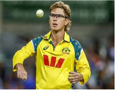
నాణ్యమైన స్పిన్ అటాకా అందుబాటులో ఉండడంతో వికెట్ స్పిన్నర్లు పెద్దగా డిమాండ్ ఉండటం లేదు. జంపా వ్యాఖ్యలు ఇదే విషయాన్ని స్పష్టం చేస్తున్నాయి.