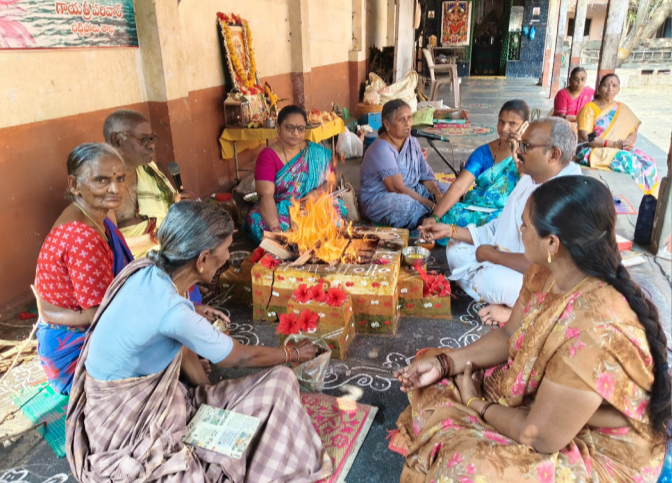
మహిళా సమాజం వారు ఈ హోమంలో పాల్గొని కార్యక్రమంను విజయవంతం చేశారు