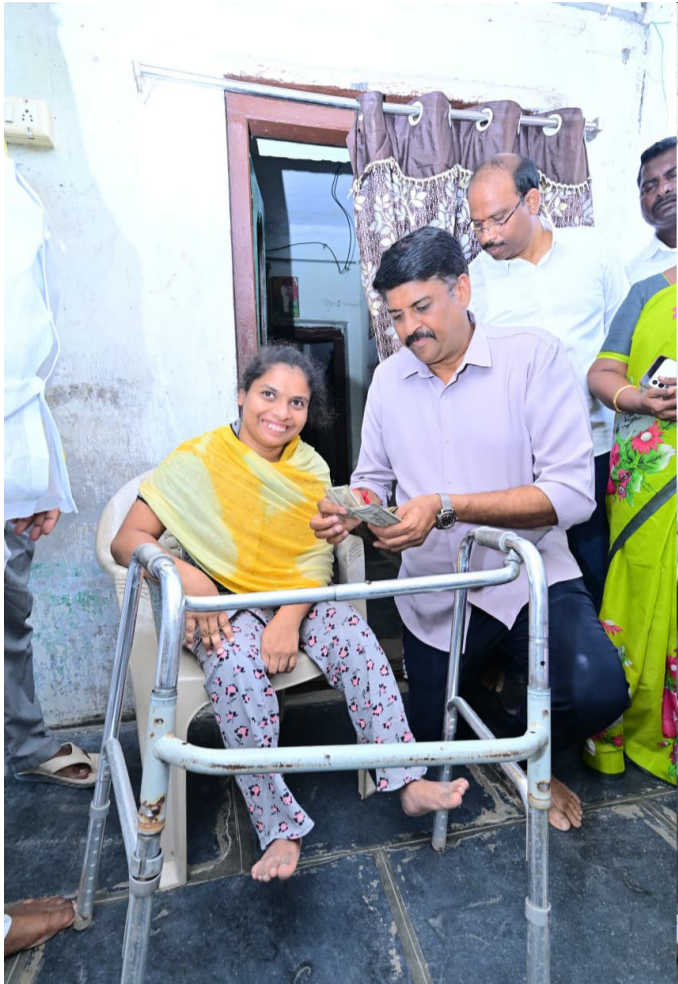
పాల్గొన్నారు. తమ వద్దకు నేరుగా వచ్చి పెన్షన్ అందించిన ఎమ్మెల్యే కి లబ్ధిదారులు కృతజ్ఞతలు తెలియజేశారు.