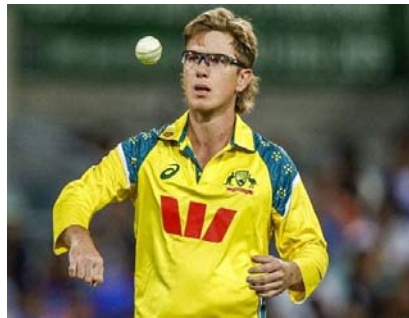
నాణ్యమైన స్పిన్ అటాగ్రేట్ అందుబాటులో ఉండటంతో వరకే స్పిన్నర్లు పెద్దగా డిమాండ్ ఉండటం లేదు. అంపా వ్యాఖ్యలు ఇదే విషయాన్ని స్పష్టం చేస్తున్నాయి.

హైదరాబాద్ పెన్ పవర్: ప్రపంచంలోని అత్యుత్తమ వైట్ బాల్ స్పిన్నర్లలో ఒకడైన ఆస్ట్రేలియా లెగ్ స్పిన్నర్ ఆడమ్ జంపా, బవీఎల్ 2026 వేలానికి దూరంగా ఉండటంపై సంచలన వ్యాఖ్యలు చేశాడు. తన స్పెషలిటీ బవీఎల్లో సైదన విలువ, డబ్బు లభించడం లేదని, అందుకే ఈ లీగ్లో ఆడటం లేదని స్పష్టం చేశాడు. ప్రస్తుతం అంపా పాకిస్థాన్ సూపర్ లీగ్ (షీవెన్ఎల్)లో కరాచీ కింగ్స్ తరఫున ఆడుతున్నాడు. ఇటీవల ఒక పాకిస్థాన్ మాజీబాటర్ అంపా తన అసంతృప్తిని బయటపెట్టాడు. "ఈ ఏడాది నేను బవీఎల్ నుంచి తప్పుకున్నాను. గెలం చెప్పాలంటే, నా డాంట్ స్పెషల్ ఇన్ ఆట అంటే బవీఎల్లో ఇక స్పెషలిటీలు ఉన్నవారికి లభించేంత డబ్బు లేదు. బవీఎల్ కోసం చాలా సమయం కేటాయించాల్సి ఉంటుంది. కానీ, అందుకు తగిన ప్రతిఫలం లేకపోవడం అంత సమయం వెచ్చించడం సరైన నిర్ణయం అని నాకు అనిపించలేదు" అని అంపా వివరించాడు. గతంలో న్యూజిల్లా హైదరాబాద్ (వెన్ఎల్సా-సి) అంపాను మదలం చేయగా, అతను ఈసారి వెలం కోసం తన సేవను సమోదు చేసుకోలేదు. 2016లో రైజింగ్ ఫుట్ సూపర్ కెయింట్లో అరంగేట్రం చేసిన అతను, ఆ తర్వాత రాయల్ ఛారింట్స్ బెంగళూరు (ఆరీవీ), రాజస్థాన్ రాయల్స్ (ఆరీఆర్) జట్లకు కూడా ప్రాతినిధ్యం వహించాడు. మొత్తం 22 బవీఎల్ మ్యాచ్లలో 8.37 అవగామీ రేటుతో 31 వికెట్లు పడగట్టాడు. అయితే, ఏ సీజన్లోనూ అతను కంటే ఎక్కువ మ్యాచ్లు ఆడలేకపోయాడు. ఓవీఎల్లో ఆటలాటం దివి నిమిత్తంగా తనకున్న నిర్ణయమని అంపా తెలిపాడు. మొదట విల్లంబీ అంకేషనరీని ఛాంపియా, వెల లోఅల క్రికెట్ ఓవీఎల్ నుంచి అవకాశం రావడంతో వెలంకి అంకేషనరీనించి చెప్పాడు. బవీఎల్ నియంత్రణ ప్రకారం కుడి జట్టులో సలుగురు వరకే అటాగ్రేట్ అవకాశం ఉంటుంది. టీతో ప్రాతినిధ్యం ఎక్కువగా పవర్ హ్యాట్లు, ఆల్-రౌండ్లు, ఫాస్ట్ బౌలర్ కోసం ఖాకీ మొత్తంలో ఖర్చు చేస్తాయి. స్పిన్నర్ విషయంలో ఖాకీలో