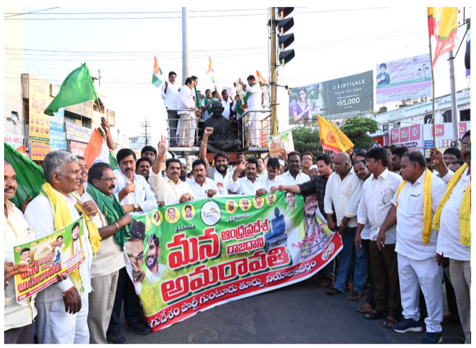
పేన్ పవర్ కారంపూడి ఏప్రిల్ 2:- ఆంధ్రప్రదేశ్ రాష్ట్రానికి ఏకైక రాజధాని అమరావతిగా కేంద్ర ప్రభుత్వం ప్రకటించినా ఆమోదించడము చాలా హర్షించదగిన విషయం అని కూటమి నేతలు అన్నారు. ఎన్నో ప్రభుత్వానికి, ముఖ్యమంత్రి నారా చంద్రబాబు నాయుడు, డిప్యూటీ సీఎం పవన్ కళ్యాణ్ కు కూటమి పార్టీల నాయకులు గురువారం సాయంత్రం కృతజ్ఞతలు తెలిపారు. స్థానిక బస్టాండ్ సెంటర్ వద్ద