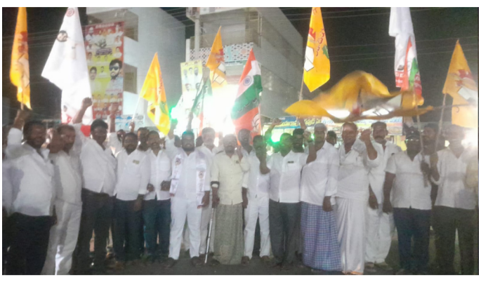
కూటమి పార్టీల నాయకులు పెద్ద ఎత్తున భావానందా పేల్చి, సంబరాలు చేపట్టారు. జై చంద్రబాబు.. జై జై అమరావతి అంటూ నినాదాలతో వట్టణం అంత మార్యోగించారు. అనంతరం వారు మాట్లాడుతూ... నేడు శాశ్వత రాజధాని అమరావతిగా చట్టబద్ధత కల్పించి, ఏపీ ప్రజలకు ముఖ్యమంత్రి చంద్రబాబు అంకితమిచ్చారని కొనియాడారు. పార్లమెంట్లో దేశవ్యాప్తంగా ఆస్తి పార్టీలు మద్దతిస్తే... వైసీపీ పార్టీ మాత్రం వ్యతిరేకించడం సిగ్గుచేటని మండిపడ్డారు. తెలుగు జాతి ప్రయోజనాల కోసం అహర్నిశలు కృషి చేస్తున్న వ్యక్తి చంద్రబాబు అని ప్రశంసించారు. ఈ కార్యక్రమంలో కూటమి పార్టీల నాయకులు, కార్యకర్తలు పాల్గొన్నారు.