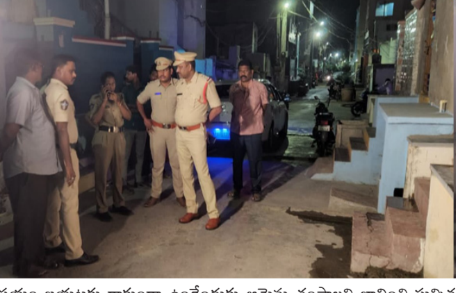
విషయం బయటకు రాకుండా ఉండేందుకు ఆమెను చంపాలని భావించి సున్నిత ప్రదేశంలో ఇసుక రాడ్లతో పొడిచి తీవ్రంగా గాయపరచాడు. బాధితురాలు స్పృహ తప్పిపోవడంతో చనిపోయిందని భావించి దుండగుడు అక్కడి నుంచి పరారయ్యాడు. కొంతసేపటికి స్పృహలోకి వచ్చిన బాధితురాలు సత్యపల్లిలోని తన తల్లికి ఫోన్ ద్వారా సమాచారం అందించారు. తల్లి తన కుమారుడికి ఫోన్ చేసి, అక్కను కాపాడాలని కోరారు. అతను తన స్నేహితులకు చెప్పగా వారు స్థానికుల సహాయంతో బాధితురాలి కళ్ళు తొలగించి పోలీసులకు సమాచారమందించారు. పోలీసులు వెంటనే బాధితురాలిని స్థానిక ప్రభుత్వస్పృత్రికి తరలించారు.

మాచర్ల (పల్నాడు జిల్లా) : పేన్ పవర్, ఏప్రిల్, 02 : పల్నాడు జిల్లా మాచర్ల పట్టణంలో సభ్య సమాజం తలదించుకునే అమానుష ఘటన జరిగింది. ఒంటరిగా ఉన్న ప్రభుత్వ ఉద్యోగిని ఓ దుర్మార్గుడు లైంగిక దాడికి పాల్పడటమే కాకుండా ఆమెను హత్య చేసేందుకు యత్నించారు. పోలీసుల తెలిపిన వివరాల మేరకు...పట్టణంలోని ఓ మహిళ స్థానిక ప్రభుత్వ కార్యాలయంలో అటెండర్ గా పనిచేస్తున్నారు. గురువారం మధ్యాహ్నం సుమారు మూడు గంటల సమయంలో గుర్తు తెలియని దుండగుడు వచ్చి మంచినీరు కావాలని అడగడంతో నీరు తెచ్చేందుకు ఆమె ఇంటి లోపలికి వెళ్లిపోయారు. దుండగుడు ఆమెను అనుసరిస్తూ ఇంట్లోకి చొరబడ్డాడు. కత్తితో బెదిరించి, చున్నీతోనే కాళ్ళు చేతులు కట్టివేసి అత్యాచారానికి ఒడిగట్టాడు.