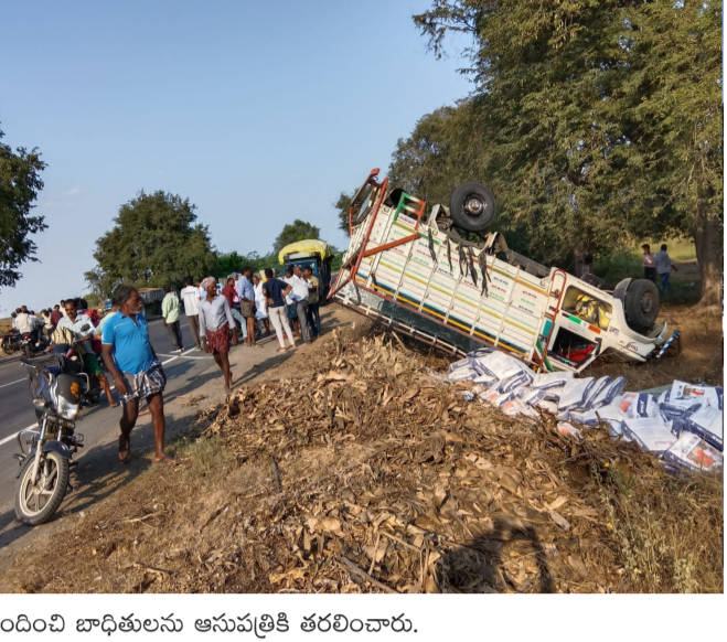
స్పందించి బాధితులను ఆసుపత్రికి తరలించారు.

చిలకలూరిపేట రూర్ట్, పేన్ పవర్, ఏప్రిల్ 02: నాదెండ్ల : గుంటూరు - కర్నూలు జాతీయ రహదారిపై గురువారం భారీ ప్రమాదం చోటుచేసుకుంది. మండలంలోని సాతులూరు రైల్వే స్టేషన్ సమీపంలో అతివేగంతో వచ్చిన ఒక అటోక్ లేదాడ్ మినీ లారీ బీభత్సం సృష్టించింది. సదరు వాహనం రాంగ్ రూట్ (తప్పుడు మార్గం) లోకి ప్రవేశించి, ఎదురుగా వస్తున్న ఆరు ద్విచక్ర వాహనాలను ఒకదాని తర్వాత ఒకటిగా బలంగా ఢీకొట్టింది. ఈ క్రమంలో నియంత్రణ కోల్పోయిన మినీ లారీ రహదారిపైనే బోల్తా వడింది. ఈ ప్రమాదంలో బైక్లపై ప్రయాణిస్తున్న వారు తీవ్రంగా గాయపడగా, స్థానికులు వెంటనే