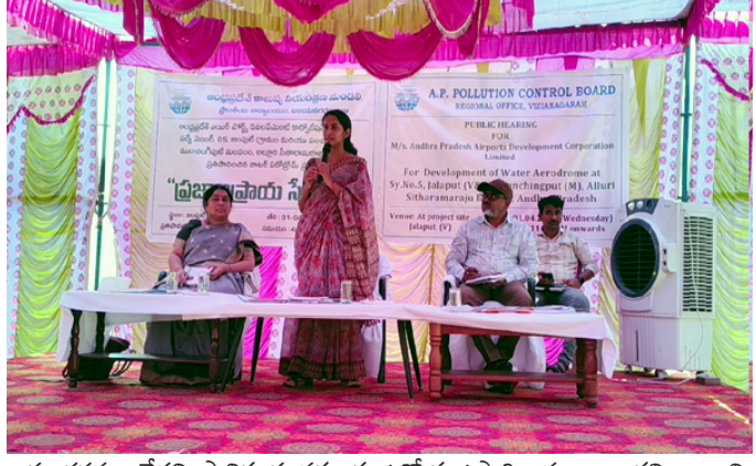
అభ్యంతరమా లేదని, స్థానిక యువతకు ఉద్యోగ, ఉపాధి అవకాశాలు కల్పించాలని కోరారు. ఆరో నగర్ నుంచి పాలగడ్డ వరకు అప్రవృత్తంగా ఉన్న రహదారి నిర్మాణ పనులు పూర్తి చేస్తేనే ఈ ప్రాంతానికి పర్యాటకులు వచ్చే అవకాశముందన్నారు.