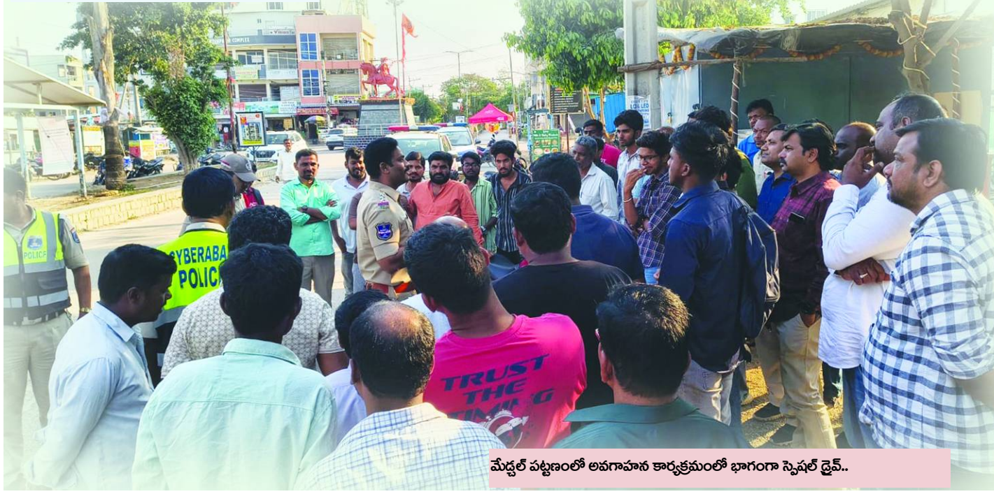
మేడ్చల్ పట్టణంలో అవగాహన కార్యక్రమంలో భాగంగా స్పెషల్ డైవ్..