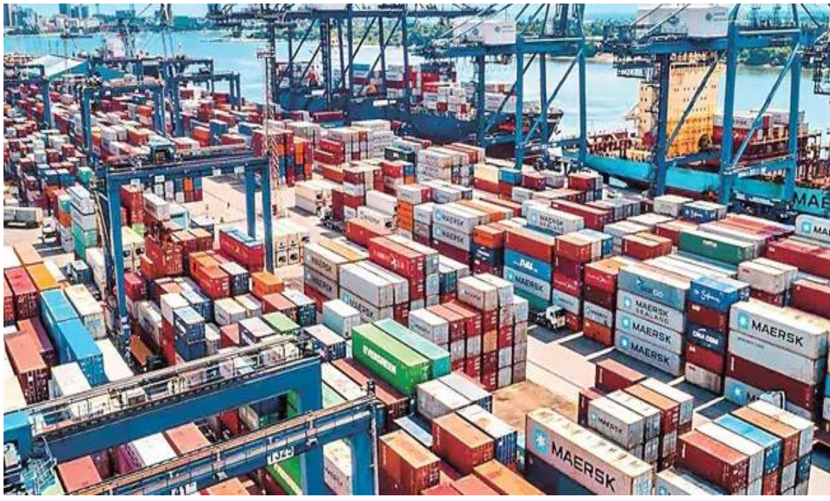
తెలిసిందే. దీంతో ముడిపమురు, గ్యాస్, ఎరువులు, ఇతర ఫెట్రొలియం ఉత్పత్తులకు భారత్ ప్రధాన రహదారుల దిగుమతులపై ఆందోళనలు నెలకొన్నాయి. దిగుమతిదారుగా ఉంది.

పశ్చిమాసియా ఉద్రిక్తతల ప్రభావం దేశ ప్రజలపై పడకుండా ఉండేందుకు కేంద్రం చర్యలు ముమ్మరం చేస్తోంది. ఇప్పటికే పెట్రోల్, డీజిల్పై విధిస్తున్న అదనపు ఎక్సైజ్ ద్యూటీని తగ్గించిన సంగతి తెలిసిందే. తాజాగా కొన్ని కీలక పెట్రో కెమికల్ ఉత్పత్తులకు దిగుమతి సుంకాన్ని మినహాయించింది. నేటి (ఏప్రిల్ 2) సుంచి జూన్ 30 వరకు ఈ మినహాయింపు అమల్లో ఉండనుంది. ఈ మేరకు కేంద్ర ఆర్థిక మంత్రిత్వశాఖ ఓ ప్రకటన విడుదల చేసింది. "దేశీయ పరిశ్రమకు కీలకమైన పెట్రో కెమికల్ ముడిసరకుల లభ్యతకు అటంకం కలగకుండా చూడటం, దీనిపై ఆధారపడిన రంగాలపై వ్యయ ఒత్తిళ్లను తగ్గించడం, దేశంలో సరఫరా స్థిరత్వాన్ని కాపాడటం కోసం ఈ చర్యలు చేపట్టాం. అయితే, ఈ కస్టమ్స్ ద్యూటీ మినహాయింపు తాత్కాలికమే. దీనివల్ల తుది ఉత్పత్తులను కొనుగోలు చేసే వినియోగదారుల పైనా అదనపు భారం పడకుండా ఉపశమనం లభిస్తుంది" అని ఆర్థిక మంత్రిత్వశాఖ తమ ప్రకటనలో వెల్లడించింది. మిథనాల్, అసిప్రాడ్రెన్ అమోనియా, డైక్లోమిథేన్, విన్లెక్ కోరెడ్ మోనోమర్, స్టైరీన్, పాలి బ్యూటడిన్, స్టైరీన్ బ్యూటడిన్, అసిథానోబెన్ పాలిస్టర్ రసిన్స్ వంటి పెట్రో కెమికల్స్కు దిగుమతి సుంకాన్ని మినహాయించారు. ఈ నిర్ణయంతో ప్లాస్టిక్, టెక్స్టైల్స్, ఫార్మా, ఆటో, కెమికల్ రంగాలకు లాభం చేకూరనుందని కేంద్రం పేర్కొంది. పశ్చిమాసియాలో యుద్ధం కారణంగా హర్యాకత్ మీదుగా సరకు రవాణాకు అంతరాయం ఏర్పడిన సంగతి