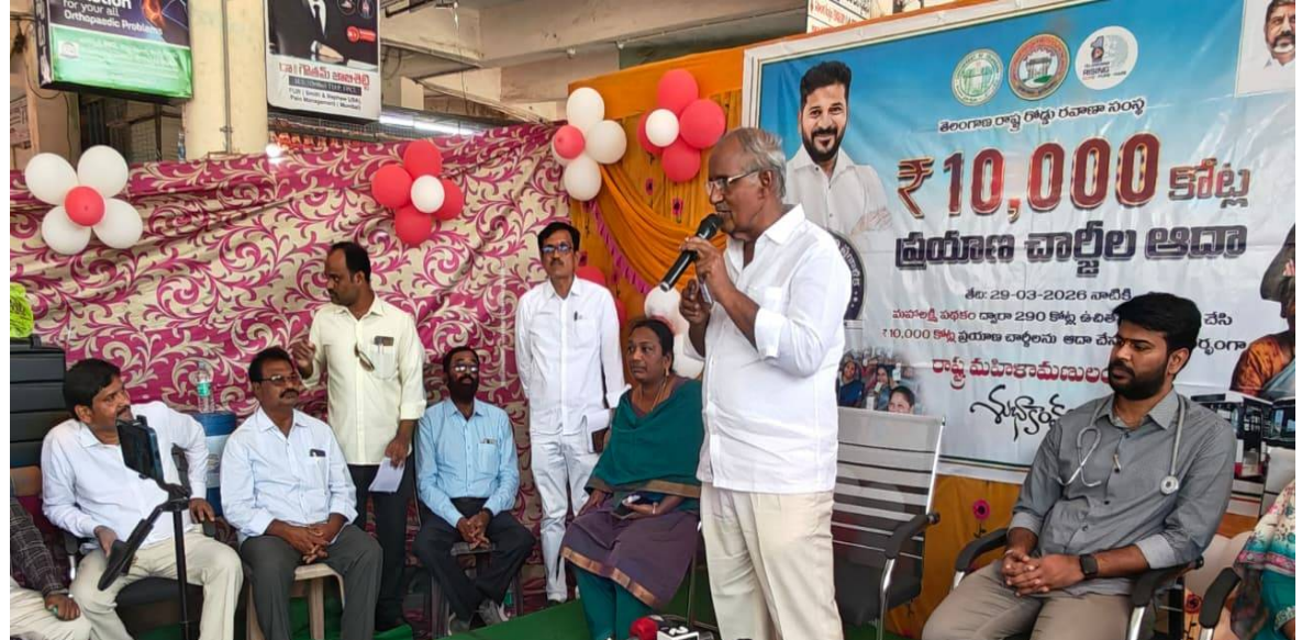
రాష్ట్రవ్యాప్తంగా దాదాపు 290 మహిళలకు రూ. 10,000 కోట్ల మేర ప్రయాణ ఖర్చులు ఆదా అయ్యాయని వెల్లడించారు. ఈ పథకం మహిళల్లో ఆత్మవిశ్వాసాన్ని నింపిందని, ముఖ్యంగా గ్రామీణ ప్రాంత మహిళలకు