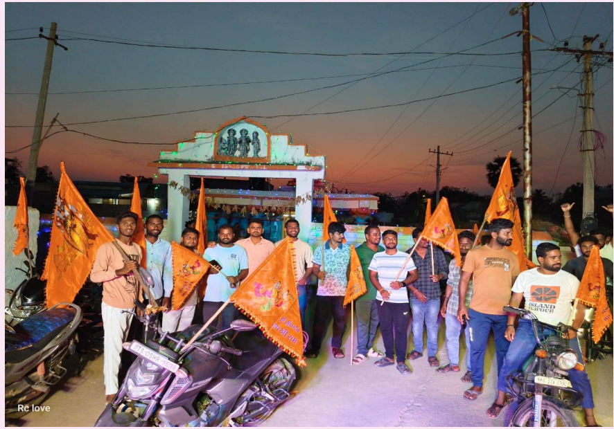
పాలకుర్తి ఏప్రిల్ 02 పెన్ పవర్: జనగామ జిల్లా పాలకుర్తి మండల్ వల్మీడీ గ్రామంలో హనుమాన్ జయంతి వేడుకలు. ఈ వేడుకలలో గ్రామానికి చెందిన యువత మరియు గ్రామపంచాయతీ పెద్దలు పది రోజులు పాల్గొన్నారు.