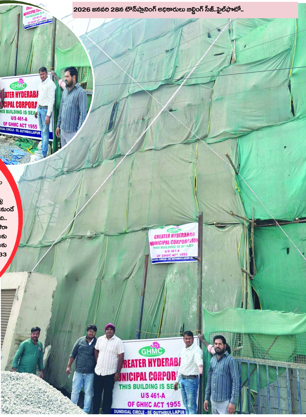
2026 జనవరి 28న టౌన్ ప్లానింగ్ అధికారులు జబ్బింగ్ సీట్.. ఫైల్ ఫోటో..

తెలంగాణ ప్రభుత్వం ప్రతిష్టాత్మకంగా అమలు చేసిన టిజి-బిపాస్ చట్టం, కఠినమైన సెక్షన్లు, నిబంధనలతో రూపొందించిన ఈ చట్టం.. టౌన్ ప్లానింగ్ విభాగం అధికారులు చేతిలో అజాబు పాలవుతోంది.. ప్రారంభంలోనే గుర్తించిన అధికారులు తమ చేతివాలానికి అడ్డుకొని మారదని, హైకోర్టు ఆదేశాలు, 2 నోటీసుల ప్రక్రియతో చట్ట సవరణలు చేశారు.. అప్పటి నుండే టిజి-బిపాస్ చట్టంపై నిర్లక్ష్యం వహించి, క్షీణించే దశకు చేరుకుంది.. కొందరు అవినీతి టౌన్ ప్లానింగ్ అధికారులు చెప్పే సమాధానం ఔరా అనిపిస్తుంది.. ఇందులో క్రమబద్ధీకరణ ఉందట.. అక్రమ నిర్మాణాలకు మొదట సహకరించడం ఆతర్వాత, క్రమబద్ధీకరణ పేరుతో చర్యలకు స్పష్ట పలకడం.. క్రమబద్ధీకరణ ప్రమాదాలను అలకరుతుందా..? 33 శాతం ఫీజు చెల్లిన అక్రమ సెల్లార్, అదనపు అంతస్తులు కుంగిపోతాయా.. హైవే ఎఫెక్ట్లో ఉంటే జబ్బింగ్ పక్క జరుగుతుందా..? అన్న ప్రశ్నలు తలెత్తుతున్నాయి..