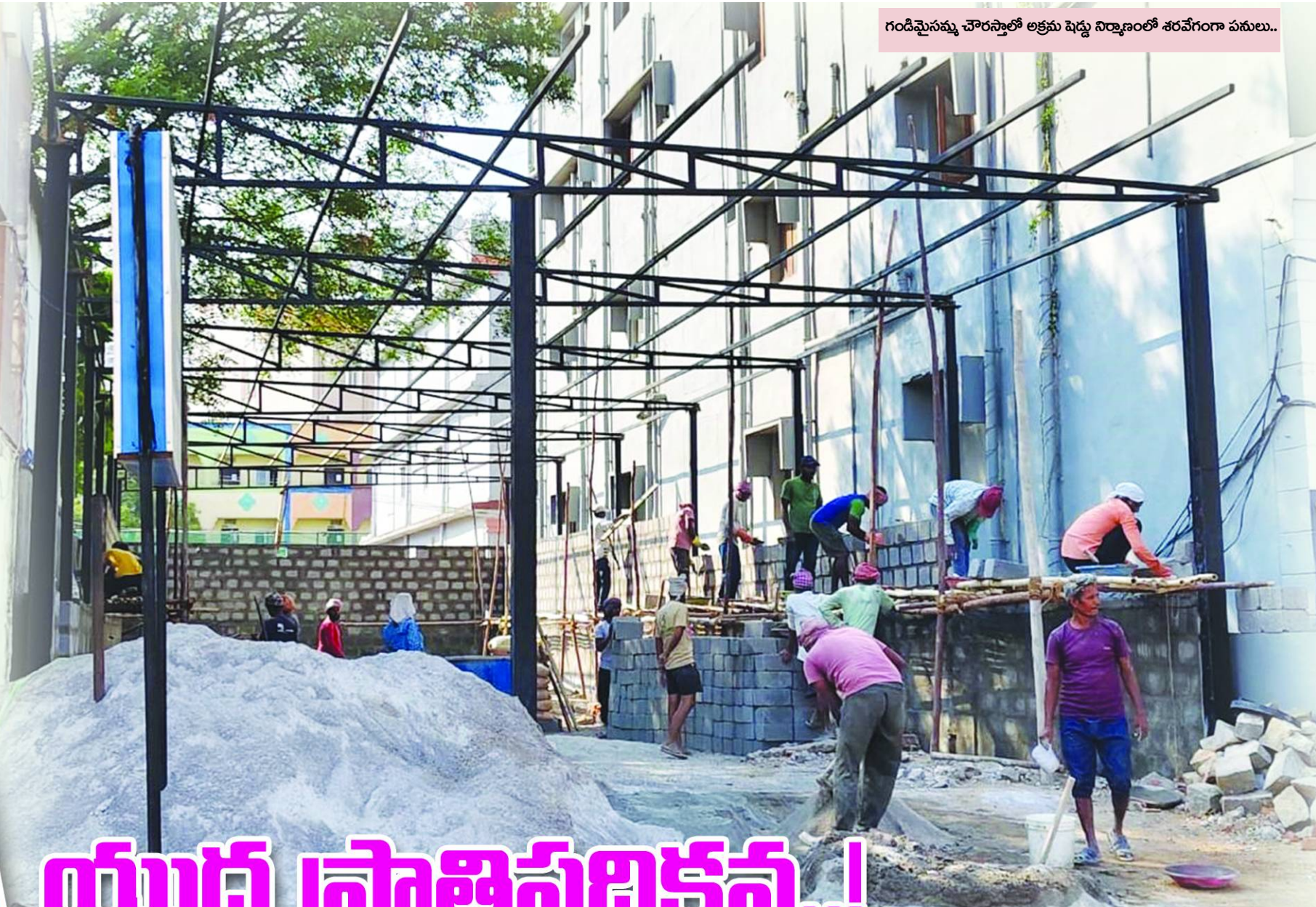
గండిమైసమ్మ చౌరస్తాలో అక్రమ షెడ్డు నిర్మాణంలో శరవేగంగా పనులు..

దుండిగల్, పెన్ పవర్, ఏప్రిల్ 2: దుండిగల్ సర్కిల్-59 సైబరాబాద్ మున్సిపల్ కార్పొరేషన్ పరిధిలో వందలాది అక్రమ నిర్మాణాలపై చర్యలు తీసుకోకుండా, అక్రమ మార్కులకు సహకరిస్తున్న సంబంధిత అధికారులపై విమర్శలు తలెత్తుతుండగా..! వాటిని తలతన్నే విధంగా అక్రమ భారీ షెడ్ నిర్మాణాలు కుప్పలు తెప్పలుగా వెలుస్తున్నాయి.. గండిమైసమ్మ చౌరస్తా సమీపంలో తాజాగా ఓ అక్రమ షెడ్డు నిర్మాణం శరవేగంగా పనులు సాగుతున్నాయి.. ఎలాగైనా రాత్రికి రాత్రే షెడ్డు నిర్మాణం పూర్తిచేయాలనే దృఢ సంకల్పంతో దాదాపు 30 మంది భవన నిర్మాణ కూలీలను పెట్టి, పూర్తి చేయడానికి పనులు జరుగుతున్నాయని స్థానికులు పెన్ పవర్ కు ఫోటోలు పంపించారు.. సంబంధిత నిర్మాణ దారులు అటు పాలిటికల్ గా, ఇటు అధికారుల వద్ద పలుకుబడి ఉన్న ఓ బార్ అండ్ రెస్టారెంట్ నిర్మాణానికి స్థానికులు ఆరోపిస్తున్నారు.. ఈ అక్రమ షెడ్డుకు సర్కిల్లోని ముఖ్య అధికారితో కూడా ఒప్పందం కుదుర్చుకున్నట్లు సమాచారం..