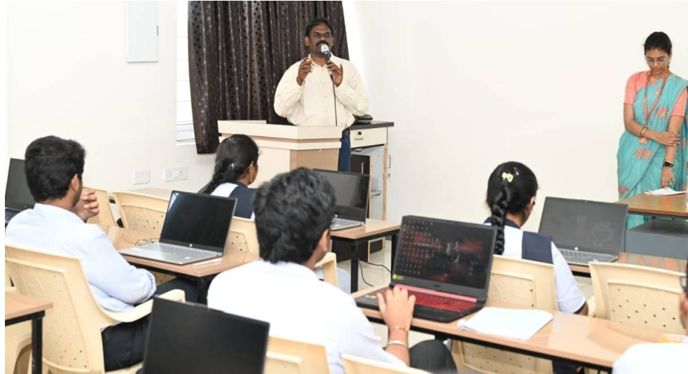
ఆవిష్కరణ తుక్ ఆలోచన అభివృద్ధి చేసుకునే అవకాశం పొందారు. నిర్వాహకులు ఈ కార్యక్రమం విద్యార్థుల భవిష్యత్ సాంకేతిక అభివృద్ధికి దోహదపడుతుందని తెలిపారు.