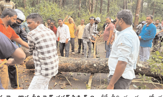
గూడెం కొత్త వీధి, పెన్ పవర్, ఏప్రిల్ 3: జీకే వీధి మండలంలో శు