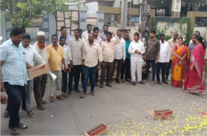
పరిష్కారంపై దృష్టి పెట్టాలని, వెంటనే నిర్మాణ లోపాలను సరిచేస్తూ, తాజాగా అంచనాలు రూపొందించాలని అధికారులకు స్పష్టంగా తెలియజేశామని ప్రతిపాటి తెలిపారు.

చిలకలూరిపేట రూరల్, పెన్ వవర్, ఏప్రిల్ 03: చిలకలూరిపేట : ప్రజా రాజధానిపై పగబట్టిన జగన్ దొంగనాటకాలు, కపట వేషాలకు ప్రధాని మోదీ, ముఖ్యమంత్రి చంద్రబాబులు పూర్తిగా తెరదించారని, అమరావతి నిర్మాణ భద్రత, భవిష్యత్ పై ప్రజల నమ్మకానికి పూర్తి రక్షణ కల్పించారని మాజీమంత్రి, శాసనసభ్యులు ప్రతిపాటి పుల్లారావు తెలిపారు. శుక్రవారం ఆయన స్థానిక క్యాంపు కార్యాలయంలో కూలమినాయకులతో కలిసి ప్రజా సమస్యల పరిష్కార వేదిక (ప్రజా దర్బార్) నిర్వహించి ప్రజల నుంచి వినతులు స్వీకరించారు. అనంతరం అమరావతి చట్టబద్ధత నిర్ణయంపై హార్డు వ్యక్తం చేసిన ప్రతిపాటి, స్థానిక నాయకులు ఏర్పాటుచేసిన కేక్ ను కట్ చేసి, వారికి తినిపించారు. అనంతరం ఆయన విలేజరులతో మాట్లాడుతూ.. పలు ప్రధానాంశాలపై స్పష్టత నిచ్చారు. మావిగన్ తో జగన్ జాతీయస్థాయిలో నవ్వులపాలు లోక్ సభ, రాజ్యసభల్లో అమరావతి చట్టబద్ధతపై జరిగిన చర్చకు అన్నిపార్టీలు ఏకగ్రీవంగా మద్దతిస్తే, జగన్ మాత్రం మత్తిపైతం లేని వాడిలా ప్రవర్తించి, మావిగన్ ప్రతిపాదనతో జాతీయస్థాయిలో నవ్వుల పాలయ్యారని ప్రతిపాటి ఎద్దేవాచేశారు. ప్రపంచం గర్వించేలా చంద్రబాబు నిర్మించిన అమరావతిపై విద్వేషం చిమ్మిన ఏకైక నాయకుడిగా జగన్ చరిత్రలో నిలిచిపోయాడన్నారు. భవిష్యత్ లో జగన్ లాంటి నియంతృత్వ, అవకాశ వాద రాజకీయ నాయకులు అమరావతి కేంద్రంగా ఎలాంటి దుష్ప్రాజాపకాలూ చేయకుండా, కేంద్ర, రాష్ట్ర ప్రభుత్వాలు చరిత్రాత్మకమైన నిర్ణయాన్ని ఆచరణలో పెట్టి, ఆంధ్రుల కలల సాకాశానికి బీజం వేశారున్నారు. దుబల్ ఇంజన్ సర్కార్ చారిత్రాత్మక నిర్ణయం పెట్టుబడిదారులకు గట్టి భరోసా ఇవ్వడంతో పాటు, రైతుల త్యాగాలకు సార్థకత చేకూర్చిందని ప్రతిపాటి అభిప్రాయపడ్డారు. రాజధాని ప్రాంతవాసులతో పాటు, ప్రజలు ఇకపై అమరావతిపై ఎలాంటి భయాందోళనలు లేకుండా నిశ్చలంగా ఉంటారన్నారు.