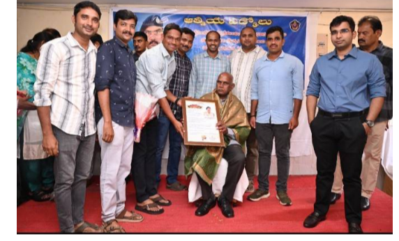
అనకాపల్లి జిల్లా పోలీసు శాఖలో ఘన వీడ్కోలు కార్యక్రమం