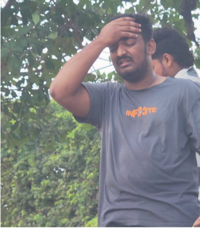
స్నానికంగా తీవ్ర విషాదాన్ని మిగిల్చింది. పూర్తి వివరాలు తెలియవలసి ఉంది.

అత్రేయపురం పెన్ పవర్ ఏప్రిల్ 4: అత్రేయపురం మండలం బొబ్బిలంక గ్రామం శివారు పిచ్చు క లంక వద్ద విషాదకర ఘటన చోటుచేసుకుంది. గోదావరి నదిలో స్నానానికి దిగిన రాజమండ్రి జామిపేట కు చెందిన నలుగురు యువకులు ప్రమాదానికి గురయ్యారు. నలుగురిలో ముగ్గురు యువకులు నదిలో మునిగిపోగా, వారిలో ఒకరు ప్రాణాలతో బయటపడి ఒడ్డుకు చేరుకున్నారు. మిగిలిన వారు నది ప్రవాహంలో చిక్కుకోవడంతో స్నానికుల్లో ఆందోళన నెలకొంది. సమాచారం అందుకున్న వెంటనే పోలీసులు, రెస్ట్రా సిబ్బంది సంఘటనా స్థలానికి చేరుకుని గాలింపు చర్యలు ప్రారంభించారు. ఈ క్రమంలో ఒక యువకుడి మృతదేహం లభ్యమైంది. ఇంకా ఇద్దరి కోసం గాలింపు చర్యలు కొనసాగుతున్నాయి. ఈ ఘటన