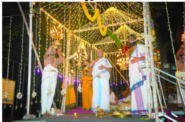
గిద్దలూరు పెన్ పవర్ ఏప్రిల్ 4