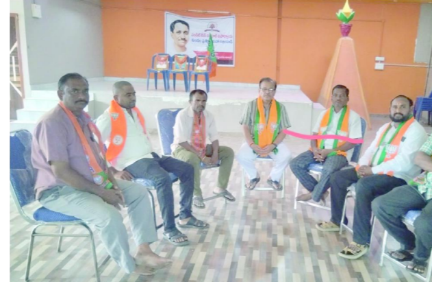
గిద్దలూరు పెన్ పవర్ ఏప్రిల్ 4