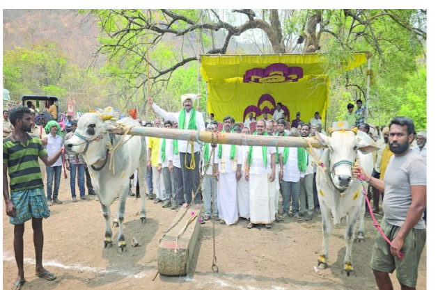
గిద్దలూరు పెన్ పవర్ ఏప్రిల్ 4