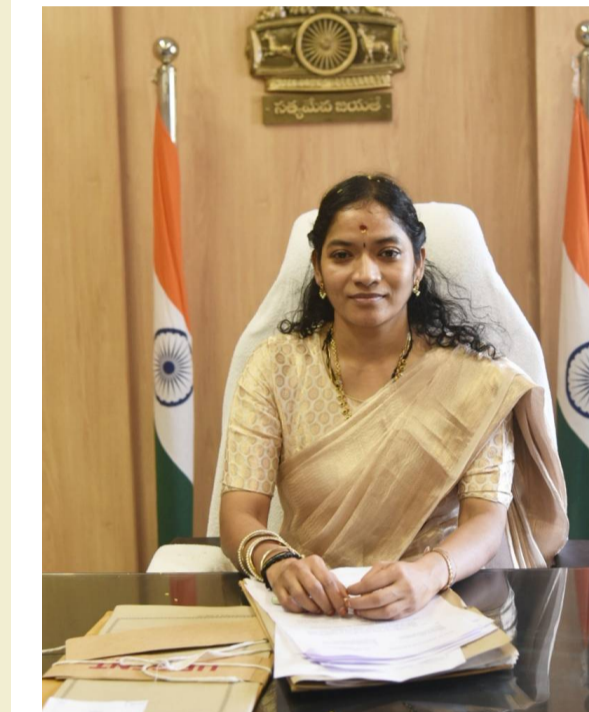
జిల్లా ప్రాథమిక భాగస్వామిని అల్లూరి జిల్లాను ముందుకు నడిపిస్తా