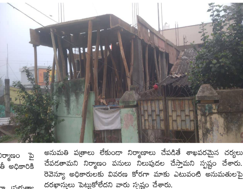
అనుమతి పత్రాలు లేకుండా నిర్మాణాలు చేపడితే శాఖపరమైన చర్యలు చేపడతామని నిర్మాణం పనులు నిలుపుదల చేస్తామని స్పష్టం చేశారు. రెవెన్యూ అధికారులకు వివరణ కోరగా మాకు ఎటువంటి అనుమతులపై దరఖాస్తులు పెట్టుకోలేదని వారు స్పష్టం చేశారు.

కోరగా పంచాయతీ అధికారులకు రెవెన్యూ అధికారులకు పత్రికా పెద్దలకు సెటిల్మెంట్ బేరా సారాలు చేసుకున్నారని నాకు ఎవరు అడ్డు చెప్పింది లేదని అహంకార ప్రవర్తనతో పాత్రికేయులకు సమాధానం ఇస్తున్నట్లు విశ్వాసనీయం సమాచారం. అక్రమ నిర్మాణ యాజమాన్యంతో బేరా సారాలు రహస్య ఒప్పందాలతో నాకు పెద్దలు అక్రమ నిర్మాణం నిర్మించి పెడుతున్నారని నిర్మాణం దారుడు చెప్పేస్తున్నట్లు ఆరోపణలు వినిపిస్తున్నాయి. ప్రభుత్వం అనుమతి లేని అక్రమ నిర్మాణానికి నోటీసులు అందించి తక్షణమే నిర్మాణం పనులు నిలుపుదల చేయాలని, లేకుంటే స్థానిక పంచాయతీ రెవెన్యూ అధికారులపై జిల్లా కలెక్టర్ కు ఫిర్యాదు చేస్తామని, గిరిజననేతరుల అక్రమ బినామీ నిర్మాణాలకు మద్దతు పలుకుతున్న పత్రిక పెద్దల నలగతేంకో తెలుస్తామని స్థానిక గిరిజనులు కొందరు గుసగుసలాడుతున్నారు. అక్రమ నిర్మాణం పై శాఖపరమైన చర్యలు చేపట్టాలని లేనియెడల జిల్లా పంచాయతీ అధికారికి ఫిర్యాదు చేస్తామని స్థానికులు హెచ్చరిస్తున్నారు. వివరణ. పెద్దలబుడు గ్రామపంచాయతీ అధికారులకు వివరణ కోరగా ప్రభుత్వ