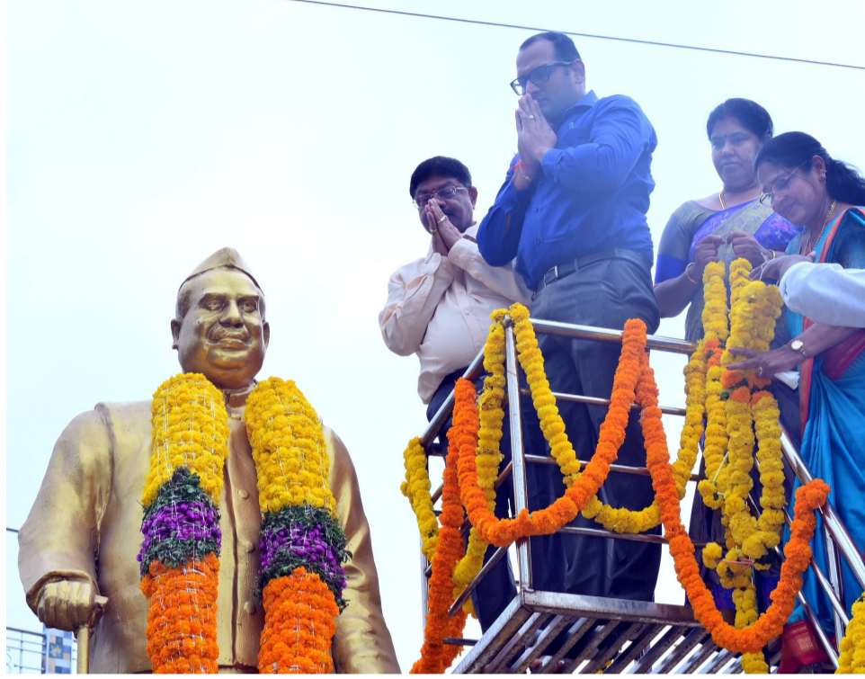
కాకినాడ, పెన్ పవర్, ఏప్రిల్ 5: సమసమాజ సాధన, నవ భారత నిర్మాణం కోసం కృషి చేసిన మహనీయుడు బాబు జగ్జీవన్ రామ్ జీవితం, ఆశయాలు