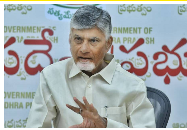
భాగస్వామ్యం అత్యంత కీలకమని ముఖ్యమంత్రి చంద్రబాబు స్పష్టం చేశారు. ఈ బృహత్తర కార్యక్రమంలో రాష్ట్రంలోని 60 వేల మంది సాగునీటి సంఘాల సభ్యులను భాగస్వాములను చేస్తూ వారికి కీలక బాధ్యతలు అప్పగించారు. "ప్రతి నీటి చుక్కను ఒడిసి పట్టుకోవాలి, ప్రతి టోట్టును

పెన్ పవర్ డెస్క్ రాష్ట్రంలో నీటి సంరక్షణ, భూగర్భ జలాల పెంపు లక్ష్యంగా ఆంధ్రప్రదేశ్ ప్రభుత్వం భారీ కార్యక్రమానికి శ్రీకారం చుట్టింది. 'నీటి భద్రత-సాగునీటి సంఘాల బాధ్యత' పేరుతో 100 రోజుల ప్రత్యేక కార్యాచరణను ముఖ్యమంత్రి చంద్రబాబు ప్రకటించారు. ప్రజల భాగస్వామ్యంతో జల సంరక్షణను ఒక ఉద్యమంలా ముందుకు తీసుకెళ్లాలని ఆయన పిలుపునిచ్చారు. ఏప్రిల్ 6 నుంచి జులై 14వ తేదీ వరకు ఈ కార్యక్రమం కొనసాగుతుంది. ఇందులో భాగంగా నేడు రాష్ట్రంలోని సాగునీటి సంఘాల సభ్యులతో ముఖ్యమంత్రి టెలికాన్ఫరెన్స్ నిర్వహించి, రాబోయే 100 రోజుల ప్రణాళికపై వారికి దిశానిర్దేశం చేశారు. ఈ కార్యక్రమం ప్రారంభ సూచికగా, సీఎం చంద్రబాబు రేవు (ఏప్రిల్ 6) తాడిపత్రి నియోజకవర్గంలోని యాడికిలో జరిగే కార్యక్రమంలో పాల్గొననున్నారు. 100 రోజుల కార్యాచరణ.. సాగునీటి సంఘాలకు కీలక బాధ్యతలు నీటి భద్రత కేవలం ప్రభుత్వ బాధ్యతే కాదని, ఇందులో ప్రజల