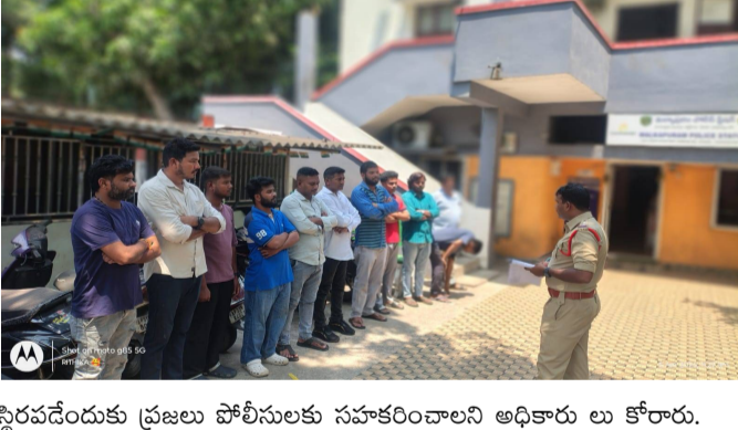
స్థిరపడేందుకు ప్రజలు పోలీసులకు సహకరించాలని అధికారులు కోరారు.