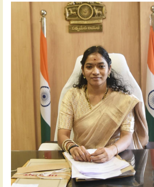
జిల్లా ప్రాంతిక భాగస్వామి అల్లూరి జిల్లాను ముందుకు నడిపిస్తా