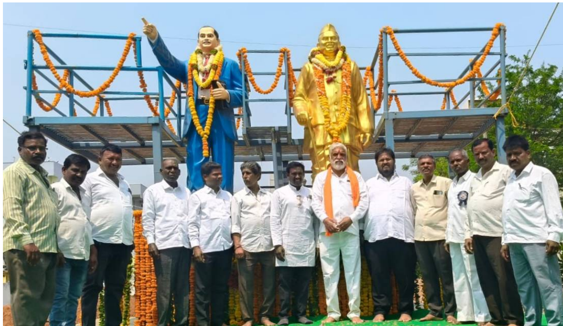
సూరారం కాలనీలోని డాక్టర్ బిఆర్ అంబేద్కర్, డాక్టర్ బాబు జగ్జీవన్ రామ్ లకు నివాళులు..