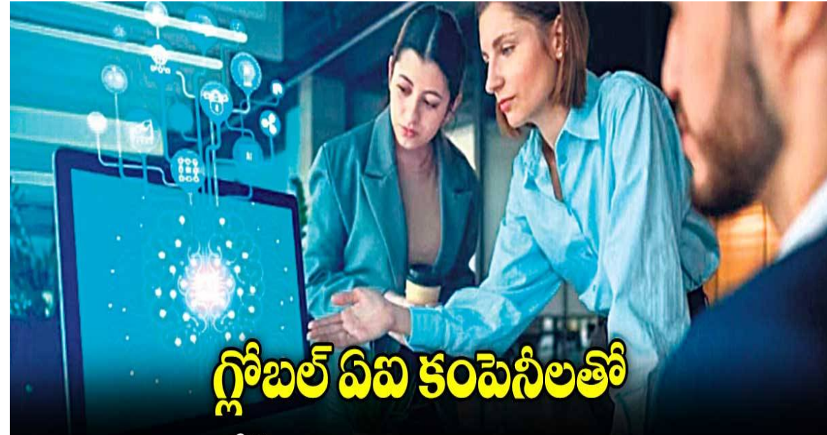
గ్లోబల్ ఏఐ కంపెనీలతో

ఇండియన్ ఐటీ కంపెనీలు టీసీఎస్, విప్రో, ఇన్ఫోసిస్ జనరేటివ్ ఏఐ రంగంలో కూడా విస్తరించాలని షోకన్ చేస్తున్నాయి. ఇందుకోసం గ్లోబల్ ఏఐ కంపెనీలు ఓపెన్ ఏఐ, మైక్రోసాఫ్ట్, ఆంథ్రోపిక్తో భాగస్వామ్యం కుదుర్చుకున్నాయి. న్యూఢిల్లీ: ఇప్పటికే సాఫ్ట్వేర్ సర్వీసులో లీడర్లుగా కొనసాగుతున్న ఇండియన్ ఐటీ కంపెనీలు టీసీఎస్, విప్రో, ఇన్ఫోసిస్.. జనరేటివ్ ఏఐ రంగంలో కూడా విస్తరించాలని షోకన్ చేస్తున్నాయి. ఇందుకోసం గ్లోబల్ ఏఐ కంపెనీలు ఓపెన్ఏఐ, మైక్రోసాఫ్ట్, ఆంథ్రోపిక్తో ఒప్పందాలు కుదుర్చుకున్నాయి. వీటి బెకాంపానీ భారత క్లయింట్ల అవసరాలకు అనుగుణంగా కస్టమైజ్ చేయాలని చూస్తున్నాయి. టీసీఎస్ : ఓపెన్ఏఐతో టై ఆఫ్ అయ్యింది. ఏఐ -రీడి ఇన్ఫ్రాస్ట్రక్చర్, ఎంటర్ప్రైజ్ సాల్యూషన్లను అభివృద్ధి చేస్తోంది. ఓపెన్ఏఐకి చెందిన చాట్? జీపీటీ మోడల్స్ను బ్యాంకింగ్, హెల్త్కేర్, రిటైల్, మాన్యుఫ్యాక్చరింగ్ సెక్టార్లలోని తమ క్లయింట్లకు అనుగుణంగా కస్టమైజ్ చేసి, సాల్యూషన్లు అందిస్తోంది. టీసీఎస్ క్లయింట్ల జేన్ పెద్దది. ఓపెన్ఏఐకి జనరేటివ్ ఏఐలో అనుభవం ఉంది. ఈ రెండు కంపెనీలు కలిసి అడ్వాన్స్?డ్? ఏఐ సాల్యూషన్లను దెవలప్ చేయడంపై షోకన్ పెట్టాయి. గ్లోబల్ ఏఐ సర్వీసు లీడర్గా ఎదగడంలో టీసీఎస్కు ఈ భాగస్వామ్యం సాయపడుతుందని అంచనా. విప్రో: మైక్రోసాఫ్ట్తో మూడేళ్ల ఒప్పందం కుదుర్చుకుంది. దీని కింద 50 వేల కోట్లలో లైసెన్సులను కొనుగోలు చేయనుంది. కంపెనీ ఉద్యోగులు తమ రోజువారీ పనుల్లో మైక్రోసాఫ్ట్ కోట్లలోనూ వాడుకోవడానికి వీలుంటుంది. వర్డ్, ఎక్సెల్, పవర్ పాయింట్,