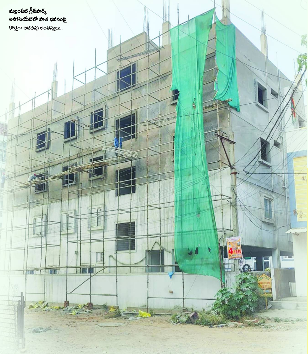
కుబ్లంపేట్ గ్రీన్ పార్క్ అసోసియేట్స్ లో పాత భవనంపై కొత్తగా అదనపు అంతస్తులు..