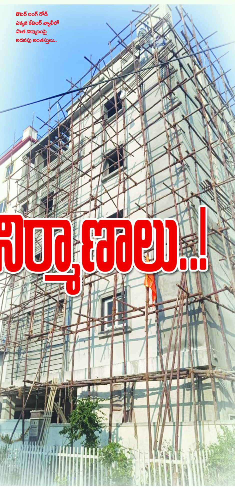
బెటర్ లింగ్ రోడ్ పక్కన కేవల వ్యాఠిలో పాత నిర్మాణంపై అదనపు అంతస్తులు..