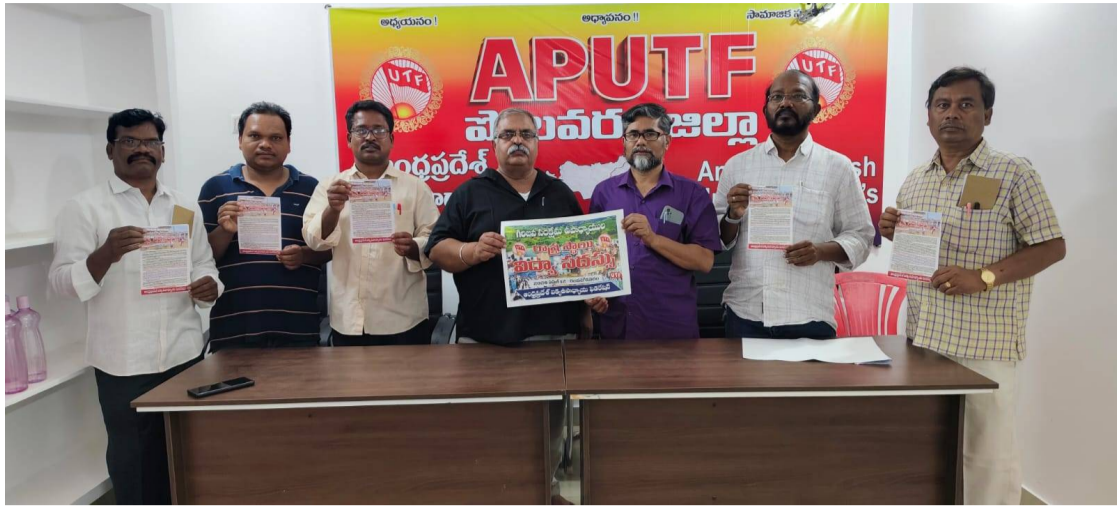
గంగవరం/ రంపచోడవరం, పెన్ పవర్, ఏప్రిల్ 6: గిరిజన చేయాలనే లక్ష్యంతో సోమవారం రంపచోడవరంలో పోస్టర్ సంక్షేమ ఉపాధ్యాయుల రాష్ట్ర విద్య సదస్సును విజయవంతం ఆవిష్కరణ కార్యక్రమం ఘనంగా నిర్వహించారు. ఈ