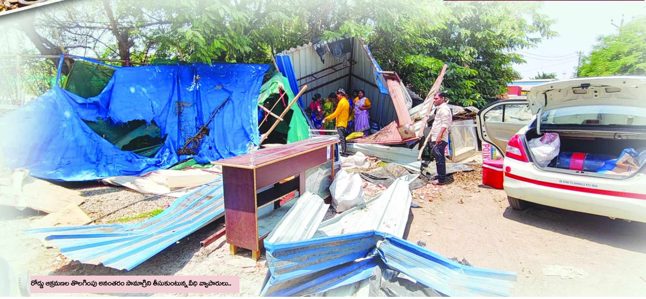
రోడ్డు ఆక్రమణల తొలగింపు అనంతరం సామాగ్రిని తీసుకుంటున్న వీధి వ్యాపారులు..

స్వచ్ఛందంగా తొలగింపుకు విజ్ఞప్తి.. దుండిగల్ సర్కిల్ అధికారులు, పోలీసులు వీధి వ్యాపారులకి విజ్ఞప్తి చేశారు.. ఎవరికి వారే స్వచ్ఛందంగా రోడ్డు- పుట్పాతల ఆక్రమణలను తొలగించుకుంటే సామాగ్రి నష్టం వాటిల్లకుండా ఉంటుందని, అధికారులు జేసిబిఐతో కూల్చివేతలు చేపడితే కష్టపడి సంపాదించిన వలురకాల వస్తువులు ధ్వంసం అవుతాయని అధికారులు తెలిపారు.. ఆక్రమణదారులకు ముందుగానే నోటీసులు జారీ చేసి స్వచ్ఛందంగా తొలగించుకోవాలని సూచించారు. అయినప్పటికీ స్పందన లేకపోవడంతో, నిబంధనల ప్రకారం యంత్రాంగం రంగంలోకి దిగి కూల్చివేతలు చేపట్టింది. ఈ చర్యల్లో ఎలాంటి అవాంఛనీయ ఘటనలు జరగకుండా పోలీసులు బందోబస్తు కల్పించారు..