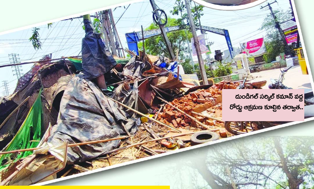
దుండిగల్ సర్కిల్ కమాన్ వద్ద రోడ్డు ఆక్రమణ కూల్చిన తర్వాత..

పాదచారులకు ఇబ్బందులు.. ట్రాఫిక్ పై ప్రభావం.. గత కొంతకాలంగా ఈ మార్గంలో పుట్పాతలు పూర్తిగా ఆక్రమించటంతో పాదచారులు రోడ్డుపై నడవాలిని పరిస్థితి నెలకొంది. దీనివల్ల ట్రాఫిక్ రద్దీ పెరగడమే కాకుండా, ప్రమాదాలకు నిలయంగా మారిన స్థానాలు పలుమార్లు ఫిర్యాదు చేశారు. ముఖ్యంగా గండిమైసమ్మ చౌరస్తా పరిసరాల్లో అనధికార దుకాణాలు పెరగడం వల్ల పరిస్థితి మరింత క్లిష్టంగా మారింది.. దీంతో ముందస్తుగా నోటీసులు జారీచేసినా, వీధి వ్యాపారులు నిర్లక్ష్యం వహించారని, సువిశాలమైన రోడ్లతో నగర విస్తరణలో భాగంగా సోమవారం ఈ పుట్పాతల ఆక్రమణలు కూల్చివేతలు ప్రారంభించారు..