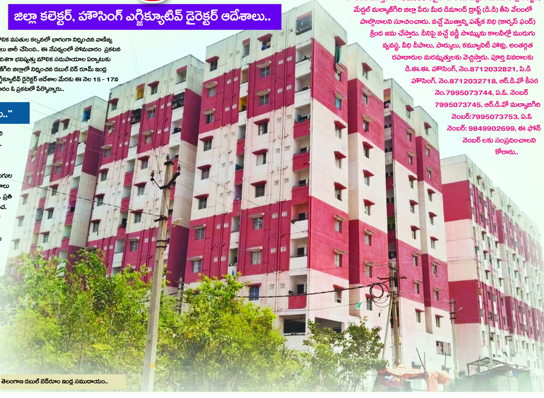
తెలంగాణ డబుల్ బెడ్రూం ఇండ్ల సముదాయం..

జిల్లాలోని చైతన్య నగర్ లో 14 దుకాణాలు వాటి విస్తీర్ణం 116.38 చ. అడుగుల సుంచి 185.25 చ. అడుగుల వరకు ఉంటుంది. ప్రతి అడుగు రూ.2700 ధర నిర్ణయించారు.