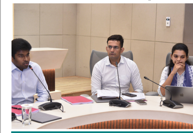
అధికారులకు కలెక్టర్ స్పష్టమైన మార్గదర్శకాలు