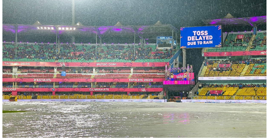
అందరూ భావిస్తున్నారు. అయితే, ప్రస్తుతానికి వర్షం ఈ ఆసక్తికరమైన పోరుకు అడ్డం నిలిచింది.

గౌహతి వేదికగా రాజస్థాన్ రాయల్స్, ముంబై ఇండియన్స్ మధ్య జరగాల్సిన ఐపీఎల్ మ్యాచ్ కు వర్షం అడ్డంకిగా మారింది. మంగళవారం మధ్యాహ్నం నుంచి సగరంలో సుమారు మూడు గంటల పాటు భారీ వర్షం కురవడంతో, బర్సపరాలోని అస్సాం క్రికెట్ అసోసియేషన్ స్టేడియాన్ని సిబ్బంది కవర్ తో పూర్తిగా కప్పి ఉంచారు. షెడ్యూల్ ప్రకారం రాత్రి 7:30 గంటలకు మ్యాచ్ ప్రారంభం కావాల్సి ఉండగా, వర్షం కారణంగా టాస్ కూడా వేయలేదు. వర్షం తగ్గుముఖం పట్టడంతో గ్రౌండ్ సిబ్బంది మైదానాన్ని సిద్ధం చేసే పనిలో నిమగ్నమయ్యారు. సూపర్ సాఫ్ట్ సహాయంతో టోస్ లోలోని సీటిని తొలగిస్తున్నారు. త్వరలోనే అంబ్రెల్ల మైదానాన్ని పరిశీలించి టాస్ పై నిర్ణయం తీసుకోనున్నారు. రాత్రి 8:30 గంటల లోపు అట మొదలైతే ఓవర్ల కోత ఉండదని నిర్వాహకులు తెలిపారు. ఈ సీజన్ లో గౌహతిలో రాజస్థాన్ కు ఇది రెండో 'హోమ్' మ్యాచ్. ఇప్పటివరకు ఆడిన రెండు మ్యాచ్ లోనూ గెలిచి మంచి ఉభయ మీదుంది. మరోవైపు, ముంబై ఇండియన్స్ ఒక మ్యాచ్ గెలిచి, మరొకటి ఓడిపోయింది. ఈ మ్యాచ్ లో గెలిచి విజయాల బాట పట్టాలని చూస్తోంది. ఈ మ్యాచ్ లో భారత స్టార్ పేసర్ జస్పీత్ బుధూ, రాజస్థాన్ యువ సంచలనం 15 ఏళ్ల వైభవ్ సూర్యవంశీ మధ్య పోరుపై అభిమానులు ఆసక్తిగా ఎదురుచూస్తున్నారు. ఐపీఎల్ లో ఇప్పటికే ఒక సంచరి, 30 సిక్సర్లు బాదిన ఈ బీహార్ కుర్రాడు.. బుధూ బౌలింగ్ ను ఎలా ఎదుర్కొంటాడో చూడాలని