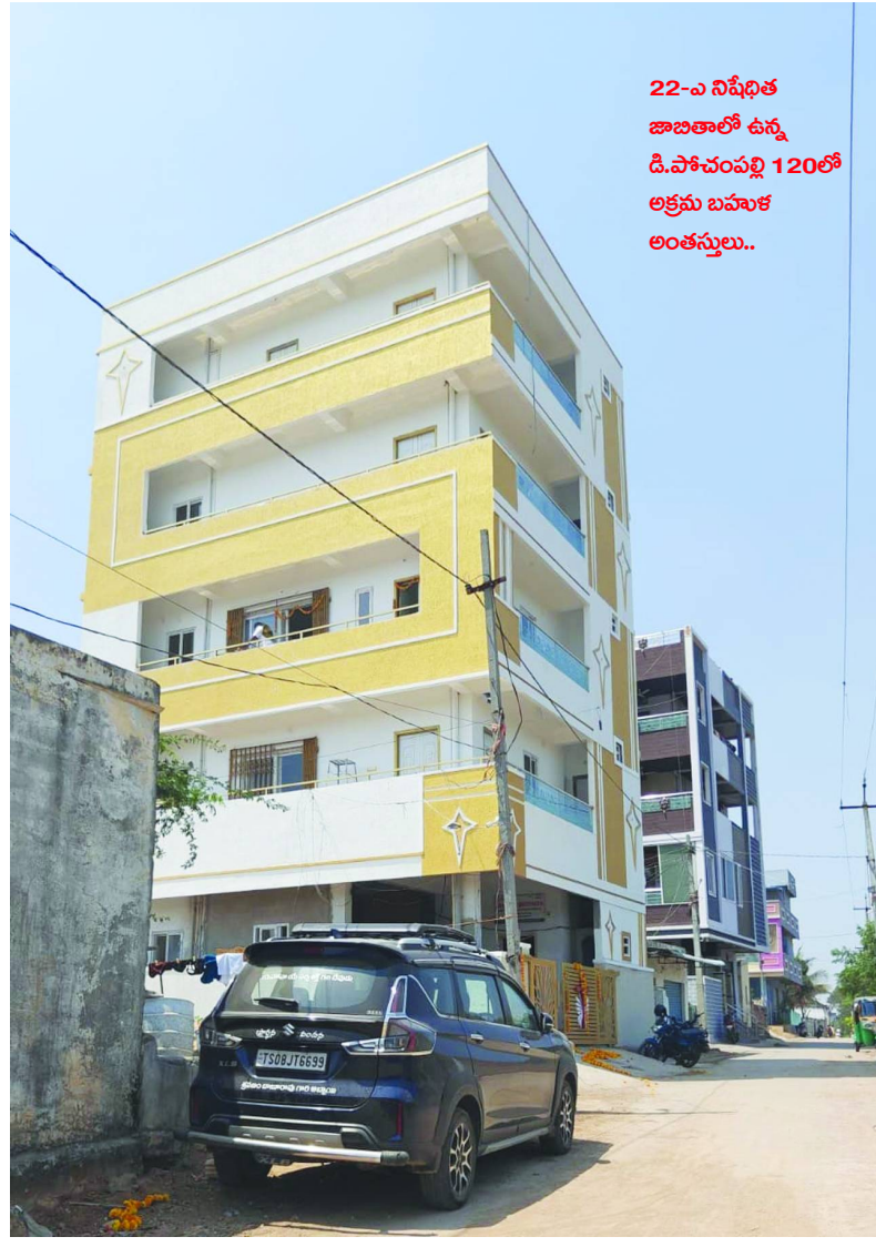
22-ఎ నిషేధిత జాబితాలో ఉన్న డి.పోచంపల్లి 120లో అక్రమ బహుళ అంతస్తులు..

ఇలాంటి భూముల్లో వెలుస్తున్న "అక్రమ భారీ షెడ్డు- బహుళ అంతస్తుల నిర్మాణాలపై" చర్యలు ఎవరు తీసుకోవాలి..? రెవెన్యూ-మున్సిపల్ ఎవరి బాధ్యత వారు సక్రమంగా నిర్వర్తిస్తున్నారా..? అంటే అదేమి లేదనేది స్పష్టంగా కనిపిస్తుంది.. ఒకవేళ ఈ రెండు శాఖల సమన్వయంతో చేపట్టాల్సిన ఎవరి విధులు వారు నిర్వర్తిస్తే..! "నిషేధిత భూముల్లో" ఈ ప్రమాదకర అక్రమ నిర్మాణాలు జరిగేవా..? వీటికి ఎవరు బాధ్యత వహిస్తారు..? అక్రమ నిర్మాణాల బాధ్యత మున్సిపల్ అధికారులదని రెవెన్యూ భావిస్తుండగా..! నిషేధిత భూముల్లోని అక్రమ కట్టడాలు తమకు ఎందుకు అనే ధోరణితో టౌన్ ప్లానింగ్ అధికారులు భావిస్తున్నట్లు ఆరోపణలు వస్తున్నాయి..