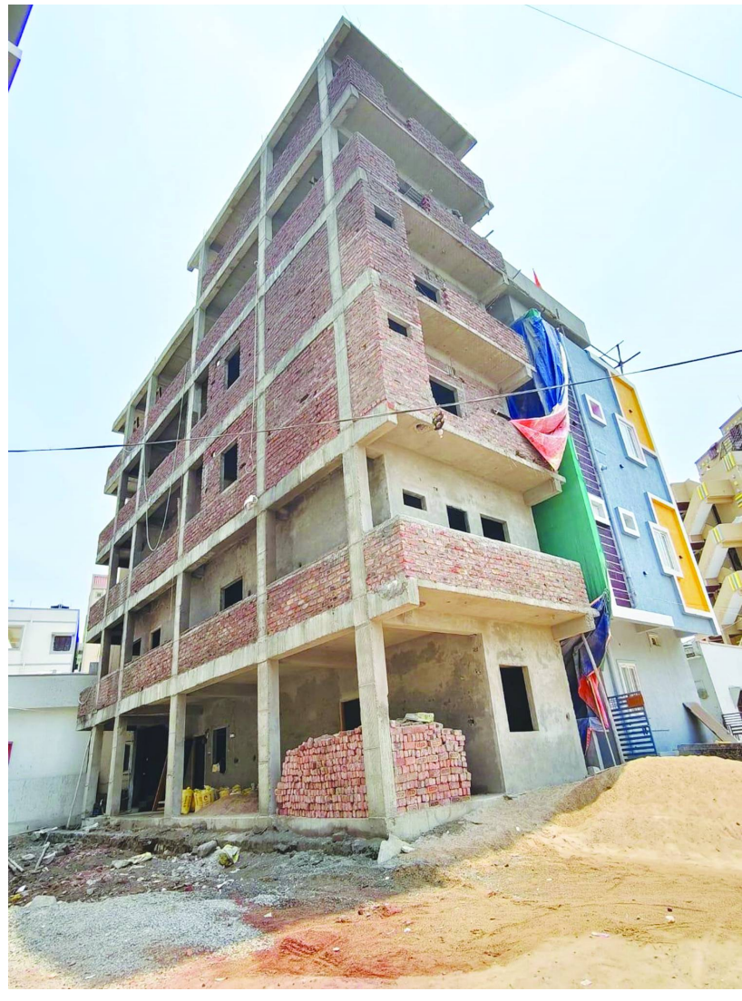
సర్వే నెం.168 22-ఎ నిషేధిత జాబితాలో ఉన్న భూమిలో 2+5 అక్రమ బహుళ అంతస్తులు..