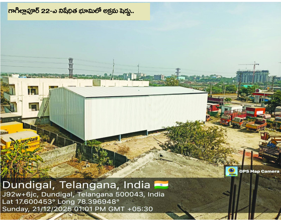
గాగిల్లాపూర్ 22-ఎ నిషేధిత భూమిలో అక్రమ షెడ్డు..