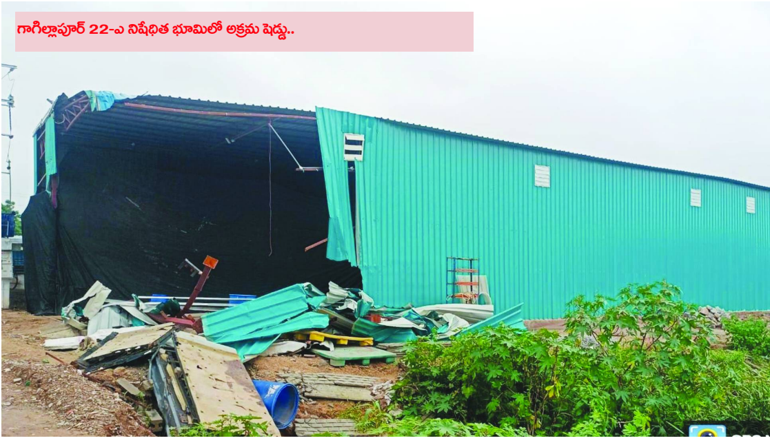
గాగిల్లాపూర్ 22-ఎ నిషేధిత భూమిలో అక్రమ షెడ్డు..