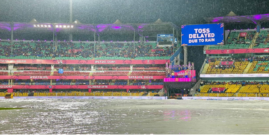
కుర్రాడు.. బుర్రా బొలింగ్ ను ఎలా ఎదుర్కొంటాడో చూడాలని అందరూ భావిస్తున్నారు. అయితే, ప్రస్తుతానికి వర్షం ఈ ఆసక్తికరమైన పోరుకు అడ్డూగా నిలిచింది.

గౌహతి వేదికగా రాజస్థాన్ రాయల్స్, ముంబై ఇండియన్స్ మధ్య జరగాల్సిన ఐపీఎల్ మ్యాచ్ వర్షం ఆధిక్యంగా మారింది. మంగళవారం మధ్యాహ్నం నుంచి సగంరోజు సుమారు మూడు గంటల పాటు భారీ వర్షం కురవడంతో, బర్మింగ్ హామ్ లోని అస్సాం క్రికెట్ అసోసియేషన్ స్టేడియాన్ని నిబ్బంది కవర్ తో పూర్తిగా కప్పి ఉంచారు. షెడ్యూల్ ప్రకారం రాత్రి 7:30 గంటలకు మ్యాచ్ ప్రారంభం కావాల్సి ఉండగా, వర్షం కారణంగా టాస్ కూడా వేయలేదు. వర్షం తగ్గుముఖం పట్టడంతో గ్రౌండ్ సిబ్బంది మైదానాన్ని సిద్ధం చేసే పనిలో నిమగ్నమయ్యారు. సూపర్ సాఫర్ సహాయంతో జెట్ ఫైర్ లోని నీటిని తొలగిస్తున్నారు. త్వరలోనే అంపైర్లు మైదానాన్ని పరిశీలించి టాస్ నిర్ణయం తీసుకోనున్నారు. రాత్రి 8:30 గంటల లోపు ఆట మొదలైతే ఓవర్ కోత ఉండదని నిర్వాహకులు తెలిపారు. ఈ సీజన్ లో గౌహతిలో రాజస్థాన్ కు ఇది రెండో 'హామ్' మ్యాచ్. ఇప్పటివరకు ఆడిన రెండు మ్యాచ్ లోనూ గెలిచి మంచి ఊపు మీదుంది. మరోవైపు, ముంబై ఇండియన్స్ ఒక మ్యాచ్ గెలిచి, మరొకటి ఓడిపోయింది. ఈ మ్యాచ్ లో గెలిచి తిరిగి విజయాల బాట పట్టాలని చూస్తోంది. ఈ మ్యాచ్ లో భారత స్టార్ పేసర్ జస్ప్రీత్ బుర్రా, రాజస్థాన్ యువ సంచలనం 15 ఏళ్ల వైభవ్ సూర్యవంశీ మధ్య పోరుపై అభిమానులు ఆసక్తిగా ఎదురుచూస్తున్నారు. ఐపీఎల్ లో ఇప్పటికే ఒక సెంచరీ, 30 సిక్సర్లు బాదిన ఈ బీహార్