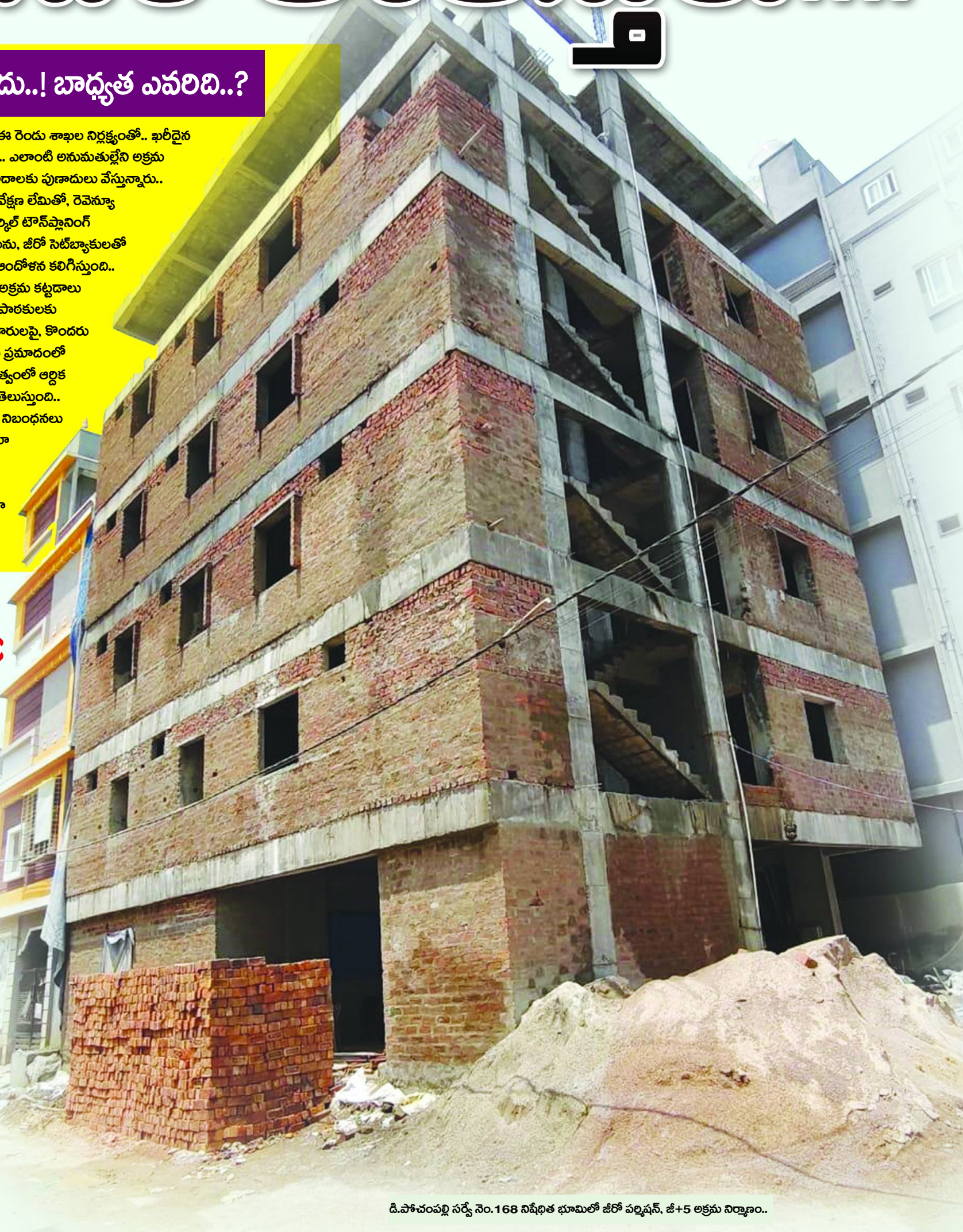
డి.పోచంపల్లి సర్వే నెం.168 నిషేధిత భూమిలో జీరో పల్లెషన్, జీ+5 అక్రమ నిర్మాణం..