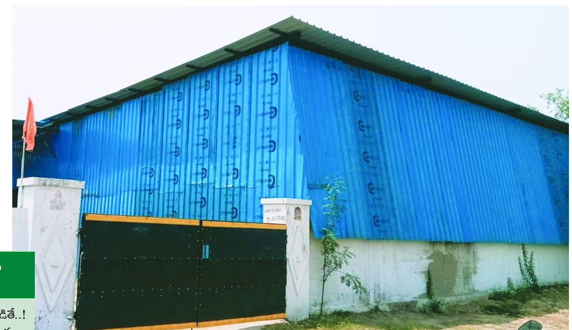
బహుదూర్పల్లి సర్వే నెం.227 ప్రభుత్వ నిషేధిత జాబితా 22-ఎ లో అక్రమ షెడ్డు..