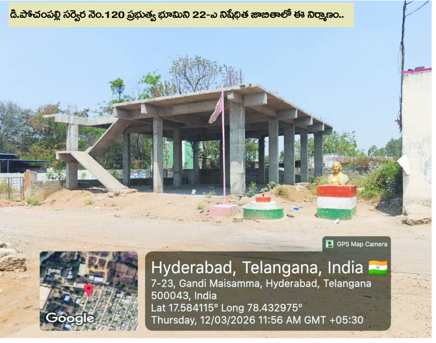
డి.పోచంపల్లి సర్వే నెం.120 ప్రభుత్వ భూమిని 22-ఎ నిషేధిత జాబితాలో ఈ నిర్మాణం..