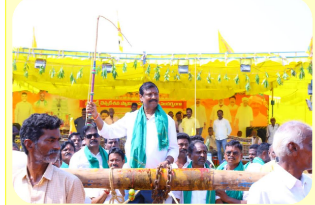
మార్కాపురం పెన్ పవర్ ఏప్రిల్ 8