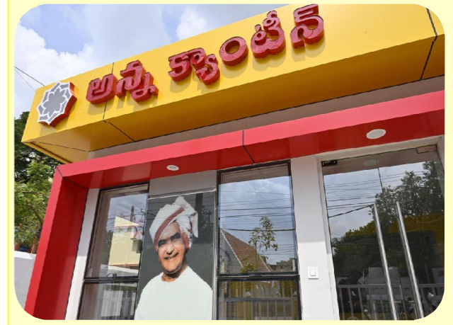
పొదిలి, పెన్ పవర్, ఏప్రిల్ 8

పొదిలిలో అన్నా క్యాంపీన్ ఏర్పాటు చేయాలని ప్రజలు కోరుతున్నారు. అతి తక్కువ ధరకే పేదల కడుపు నింపేందుకు రాష్ట్ర ప్రభుత్వం ఎంతో ప్రతిష్టాత్మకంగా ప్రవేశపెట్టిన అన్నా క్యాంపీన్ ఏర్పాటు పొదిలిలో ఇప్పటివరకు జరగకపోవడాన్ని పలువురు అసహనం వ్యక్తం చేస్తున్నారు. ప్రకాశం జిల్లా తో పాటు నూతనంగా ఏర్పడిన మార్కెట్లలో జిల్లా సెంటర్లో పొదిలి పట్టణం ఉంది. మండల కేంద్రమైన పొదిలికి చుట్టూపక్కల ప్రాంతాల నుండి వివిధ పనుల కోసం పేద ప్రజలు, విద్యార్థులు కూలీలు తదితరులు వస్తుంటారు. అన్నా క్యాంపీన్ ఏర్పాటు పల్లె ఆయా వర్గాలకు అతి తక్కువ ధరకే భోజనం దొరికే అవకాశం ఉంటుందని పలువురు అంటున్నారు. ఇంతటి ప్రాముఖ్యత కలిగిన అన్నా క్యాంపీన్ ఏర్పాటులో అధికారులు ఎందుకు నిర్లక్ష్యం వైఖరి అవలంబిస్తున్నారో అర్థం కావడం లేదని పలువురు ఆక్షేపిస్తున్నారు. పొదిలి పట్టణంలో అన్నా క్యాంపీన్ ఏర్పాటు కోసం స్థల సేకరణ జరిగి, కొంత నిర్మాణం కూడా జరిగినప్పటికీ, అర్థం తంగా ఆయా పనులు ఎందుకు నిలిపి వేశారో అర్థం కావడం లేదని పలువురు విమర్శిస్తున్నారు. ఇప్పటికైనా ప్రజాప్రతినిధులు, అధికారులు దృష్టి సారించి, పొదిలిలో అన్నా క్యాంపీన్ ఏర్పాటు చేసేందుకు అవసరమైన చర్యలు తీసుకోవాల్సిందిగా పలువురు కోరుతున్నారు.