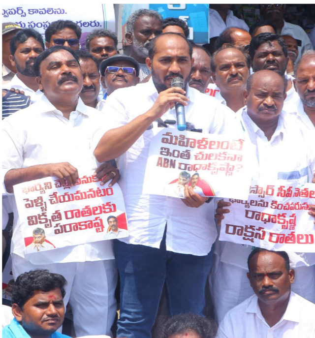
అద్దకి ఆర్.వి.ఎస్.పవర్, ఏప్రిల్ 08

మీ ఇంట్లో ఆడవారే మహిళలా? వైసీపీలో ఉన్నవారు కాదా? ఏబీఎన్ కార్యాలయం ఎదుట నిరస