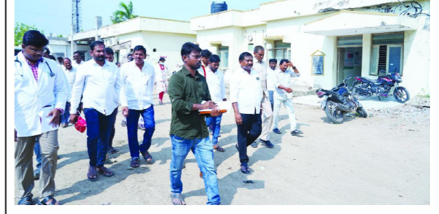
బ్యూరో పెన్ పవర్, ప్రకాశం ఏప్రిల్ 08 :

పేదల వైద్యం, ఆరోగ్యానికి కూటమి ప్రభుత్వం అధిక ప్రాధాన్యతనిస్తోందని రాష్ట్ర సాంఘిక సంక్షేమ శాఖ మంత్రి డో.లా. శ్రీ బాల వీరాంజనేయస్వామి అన్నారు. కొండపి సామాజిక ఆరోగ్య కేంద్రంలో జరుగుతున్న మరమ్మత్తు పనులు, ప్రసూరీ గోడ నిర్మాణ పనులు బుధవారం మంత్రి పరిశీలించారు. ఈ సందర్భంగా ఆయన మాట్లాడుతూ పనుల నాణ్యత విషయంలో ఎక్కడా రాజీ పడ్డారని అధికారులకు సూచించారు, త్వరగా పనులు పూర్తిచేసి వీలైనంత త్వరగా అందుబాటులోకి తీసుకురావాలన్నారు. పేదల వైద్యం, ఆరోగ్యానికి కూటమి ప్రభుత్వం అధిక ప్రాధాన్యత ఇస్తోందన్నారు. ప్రభుత్వ ఆసుపత్రుల్లో రోగులకు అవసరమైన అన్ని సౌకర్యాలు కల్పిస్తున్నామన్నారు. వైసీపీ హయాంలో ప్రజల ఆరోగ్యాన్ని గాఢీ పదిలేసారని విమర్శించారు. నేడు పేద ప్రజలకు అన్ని విధాలా ముఖ్యమంత్రి చంద్రబాబు నాయుడు అండగా ఉంటున్నారని మంత్రి డో.లా. శ్రీ బాల వీరాంజనేయస్వామి తెలిపారు.