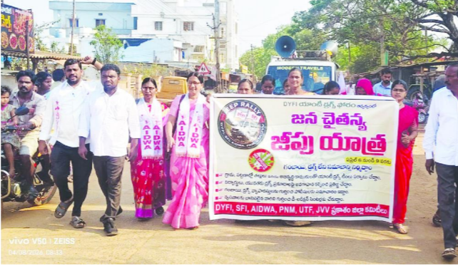
గుడ్లూరు, పెన్ పవర్, ఏప్రిల్ 08