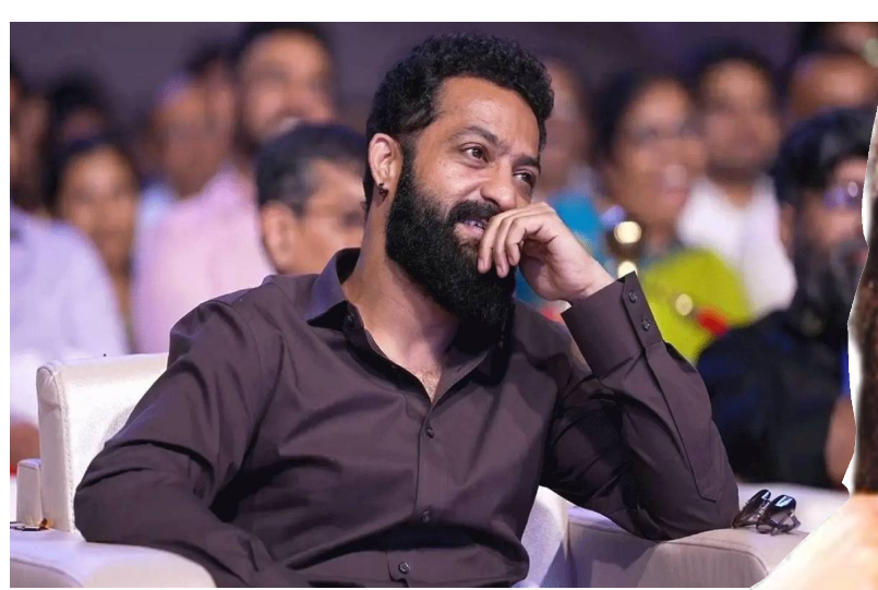
జోర్డాన్ లో ఒక కీలక షెడ్యూల్ పూర్తి చేసిన యూనిట్.

జోర్డాన్ లో ఒక కీలక షెడ్యూల్ పూర్తి చేసిన యూనిట్, ఇటీవల శంషాబాద్ సమీపంలోని ఆలయంలో వారం రోజులపాటు షూటింగ్ నిర్వహించింది. ప్రస్తుతం నగర అవుట్ స్టర్ట్ లో భారీ సెట్ నిర్మాణం జరుగుతుండగా, అక్కడి నుంచే వచ్చే నెలలో కొత్త షెడ్యూల్ ప్రారంభం కానుంది. ఈ ప్రాజెక్ట్ పాన్- ఇండియా స్థాయిలో విజువల్ గ్రాండ్ రియల్ నిలవబోతుందనే సంకేతాలు స్పష్టంగా కనిపిస్తున్నాయి. డ్రాగన్ విషయంలో తారక్ పై భారీ ఒత్తిడి ఇదిలా ఉండగా, బాలీవుడ్ లో వచ్చిన వార్తల తర్వాత ఎన్టీఆర్ కు ఈ సినిమా అత్యంత కీలకంగా మారింది. వారీ2 తో ఆశించిన స్థాయి విజయం దక్కకపోవడంతో, డ్రాగన్ ద్వారా ఎలాగైనా స్ట్రాంగ్ కంబ్యాక్ ఇవ్వాలనే ఒత్తిడి కూడా అతనిలో కనిపిస్తోంది. ఈ నేపథ్యంలోనే డ్రాగన్ పై అభిమానుల అంచనాలు కూడా భారీగా పెరిగాయి. సోషల్ మీడియాలో ఈ డిలే అంశంపై మిక్స్ రియాక్షన్ కనిపిస్తోంది. కొంతమంది అభిమానులు ఇంకెంత లేట్? అంటూ అనూహనం వ్యక్తం చేస్తుంటే, మరికొందరు మాత్రం మంచి అవుట్ పుట్ కోసం సమయం తీసుకోవడం సరైన నిర్ణయమేనని టీమ్ కు మద్దతు తెలుపుతున్నారు. మొత్తానికి, డ్రాగన్ టీమ్ తీసుకున్న ఈ డెసిషన్ రిస్కోతో కూడుకున్నదే. ఒకవైపు డిలే వల్ల మార్కెట్ లో ఒత్తిడి పెరిగే అవకాశం ఉన్నప్పటికీ, మరోవైపు పర్వెక్షన్ అవుట్ పుట్ సాధిస్తే అది భారీ రివెన్యూ మారే అవకాశం ఉంది. కంటెంట్ పై ఉన్న కాన్ఫిడెన్స్, క్లియర్ విజన్ తో ముందుకు సాగుతున్న ఈ ప్రాజెక్ట్ నిజంగా తారక్ లైఫ్ లో గేమ్ ఛేంజర్ అవుతుందా లేదా అన్నది ఇప్పుడు ఆసక్తికరంగా మారింది.