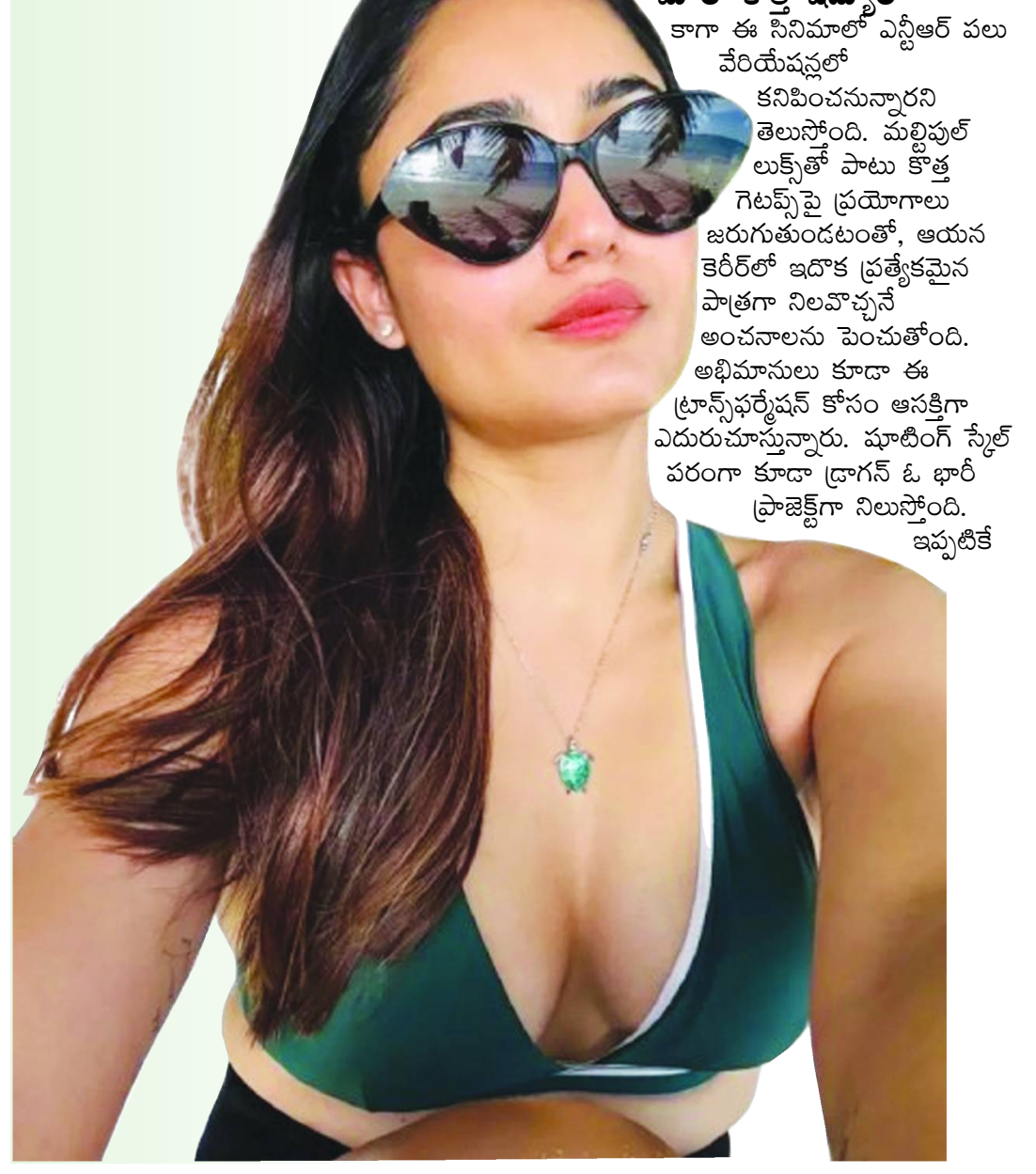
అభిమానులు కూడా ఈ ట్రాన్స్ ఫర్మేషన్ కోసం ఆసక్తిగా ఎదురుచూస్తున్నారు. షూటింగ్ స్పీల్ పరంగా కూడా డ్రాగన్ ఓ భారీ ప్రాజెక్టు నిలుస్తోంది. ఇప్పటికే

లక్ తో అసంతృప్తి అయితే ఈ బ్రేక్ వెనుక ఉన్న కారణం ఏదో నార్మల్ రీజన్ కాదు. సినిమా కోసం రెడీ చేసిన కొత్త లుక్ విషయంలో ఎన్టీఆర్, ప్రశాంత్ నీల్ ఇద్దరూ పూర్తిగా సంభ్రమి చెందకపోవడంతో మాట్లను ఆవాలని డిసైడ్ అయ్యారట. పర్వెక్షన్ విషయంలో ఎలాంటి రాజీ పడకుండా, లేవైనా సరే బెస్ట్ అవుట్ పుట్ ఇవ్వాలనే దృఢ సంకల్పంతో ఈ నిర్ణయం తీసుకున్నట్లు సమాచారం.