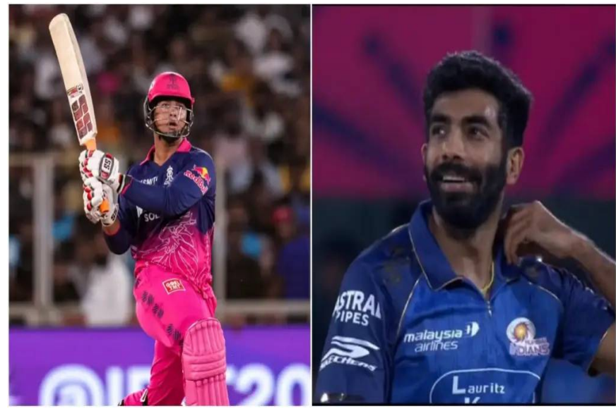
హైదరాబాద్ పెన్ పవర్: "గత ఏడాది బువ్రా బౌలింగ్లో ఔటయ్యాను. ఈసారి అతడి బౌలింగ్లో పరుగులు చేయాలి..." ఇటీవలే యువ సంచలనం వైభవ్ సూర్యవంశీ పెట్టుకున్న లక్ష్యం. చెప్పడమే కాదు, గతరాత్రి ముంబై ఇండియన్స్ తో జరిగిన మ్యాచ్లో ప్రపంచ స్ట్రాయి బౌలర్ జస్ప్రీత్ బువ్రా బౌలింగ్లో దూకుడుగా ఆడి దాన్ని చేసి చూపించాడు. ఈ అద్భుత ప్రదర్శనపై భారత మాజీ ఆల్రౌండ్ ఇర్ఫాన్ పఠాన్ ప్రశంసల వర్షం కురిపించాడు. వైభవ్ ప్రదర్శనపై స్పందించిన ఇర్ఫాన్, అతడిని వెంటనే జాతీయ జట్టులోకి తీసుకోవాలని బీసీసీఐకి సూచించాడు. "వైభవ్ ఒక యువ సంచలనం. 15 ఏళ్ల వయసులో వైట్ బాల్ క్రికెట్లో ఇంతటి పరిణతితో కూడిన ప్రదర్శన అసాధారణం. బువ్రా బౌలింగ్ను ఎదుర్కోవడం చాలా కష్టం. అలాంటిది, అతడిపై పరుగులు చేస్తానని చెప్పి, చేసి చూపించాడు. తన లక్ష్యాన్ని చేరుకున్నాడు" అని ఇర్ఫాన్ కొనియాడాడు. "ఈ కుర్రాడిని ఎక్కువ కాలం వేచి చూసేలా చేయొద్దు. ఇప్పుడే జాతీయ జట్టులోకి తీసుకుంటే, అతడు సుమారు 20 ఏళ్ల పాటు దేశానికి సేవలందించగలడు" అని ఇర్ఫాన్ అభిప్రాయపడ్డాడు. ముంబైతో జరిగిన మ్యాచ్లో వైభవ్ సూర్యవంశీ కేవలం 14 బంతుల్లోనే 39 పరుగులు బాది అందరి దృష్టిని ఆకర్షించాడు. ఈ ఐపీఎల్ సీజన్లో అగ్రశ్రేణి బౌలర్లను సైతం ఎదుర్కొని నిలకడగా రాణిస్తుండటంతో, ఇర్ఫాన్ వ్యాఖ్యలు ప్రాధాన్యత సంతరించుకున్నాయి.