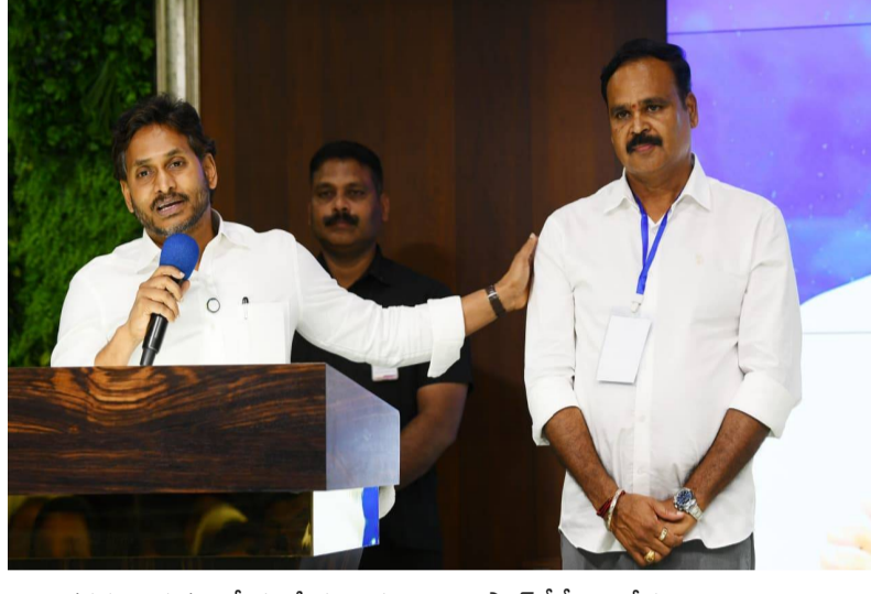
నియోజకవర్గ నాయకులతో మాజీ ముఖ్యమంత్రి, వైఎస్సార్ సీపీ అధినేత జగన్మోహన్ రెడ్డి సమావేశమయ్యారు. తాడేపల్లిగూడెం అసెంబ్లీ నియోజకవర్గం నుండి సుమారు 250 మంది వైఎస్సార్ సీపీ స్థానిక సంస్థల మాజీ ప్రజాప్రతినిధులు, ముఖ్య నాయకులు, కార్యకర్తలతో ఈ సమావేశం జరిగింది. ఈ సందర్భంగా మాజీముఖ్యమంత్రి జగన్మోహన్ రెడ్డి మాట్లాడుతూ స్థానిక పరిస్థితులపై మాట్లాడారు. నాయకులు కార్యకర్తలు