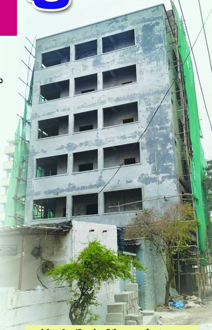
నిజాంపేట్ సర్కిల్, రాజీవ్ గాంధీ నగర్ లో.. అనుమతులేని బహుళ అంతస్తులు..

మేడ్చల్ జిల్లా బ్యారో, పెన్ పవర్, ఏప్రిల్ 8: