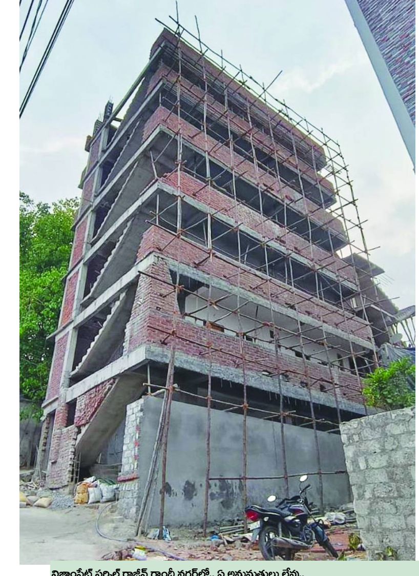
నిజాంపేట్ సర్కిల్ రాజీవ్ గాంధీ నగర్లో.. ఏ అనుమతులు లేవు..