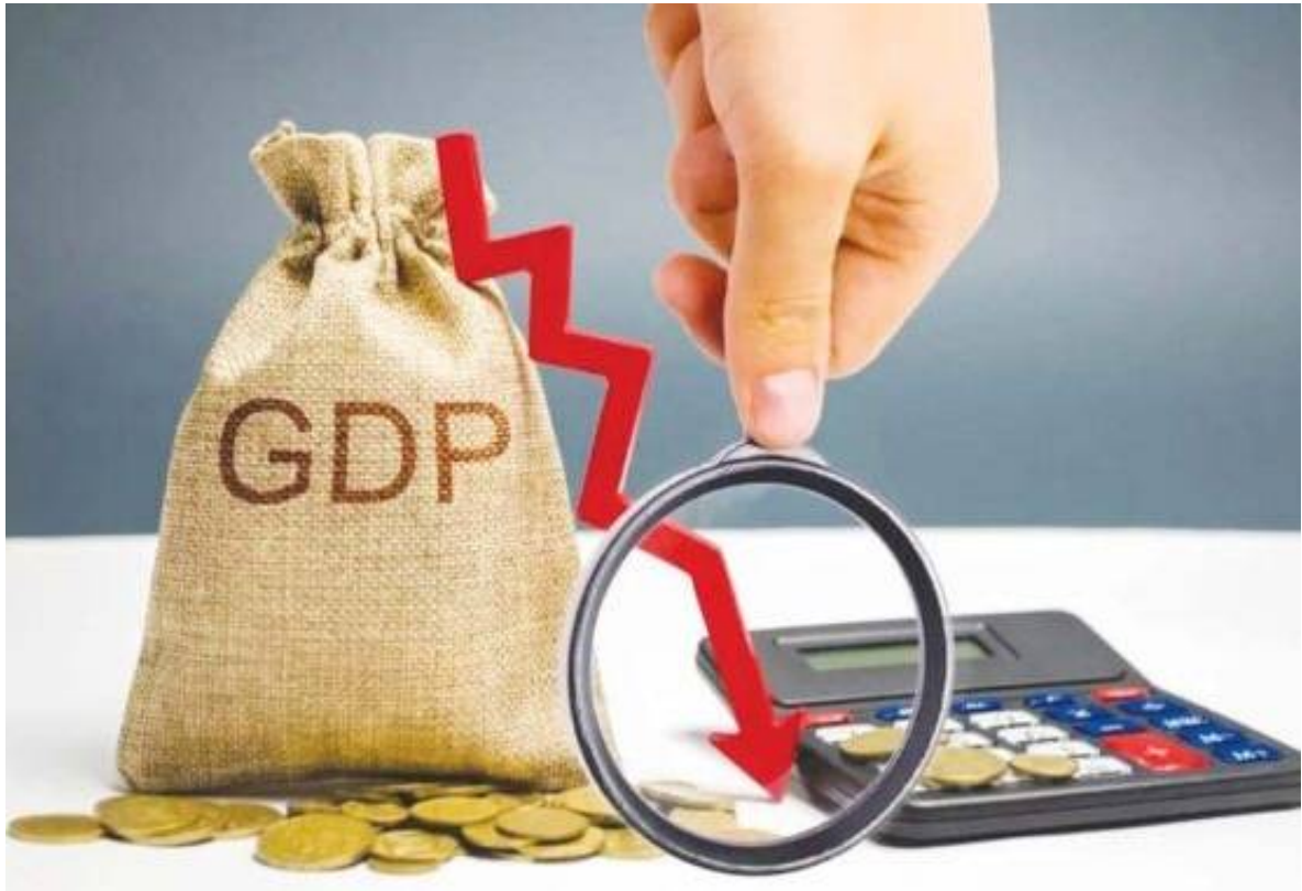
కారణం అంతర్జాతీయంగా నెలకొన్న ఉద్రిక్తతల వల్ల ప్రభావితం చెందిన చమురు ధరల పెరుగుదల భారత ఆర్థిక వ్యవస్థపై బహుముఖ ప్రభావం చూపే ప్రాంతాలకు ఎగుమతులు తగ్గడం, వెరసి, ముడిచమురు ధరల అవకాశం ఉందని మోర్గాన్ స్టాన్లీ స్పష్టం చేసింది.

పశ్చిమాసియాలో నెలకొన్న యుద్ధంతో భగ్గుమంటున్న చమురు మంట భారత వృద్ధి రేటుకు విఘాతాన్ని కల్పించనుందని అంతర్జాతీయ పైనాన్సియల్ దిగ్గజం మోర్గన్ స్టాన్లీ హెచ్చరించింది. ముడి చమురు ధరలు ఒక్క త్రైమాసికం పాటు బ్యారల్లకు 150 డాలర్లకు చేరితే ఆర్థిక సంవత్సరం 2026-27లో భారత వృద్ధి 5.7 శాతానికి పడిపోయే ప్రమాదం ఉందని విశ్లేషించింది. కరోనా మహమ్మారి తర్వాత భారత్ సమోదా చేసే అత్యల్ప వృద్ధిరేటు ఇదే అవుతుందని మంగళవారం విడుదల చేసిన చేసిన నివేదికలో తెలిపింది. ప్రస్తుతం ట్రెంట్ క్రూడ్ ధర ఇప్పటికే 111 డాలర్ల పైనే కొనసాగుతుండటం.. ముఖ్యంగా హోర్నోజ్ జలసంధి వద్ద నెలకొన్న ఉద్రిక్తతల నేపథ్యంలో ఈ అంచనాలు ప్రాధాన్యత సంతరించుకున్నాయి. చమురు ధరల పెరుగుదల దేశ ఆర్థిక స్థిరత్వాన్ని కూడా తీవ్రంగా దెబ్బతీసే అవకాశం ఉంది. ఒకవేళ చమురు 150 డాలర్ల మార్కును తాకితే.. వినియోగదారుల ధరల సూచీ (సీపీఐ) ఆధారిత ద్రవ్యోల్బణం రిజర్వ్ బ్యాంక్ గరిష్ట పరిమితి అయిన 6 శాతం దాటిపోవచ్చని మోర్గాన్ స్టాన్లీ అంచనా వేసింది. దీనికి తోడు కరెంట్ అకౌంట్ లోటు (సీపీడి) కూడా జీడిపీలో 3 శాతానికి పెరిగే ముప్పు ఉంది. సాధారణ పరిస్థితుల్లో ట్రెంట్ క్రూడ్ సగటున 95 డాలర్ల అంచనాతో భారత జీడిపీని గతంలోని 6.5 శాతం నుంచి 6.2 శాతానికి తగ్గించింది. అలాగే ద్రవ్యోల్బణం అంచనాను 5.1 శాతానికి పెంచడం గమనార్హం. ఈ వృద్ధి మందగమనానికి ప్రధానంగా మూడు కారణాలు నివేదిక విశ్లేషించింది. ఇంధనం, ముడి సరుకుల ధరలు పెరగడం వల్ల ఉత్పత్తి వ్యయం అధికమై తయారీ రంగంపై ప్రభావం చూడుతుంది. రెండోది నిత్యావసర వస్తువుల ధరలు పెరగడం వల్ల సామాన్యుల కొనుగోలు శక్తి తగ్గి వినియోగం మందగిస్తుంది. ఇక మూడో