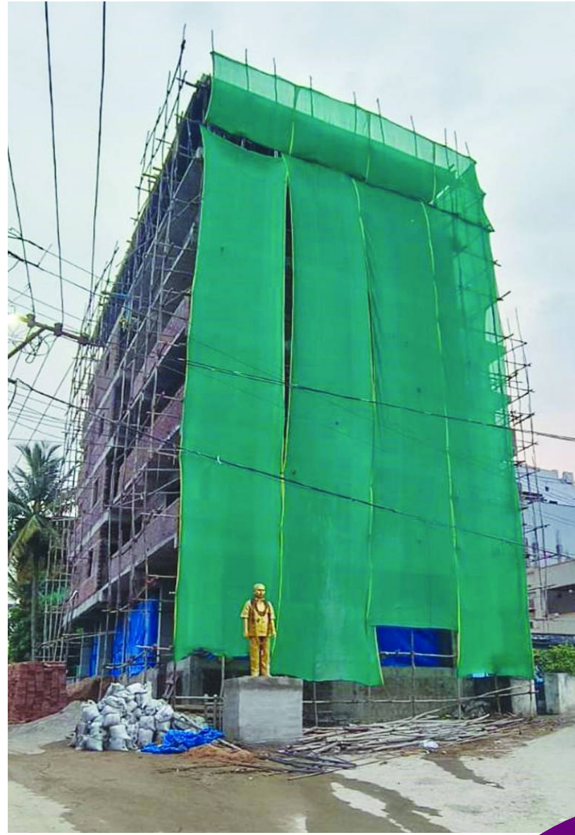
రాజీవ్ గాంధీ నగర్ ఫ్లమ్ ఏరియాలో ధనికుల అక్రమ కట్టడాలు..