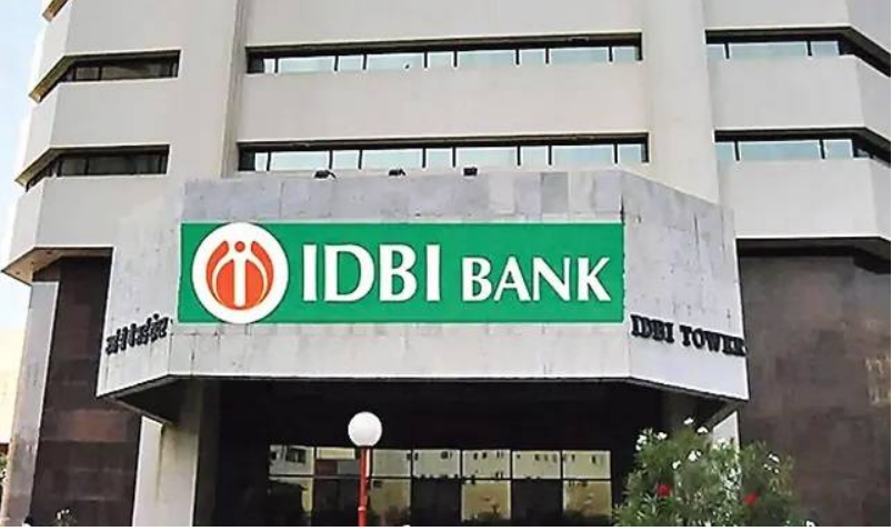
ప్రస్తుతం ఐడిబీఐలో ప్రభుత్వం (45.48%), ఎల్ఐఐసీ (49.24%)కి వాటాలు ఉన్నాయి.

ఐడిబీఐ బ్యాంక్ వ్యాహాత్మక వాటా విక్రయ ప్రక్రియ ఆర్థిక బిడ్ల తుది దశకు చేరుకుంది. విక్రయాన్ని త్వరగా పూర్తి చేయాలని భావిస్తున్న ప్రభుత్వం, ఈ ప్రక్రియ మొత్తాన్ని మళ్లీ మొదటి నుంచి ప్రారంభించాలనుకోవడం లేదు. అందువల్ల ఇప్పటికే ముందుకు వచ్చిన ఇద్దరు కొనుగోలుదారులను, ఆర్థిక బిడ్లు సవరించి దాఖలు చేయమని కోరే అవకాశం ఉందని తెలుస్తోంది. ఐడిబీఐ బ్యాంక్ లో వాటా విక్రయానికి ప్రభుత్వం 2022 అక్టోబరులో ఆసక్తి వ్యక్తీకరణ (ఈఓఓ)ను వివిధ సంస్థల నుంచి కోరింది.