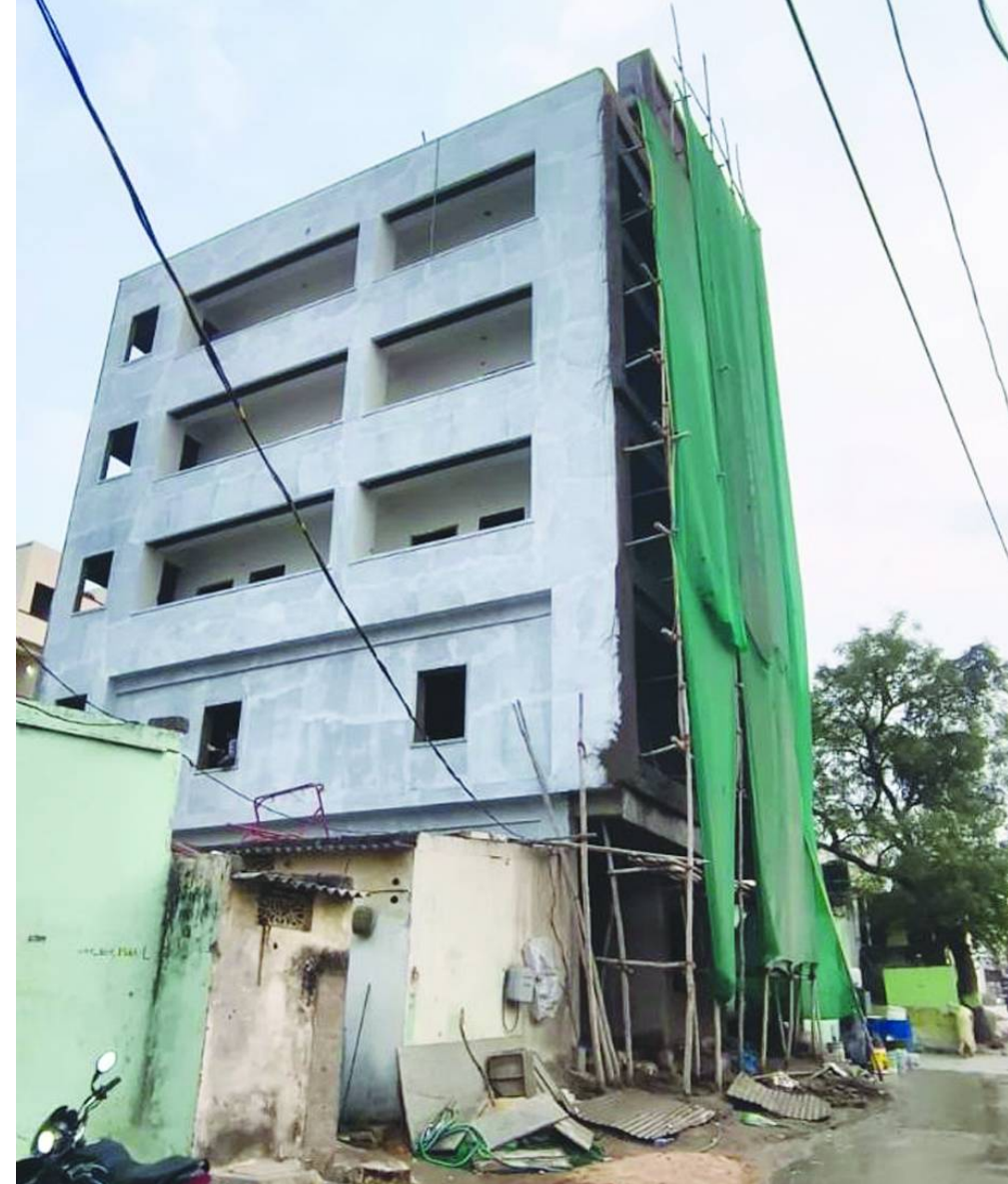
నిజాంపేట్ సర్కిల్ రాజీవ్ గాంధీ నగర్లో అనుమతుల్లేని అక్రమ నిర్మాణాలు..