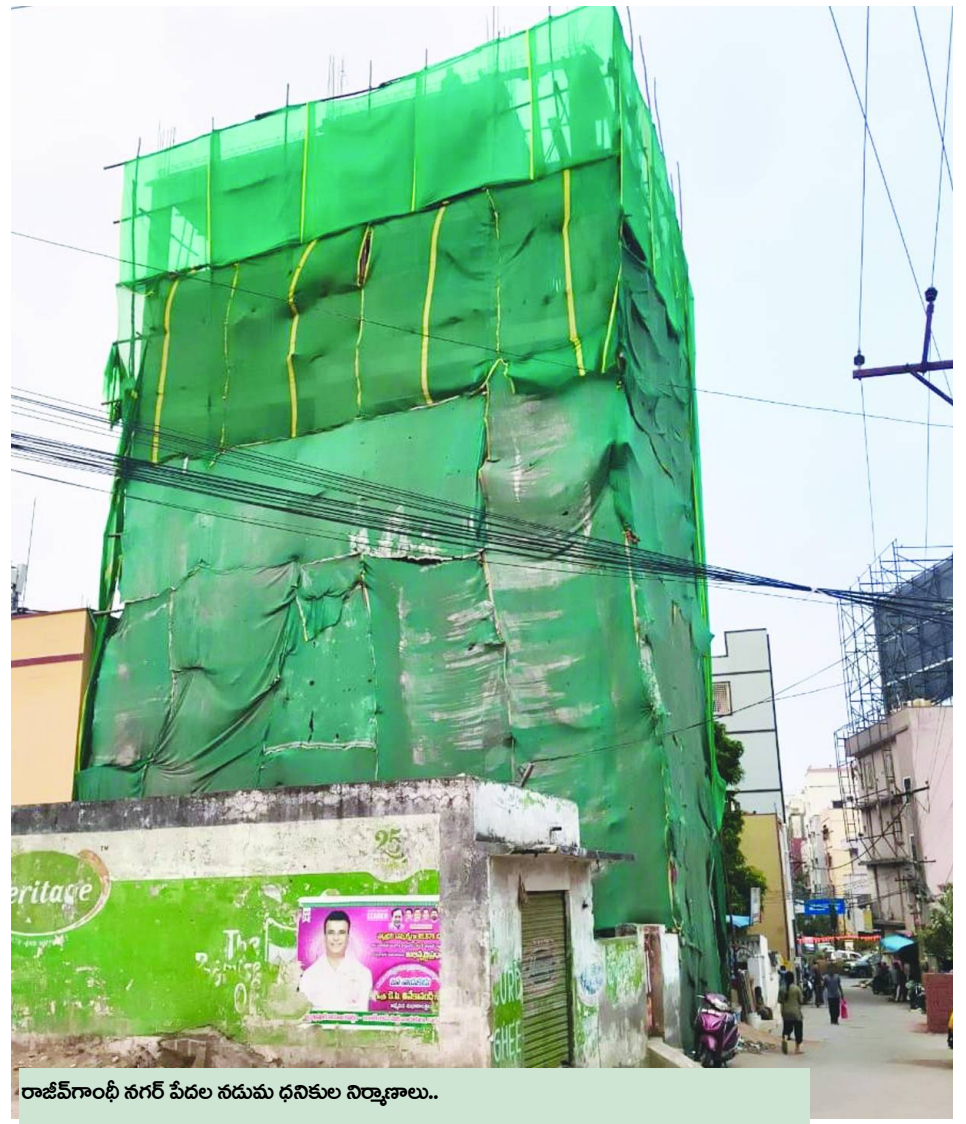
రాజీవ్ గాంధీ నగర్ పేదల నడుమ ధనికుల నిర్మాణాలు..

నిజాంపేట్ సర్కిల్ సిఎస్ఐ టౌన్ ప్లానింగ్ విభాగంలో అధికారుల విధుల తీరు, తీవ్ర విమర్శలకు తావిస్తోంది.. మహానగరంలో భాగమైన నిజాంపేట్ సర్కిల్-58 పరిధిలోని బాచుపల్లికి వెళ్ళేదారిలో అత్యంత ఖరీదైన ప్రాంతంగా ఉన్న 'రాజీవ్ గాంధీ నగర్' నేటికీ మురికివాడల లిస్టులో ఉండటం గమనార్హం.. ప్రభుత్వ భూమిలో దాదాపు 20 ఏళ్ల క్రితమే, అప్పటి ఉమ్మడి ఆంధ్రప్రదేశ్ ప్రభుత్వం 80 గజాల పట్టాలు పేదలకు మంజూరు చేసింది.. ఈ ఇరవై సంవత్సరాల్లో నిజాంపేట్ సర్కిల్ పరిధి విపరీతంగా అభివృద్ధి చెందినా..! రాజీవ్ గాంధీ నగర్ నేటికీ మురికివాడ(స్లమ్) గానే పరిగణిస్తుంది.. బహుశా పట్టాలు పొందిన పేదలు అధికకాతం అమ్ముకునే ఉంటారు..