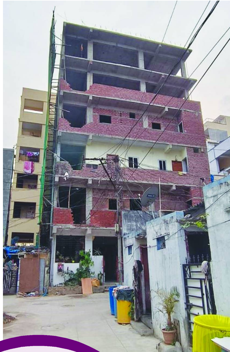
రాజీవ్ గాంధీ నగర్ నిజాంపేట్ సర్కిల్-58..