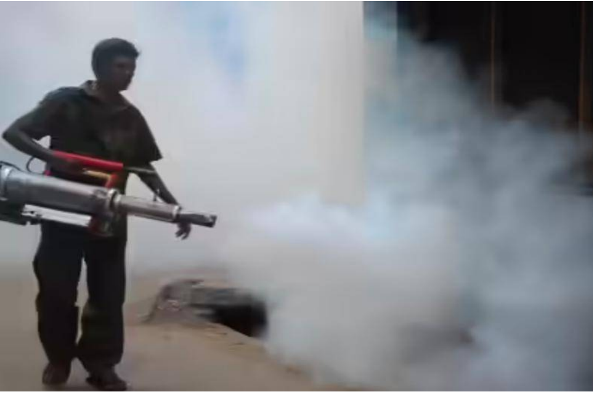
మొక్కలుడిగా చేపడుతూ ప్రజారోగ్యాన్ని నిర్లక్ష్యం చేస్తున్నారని, అధికారులు స్పందించి దోమల నివారణకు వార్డులలో ఫాగింగ్ చేయించాలని ప్రజలు కోరుతున్నారు.

గార్ల, పెన్ పవర్, ఏప్రిల్ 8: మహబూబాబాద్ జిల్లా గార్ల మండల కేంద్రంలో దోమల బెడదతో ప్రజలు తీవ్ర ఇబ్బందులు ఎదుర్కొంటున్నారు. వీధుల్లో ఉన్న కాళీ స్థలాలలో పిచ్చి మొక్కలు మొలిచి మురుగు కాలువల్లో నిలిచిన చెత్తాచెదారంతో నీరు నిలువ ఉండటంతో దోమలు ఆవాసాలుగా చేసుకొని సంతతి పెరగటానికి కారణమై పగలు రాత్రి తేడా లేకుండా దోమల విజృంభంతో కంటిమీద కుసుకు లేకుండా పోతుందని ఆవేదన వ్యక్తంచేస్తున్నారని దోమల స్వేదన విహారంతో ఆరుబయట సైతం నిల్వేలేని పరిస్థితి నెలకొంది దోమల నివారణకు కనీసం కాలువలలో బ్లీచింగ్ పౌడర్ చల్లడం లేదని ప్రజా ప్రతినిధులు ఉన్నతాధికారులు గ్రామంలో పర్యటించినప్పుడు మాత్రమే బ్లీచింగ్ పౌడర్ చల్లించి పంచాయతీ అధికారులు చేతులు దులుపుకోవడం పరిపాటిగా మారుతుందని దోమల వ్యాప్తి వివరీతంగా పెరిగి ప్రతిపేట ప్రజలు సీజనల్ వ్యాధుల బారిన ప్రాణాలు కోల్పోతున్నప్పటికీ వాటిని నివారించేందుకు గ్రామపంచాయతీ అధికారులు చేస్తున్న కృషి అంతంత మాత్రంగానే ఉందని ఆరోపిస్తున్నారని పారిశుధ్య నిర్వహణలో భాగంగా దోమల్ని అరికట్టేందుకు గ్రామ పంచాయతీ కీ ఫాగింగ్ యంత్రం ఉన్నప్పటికీ ఫాగింగ్ యంత్రంతో దోమల మందు పిచికారి చేయడం లేదని ప్రజల ఆలోచన గ్యాన్లు ద్వారానే ఉంచుకొని తక్షణ చర్యలు చేపట్టాల్సిన అధికారులు చోద్యం చూస్తున్నారని వాపోతున్నారని ప్రైడ్ డ్రైడ్ ద్వారా దోమల నియంత్రణ చర్యలను చేపట్టాల్సి ఉందని