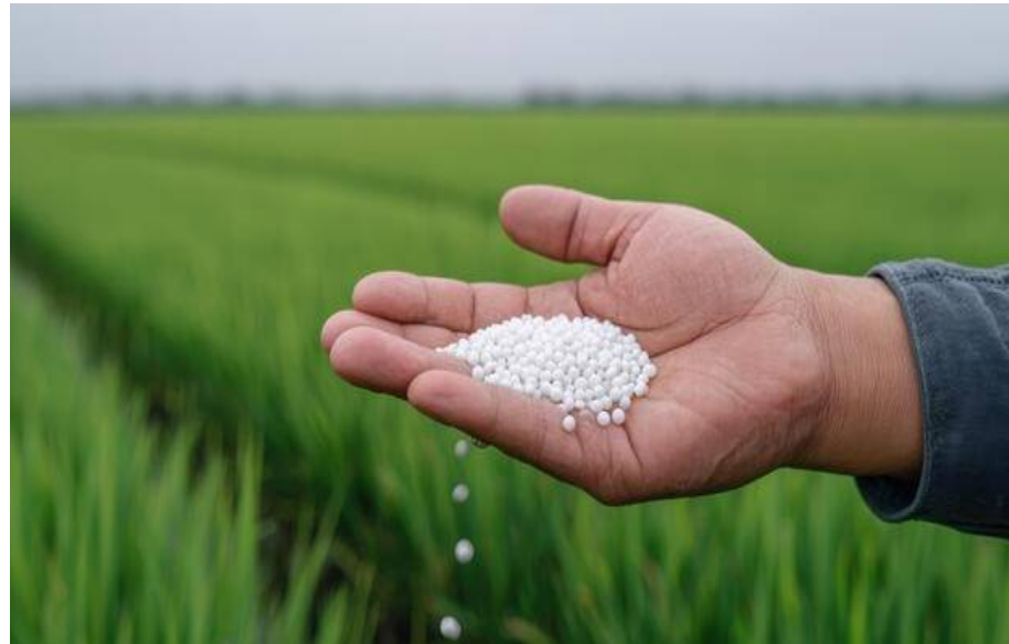
దీర్ఘకాలంలో నేల సారాన్ని తగ్గిస్తుంది. యూరియాలో 46 శాతం నైట్రోజన్ ఉంటుంది. భారత్ లో రైతులు అధిక దిగుబడుల కోసం యూరియాను ఎక్కువగా వాడుతున్నారు. సరైన నిష్పత్తి 4:2:1 కాగా.. ప్రస్తుతం ఇది సగటున 9:3:1కి పెరిగింది. అంటే ప్రతి ఒక కిలో పొటాషి కు రైతులు 9 కిలోలకు పైగా నైట్రోజన్ను

మధ్యప్రాంత యుద్ధం కారణంగా ఇంధన సరఫరాలో అంతరాయం ఏర్పడింది. దీని ప్రభావం ప్రపంచవ్యాప్తంగా ప్రతీ దేశం పైనా, ప్రతీ రంగం మీదా పడింది. భారత్ లోనూ ఇదే పరిస్థితి కనబడుతోంది. దేశంలో ప్రధాన ఎరువైన యూరియా కొరత ఏర్పడే ప్రమాదం ఉందని నిపుణులు హెచ్చరిస్తున్నారు. మోడీ సర్కారుకు ముందు చూపు లోపించడం కారణంగానే ఈ పరిస్థితి ఎదురువుతో ఉందని వివరిస్తున్నారు. అలాగే రైతులు యూరియా వినియోగం పెంచారనీ, పర్యవేక్షించాల్సిన యంత్రాంగాలు ఏమీ పట్టనట్లు వ్యవహరిస్తున్నాయనీ ఆందోళన వ్యక్తం చేస్తున్నారు. పరిస్థితి ఇలాగే కొనసాగితే దేశంలో యూరియా సంక్షోభం తీవ్రమై, అది ఆహార ఉత్పత్తిపై ప్రతికూల ప్రభావాన్ని చూపుతుందని నిపుణులు హెచ్చరిస్తున్నారు. కేంద్రంలోని మోడీ సర్కారు నిద్ర వీడి ప్రస్తుత సమస్యకు పరిష్కారం వెతకాలని సూచిస్తున్నారు. మధ్యప్రాంతంలో జరుగుతోన్న యుద్ధం కారణంగా ముడి చమురు ధరలు భారీగా పెరిగాయి. అలాగే ఎల్పీజీ కొరత ఏర్పడింది. చమురు, గ్యాస్ సరఫరాలో అంతరాయంతో పలు రంగాలు ప్రభావితమవుతున్నాయి. ముఖ్యంగా ఎల్ఎన్ఐ సరఫరా తగ్గడంతో భారత్ లో యూరియా ఉత్పత్తి దెబ్బతింటుందని నిపుణులు హెచ్చరిస్తున్నారు. ఇక రైతులు ఎన్పీజీ ఎరువుల సరైన నిష్పత్తిని పాటించడం లేదని అధికారులు చెబుతున్నారు. శాస్త్రీయంగా సరైన ఎరువు నిష్పత్తి 4:2:1 (నైట్రోజన్:ఫాస్ఫరస్:పొటాషి) ఉండాలి. ఇందులో నైట్రోజన్ భాగమే యూరియా. ఇది పంటలకు తక్షణ ఫలితాలు ఇస్తుంది కానీ