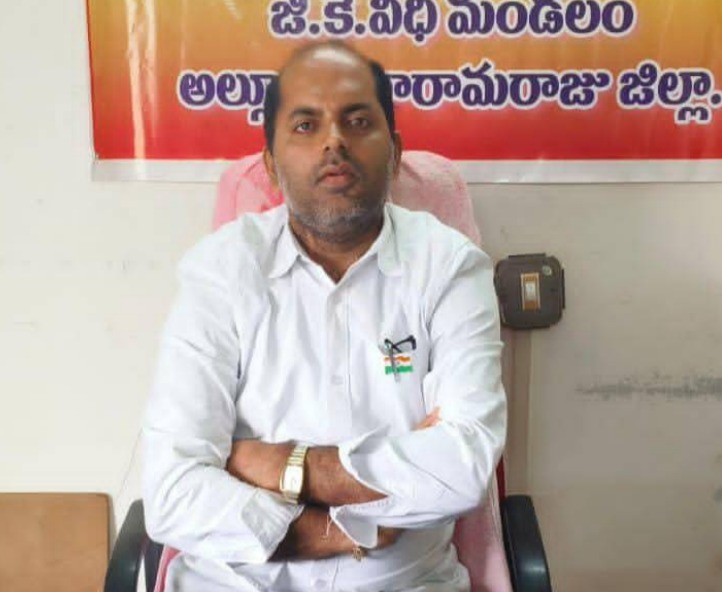
లిఫ్టింగ్ ఆపరేషన్ ద్వారా గ్రామాల నివాసాలు, కుటుంబాల వివరాలు సమగ్రంగా సేకరించబడతాయి.