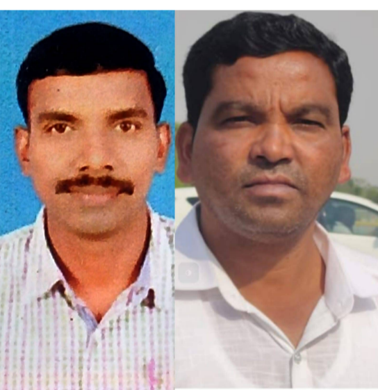
ఎన్. గురుదొర, ప్రధాన కార్యదర్శి దేవుడు విజ్ఞప్తి చేశారు

గూడెం కొత్త వీధి, పెన్ పవర్, ఏప్రిల్ 9: ఆంధ్రప్రదేశ్ లో అమలులోకి వచ్చిన ప్రభుత్వ ఉద్యోగ నియామక ఉత్తర్వు--2025 మరియు బహుళ మండల వ్యవస్థ కాణంగా అల్లూరి సీతారామరాజు, విశాఖపట్నం జిల్లా గిరిజనులకు అన్యాయం జరుగుతోందని దెమోక్రటిక్ టీచర్స్ ఫెడరేషన్ (డిటీఎఫ్) నాయకులు ఆందోళన వ్యక్తం చేశారు. ముఖ్యంగా అల్లూరి జిల్లాను జోన్--ఒకటి నుంచి జోన్--రెండులోకి మార్చడం వల్ల గిరిజన యువత విశాఖలోని ప్రభుత్వ ప్రజా రంగ ఉద్యోగాలకు అర్హత కోల్పోతున్నారని తెలిపారు. విశాఖపట్నం ప్రధాన పారిశ్రామిక కేంద్రంగా ఉండి అనేక ఉద్యోగ అవకాశాలు కల్పిస్తున్నప్పటికీ, ప్రస్తుత విధానం కారణంగా అల్లూరి గిరిజనులు వాటికి దూరమవుతున్నారని పేర్కొన్నారు. చారిత్రకంగా, భౌగోళికంగా విశాఖతో అనుసంధానం ఉన్న ఏజెన్సీ ప్రాంతాలను వేరుచేయడం అభివృద్ధికి ఆటంకమని అభిప్రాయపడ్డారు. అల్లూరి జిల్లాను తిరిగి జోన్--ఒకటిలో చేర్చాలని, గిరిజనులకు ప్రత్యేక అవకాశాలు కల్పించాలని, బహుళ మండల వ్యవస్థ ప్రణాళికపై సమీక్ష కమిటీ ఏర్పాటు చేయాలని డిటీఎఫ్ డిమాండ్ చేసింది. గిరిజనుల భవిష్యత్తు, హక్కుల పరిరక్షణ దృష్ట్యా ప్రభుత్వం తక్షణ చర్యలు తీసుకోవాలని సంఘం అధ్యక్షుడు