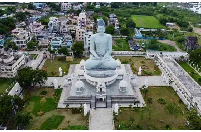
వినియోగించుకోనున్నారు. కేంద్ర కేబినెట్ నుంచి తుది ఆమోదం లభించిన వెంటనే టెండర్ ప్రక్రియను ప్రారంభించి, రాబోయే రెండేళ్లలోపు నిర్మాణాన్ని పూర్తి చేయాలని ప్రభుత్వం లక్ష్యంగా పెట్టుకుంది. కేంద్ర సచివాలయ నిర్మాణం వల్ల అమరావతి ప్రాంతంలో అధిక కార్యకలాపాలు మరింత పుంజుకోనున్నాయి. వేలాది మంది కేంద్ర ప్రభుత్వ ఉద్యోగులు ఒకే ప్రాంతానికి రావడం వల్ల స్థిరాస్తి రంగానికి ఊతం లభించడమే కాకుండా, స్థానికంగా సేవా రంగంలో ఉపాధి అవకాశాలు పెరుగుతాయి. అమరావతిని కేవలం ఒక పరిపాలనా కేంద్రంగానే కాకుండా, జాతీయ స్థాయిలో ఒక కీలకమైన నగరంగా తీర్చిదిద్దడంలో ఈ ప్రాజెక్టు

విజయవాడ, ఏప్రిల్ 9, పెన్ పవర్: ఆంధ్రప్రదేశ్ రాజధాని అమరావతిలో అన్ని కేంద్ర ప్రభుత్వ కార్యాలయాలను ఒకే గొడుగు కిందకు తీసుకురావాలనే లక్ష్యంతో ప్రభుత్వం భారీ ప్రణాళికను సిద్ధం చేసింది. దీని కోసం రూపొందించిన సమగ్ర ప్రాజెక్టు నివేది తుది దశకు చేరుకుంది. ఢిల్లీలోని సెంట్రల్ వెస్ట్ తరహాలో, సుమారు 20 నుంచి 25 ఎకరాల విస్తీర్ణంలో ఈ అత్యాధునిక సచివాలయ సముదాయాన్ని నిర్మించనున్నారు. ప్రస్తుతం వివిధ ప్రాంతాల్లో అగ్ర భవనాల్లో కొనసాగుతున్న సుమారు 50కి పైగా కేంద్ర ప్రభుత్వ విభాగాలు, అనుబంధ సంస్థలు ఈ నూతన భవనంలోకి మారనున్నాయి. ఈ ప్రాజెక్టును కేవలం కార్యాలయ భవనంగానే కాకుండా, పర్యావరణ హితమైన గ్రీన్ బిల్డింగ్ ప్రమాణాలతో నిర్మించనున్నారు. ఐకానిక్ డిజైన్ తో కూడిన ఈ భవన సముదాయంలో సెంట్రలైజ్డ్ ఎయిర్ కండిషనింగ్, అత్యాధునిక ఐటీ మౌలిక సదుపాయాలు, కాస్టు రెస్పాన్సివ్ హోల్స్, విశాలమైన పార్కింగ్ సౌకర్యాలు ఉండనున్నాయి. సుమారు 10 నుంచి 12 అంతస్తుల ఎత్తుతో నిర్మించనున్న ఈ భవనం, అమరావతి నగరానికి ఒక ప్రత్యేక ఆకర్షణగా నిలవనుంది. దీని ద్వారా పాలనలో వేగం పెరగడంతో పాటు, ప్రజలకు అన్ని కేంద్ర సేవలు ఒకే చోట లభించే వెసులుబాటు కలుగుతుంది. ఈ ప్రాజెక్టు నిర్మాణ బాధ్యతలను కేంద్ర ప్రజా పనుల శాఖ పర్యవేక్షించనుంది. ప్రాథమిక అంచనాల ప్రకారం, ఈ సముదాయం నిర్మాణానికి సుమారు రూ. మూడు వేల కోట్ల వరకు వ్యయం కావచ్చని భావిస్తున్నారు. రాజధాని ప్రాంతంలో ఇప్పటికే రాష్ట్ర ప్రభుత్వం కేటాయించిన భూములను దీని కోసం