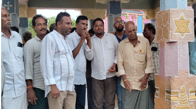
బుచ్చిరెడ్డిపాలెం పెన్ పవర్ ఏప్రిల్ 9. బుచ్చిరెడ్డిపాలెం మండలంలోని