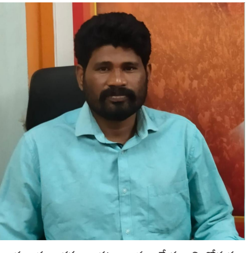
న్యాయవాదుల రక్షణ చట్టం అమలుచేయాలని కోరుతూ, రాష్ట్రంలోని జూనియర్ న్యాయవాదులకు ఉపకార వేతనాలు, లైబ్రరీ ఏర్పాటుకు రుణాలు ఇవ్వాలన్నారు. న్యాయవాదుల సంక్షేమం కోసం బడ్జెట్లో నిధులు కేటాయించి, హైకోర్టులో న్యాయమూర్తుల నియమకంలో న్యాయవాదుల కోటా నుంచి భర్తీ చేయాలని కోరారు. న్యాయవాదులపై దాడులే పాల్గొనే వారికి సకాలంలో శిక్ష పడేలా చర్యలు తీసుకోవాలన్నారు.