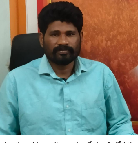
న్యాయవాదుల రక్షణ చట్టం అమలుచేయాలని కోరుతూ, రాష్ట్రంలోని జూనియర్ న్యాయవాదులకు ఉపకార వేతనాలు, లైబ్రరీ ఏర్పాటుకు రుణాలు ఇవ్వాలన్నారు. న్యాయవాదుల సంక్షేమం కోసం బడ్జెట్లో నిధులు కేటాయించి, హైకోర్టులో న్యాయమూర్తుల నియమకంలో న్యాయవాదుల కోటా నుంచి భర్తీ చేయాలని కోరారు. న్యాయవాదులపై దాడులే పాల్గొనే వారికి సకాలంలో శిక్ష పడేలా చర్యలు తీసుకోవాలన్నారు.