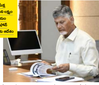
సీఎం ప్రత్యేకంగా దృష్టి సారించారు. డీఎం లబ్ధిదారులు పేపర్ కనెక్టుకు మారితే, వారికి పథకం కింద అండ్ రాయితీ

పేన్ పవర్ డెప్యూటీ మంత్రి గ్యాస్ సరఫరా, ప్రైవేటీకరణ గ్యాస్ (పేపర్) కనెక్టు ఫుల్ గెజిట్ ముఖ్యమంత్రి చంద్రబాబు సచివాలయంలో ఉన్నతస్థాయి సమీక్ష నిర్వహించారు. అంతర్జాతీయంగా యుద్ధాల కారణంగా ఎక్స్ కే గ్యాస్ సరఫరాలో తరచుకున్న సవాళ్లను ఎదుర్కోవడానికి పూర్తి సన్నద్ధతతో పనిచేయాలని అధికారులను, అంబేద్కర్ కంపెనీని ప్రతినిధులను ఆదేశించారు. ప్రత్యామ్నాయంగా పేపర్ వినియోగాన్ని ప్రోత్సహించే విధానాలను స్పష్టం చేశారు. వచ్చే 6 నెలల్లో రాష్ట్రవ్యాప్తంగా 10 లక్షల కంటెయ్నర్లు విజ్ఞానం లక్ష్యంగా నిర్దేశించారు. ఈ విషయంలో ఎలాంటి జాప్యం జరగకూడదని, నిర్దిష్ట లక్ష్యాన్ని ఎత్తిపరిమితుల్లోనే చేరుకోవాలని తెల్పిచ్చారు. ఈ సమీక్షలో భాగంగా 'సీఎం' పథకం లబ్ధిదారులను పేపర్ ప్రైవేటీకరణపందంపై