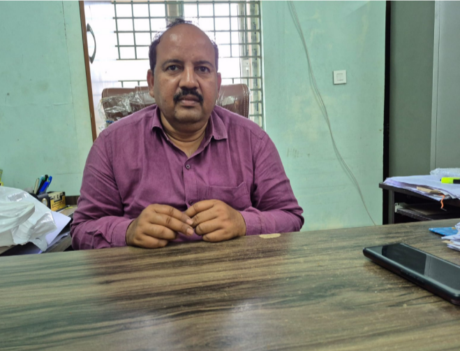
కంట్రోల్ రూమ్ నెం.94932 47765 కు కాల్ చేసి పిర్యాదు చేయాలని ఆయన అప్రకటనలో తెలిపారు.