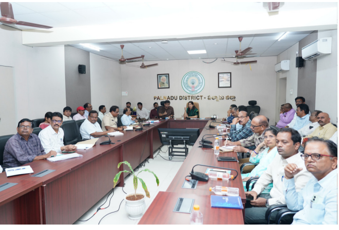
పాటు నరసరావుపేట, సజినపల్లి, పిడుగురాళ్ల ప్రాంతాలకు చెందిన అసిస్టెంట్ కమిషనర్లు (రాష్ట్ర పన్నులు) పాల్గొన్నారు.