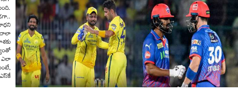
పోర్ ఛాన్స్ ఉంది. ఈ ఫ్లాట్ ట్రాక్ పై టాస్ గెలిచిన జట్టు భారీ స్కోరు సాధించాలని లక్ష్యంగా పెట్టుకుంటుంది. ఎవరు గెలుస్తారంటే? ప్రస్తుత ఫామ్ ప్రకారం ఢిల్లీ క్యాపిటల్స్ జట్టుకే విజయవశాకాలా ఎక్కువగా కనిపిస్తున్నాయి. ఆడిన మూడు మ్యాచ్ లో రెండింటిని గెలిచిన ఢిల్లీ, పాయింట్ల పట్టికలో నాలుగో స్థానంలో కొనసాగుతుంది. ఈ మ్యాచ్ గెలిస్తే వారు మూడో స్థానానికి వెళ్తారు. కానీ డెవాలెట్ బ్రెవిస్ రాకతో చెన్నై కూడా గట్టి పోటీ ఇచ్చే అవకాశం ఉంది.

హైదరాబాద్ పెన్ పవర్: ఇండియన్ ప్రీమియర్ లీగ్ (ఐపీఎల్) 2026లో భాగంగా చెన్నై సూపర్ కింగ్స్ వర్సెస్ ఢిల్లీ క్యాపిటల్స్ మధ్య ఆసక్తికరమైన పోరు జరగనుంది. ఈ మ్యాచ్ లో గెలిచి టోర్నీలో భాతా ఓపెన్ చేయాలని ఎల్లీ ఆర్మీ చూస్తుండగా.. చెన్నైపై విజయం సాధించి సాధారణ పై ఒక్క రన్ తేడాతో ఓడిన బాధని దిగమింగుకోవాలని చూస్తుంది. దీంతో ఈ రెండు జట్లకీ మ్యాచ్ గెలవడం చాలా ముఖ్యం. చెన్నై సూపర్ కింగ్స్ : ఈ సీజన్ లో చెన్నై ఆటతీరు ఫ్యాన్స్ ని తీవ్ర నిరాశకు గురి చేస్తుంది. ఆడిన అన్ని మ్యాచ్ లోనూ ఓడిపోయిన సీఎన్ కే, బ్యాటింగ్ వైఫల్యంతో ఇబ్బంది పడుతోంది. ఫామ్ కోల్పోయిన నంజూ శాంసన్ ఈ మ్యాచ్ లో ఎలా రాణిస్తాడనేది ఆసక్తికరంగా మారింది. జట్టుకు ఊరటనిచ్చే విషయం ఏమిటంటే, విధ్వంసకర బ్రూక్ డెవాలెట్ బ్రెవిస్ తుది జట్టులోకి రావడం. అతని రాకతో సీఎన్ కే బ్యాటింగ్ లైన్ వీలమరింత బలోపేతం కానుంది. ఢిల్లీ క్యాపిటల్స్ : ఆక్షర్ పటేల్ సారథ్యంలోని ఢిల్లీ జట్టు అద్భుతమైన ఫామ్ లో ఉంది. గత మ్యాచ్ లో గుజరాత్ టైటాన్స్ తో జరిగిన పోరులో కేవలం ఒకే ఒక్క పరుగుతో ఓడిపోయినప్పటికీ, ఆ జట్టు ఆత్మవిశ్వాసం ఏమాత్రం తగ్గలేదు. డేవిడ్ మిల్లర్ గత మ్యాచ్ లో అద్భుతంగా ఆడినప్పటికీ త్వరిత విజయాన్ని దక్కించుకోలేకపోయాడు. పిచ్ రిపోర్ట్: సాధారణంగా చెన్నై పిచ్ స్పిన్ ను అనుకూలించును, కానీ ఇటీవలి కాలంలో ఇక్కడ భారీ స్కోర్లు నమోదు అవుతున్నాయి. బ్యాటర్లకు స్వర్ణధామంగా మారిన ఈ పిచ్ పై మరోసారి పరుగుల వరద