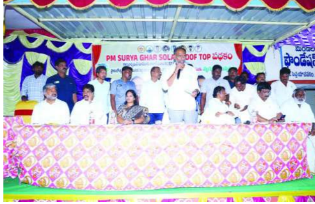
మార్కాపురం పెన్ పవర్ ఏప్రిల్ 11