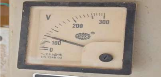
అవి పనిచేయకుండా నిలిచిపోతున్నాయి. ఫలితంగా తాగునీరు, గృహ అవసరాల కోసం కావాల్సిన నీటిని సైతం పొందలేక ప్రజలు తీవ్ర ఇబ్బందులు పడుతున్నారు. పొలాల్లో పనులు ముగించుకుని ఇంటికి చేరుకున్నాక కనీసం కాళ్ళ కడుక్కోవడానికి కూడా నీరు లేక ఇబ్బంది పడుతున్నారంటూ గ్రామస్థులు బాధను వ్యక్తం చేస్తున్నారు. పగలు, రాత్రి అన్న తేడా లేకుండా తక్కువ వోల్టేజీ కొనసాగుతుండటంతో ఫ్యాన్లు, లైట్లు సరిగా పనిచేయడం లేదు. ఎండలు మండుతున్న ఈ కాలంలో చిన్నపిల్లలు, వృద్ధులు తీవ్రంగా ఇబ్బందులు పడుతున్నారు. రాత్రి వేళల్లో వేడి ఎక్కువగా ఉండటంతో విద్యుత్ సరిగా లేక నిద్రపట్టక ప్రజలు

పుల్లలచెరువు మండల కేంద్రంలో లో వోల్టేజీ సమస్య ప్రజలను తీవ్ర ఇబ్బందులకు గురిచేస్తూ రోజురోజుకూ ఇబ్బందులకు గురిచేస్తుంది. మండల కేంద్రంలోని ఏపీజీబీ బ్యాంకు వీధిలో పరిస్థితి అత్యంత దయనీయంగా ఉండటంతో స్థానికులు ఆవేదన వ్యక్తం చేస్తున్నారు. గత కొంతకాలంగా విద్యుత్ సరఫరాలో అస్థిరత, తక్కువ వోల్టేజీ సమస్యలతో ప్రజలు సాధారణ జీవనాన్ని కొనసాగించడం కష్టంగా మారింది. గ్రామంలో సింగిల్ ఫేజ్ విద్యుత్ సరఫరా ఉన్నప్పటికీ, గృహాల్లో మోటార్లు ఆన్ చేసిన సమయంలో కేవలం 100 నుండి 120 వోల్టేజీ మాత్రమే వస్తుండటంతో