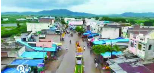
పుల్లలచెరువు పెన్ పవర్ ఏప్రిల్ 11

పుల్లలచెరువు మండల కేంద్రంలో లో వోల్టేజీ సమస్య ప్రజలను తీవ్ర ఇబ్బందులకు గురిచేస్తూ రోజురోజుకూ ఇబ్బందులకు గురిచేస్తుంది. మండల కేంద్రంలోని ఏపీజీబీ బ్యాంకు వీధిలో పరిస్థితి అత్యంత దయనీయంగా ఉండటంతో స్థానికులు ఆవేదన వ్యక్తం చేస్తున్నారు. గత కొంతకాలంగా విద్యుత్ సరఫరాలో అస్థిరత, తక్కువ వోల్టేజీ సమస్యలతో ప్రజలు సాధారణ జీవనాన్ని కొనసాగించడం కష్టంగా మారింది. గ్రామంలో సింగిల్ ఫేజ్ విద్యుత్ సరఫరా ఉన్నప్పటికీ, గృహాల్లో మోటార్లు ఆన్ చేసిన సమయంలో కేవలం 100 నుండి 120 వోల్టేజీ మాత్రమే వస్తుండటంతో