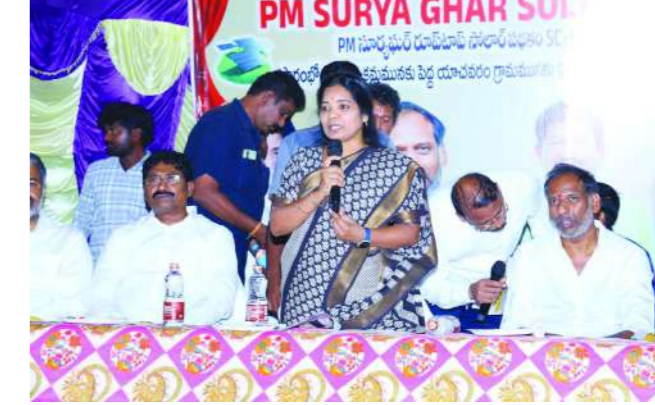
సైతం సబ్సిడీపై ఈ పథకాన్ని అందిస్తున్నట్లు తెలిపారు.