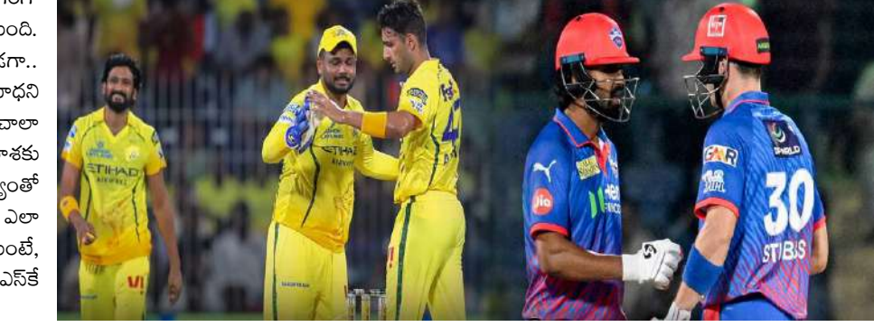
పోర్ ఛాన్స్ ఉంది. ఈ ఫ్లాట్ ట్రాక్ పై టాస్ గెలిచిన జట్టు భారీ స్కోరు సాధించాలని లక్ష్యంగా పెట్టుకుంటుంది. ఎవరు గెలుస్తారంటే? ప్రస్తుత ఫామ్ ప్రకారం ఢిల్లీ క్యాపిటల్స్ జట్టుకే విజయవశాకాలా ఎక్కువగా కనిపిస్తున్నాయి. ఆడిన మూడు మ్యాచ్ లో రెండింటిని గెలిచిన ఢిల్లీ, పాయింట్ల పట్టికలో నాలుగో స్థానంలో కొనసాగుతుంది. ఈ మ్యాచ్ గెలిస్తే వారు మూడో స్థానానికి వెళ్తారు. కానీ దెవాల్య్ బ్రెవిస్ రాకతో చెన్నై కూడా గట్టి పోటీ ఇచ్చే అవకాశం ఉంది.

హైదరాబాద్ పెన్ పవర్: ఇండియన్ ప్రీమియర్ లీగ్ (ఐపీఎల్) 2026లో భాగంగా చెన్నై సూపర్ కింగ్స్ వర్సెస్ ఢిల్లీ క్యాపిటల్స్ మధ్య ఆసక్తికరమైన పోరు జరగనుంది. ఈ మ్యాచ్ లో గెలిచి టోర్నీలో ఖాతా ఓపెన్ చేయాలని ఎల్లీ ఆర్మీ చూస్తుండగా.. చెన్నైపై విజయం సాధించి సూపర్ పై ఒక్క రన్ తేడాతో ఓడిన బాధని దిగమింగుకోవాలని చూస్తుంది. దీంతో ఈ రెండు జట్ల కీలక మ్యాచ్ గెలవడం చాలా ముఖ్యం. చెన్నై సూపర్ కింగ్స్ : ఈ సీజన్ లో చెన్నై ఆటతీరు ఫ్యాన్స్ ని తీవ్ర నిరాశకు గురి చేస్తుంది. ఆడిన అన్ని మ్యాచ్ లోనూ ఓడిపోయిన సీఎస్ కే, బ్యాటింగ్ వైఫల్యంతో ఇబ్బంది పడుతోంది. ఫామ్ కోల్పోయిన నంజూ శాంసన్ ఈ మ్యాచ్ లో ఎలా రాణిస్తాడనేది ఆసక్తికరంగా మారింది. జట్టుకు ఊరటనిచ్చే విషయం ఏమిటంటే, విధ్వంసకర బ్రాటర్ దెవాల్య్ బ్రెవిస్ తుది జట్టులోకి రావడం. అతని రాకతో సీఎస్ కే బ్యాటింగ్ లైన్ వ మరింత బలోపేతం కానుంది. ఢిల్లీ క్యాపిటల్స్ : ఆక్షర్ పటేల్ సారథ్యంలోని ఢిల్లీ జట్టు అద్భుతమైన ఫామ్ లో ఉంది. గత మ్యాచ్ లో గుజరాత్ టైటాన్స్ తో జరిగిన పోరులో కేవలం ఒకే ఒక్క పరుగుతో ఓడిపోయినప్పటికీ, ఆ జట్టు ఆత్మవిశ్వాసం ఏమాత్రం తగ్గలేదు. డేవిడ్ మిల్లర్ గత మ్యాచ్ లో అద్భుతంగా ఆడినప్పటికీ త్వరిత విజయాన్ని దక్కించుకోలేకపోయాడు. పిచ్ రిపోర్ట్: సాధారణంగా చెన్నై పిచ్ స్పిన్ ను అనుకూలీస్తుంది, కానీ ఇటీవలి కాలంలో ఇక్కడ భారీ స్కోర్లు నమోదు అవుతున్నాయి. బ్యాటర్లకు స్వర్ణధామంగా మారిన ఈ పిచ్ పై మరోసారి పరుగుల వరద