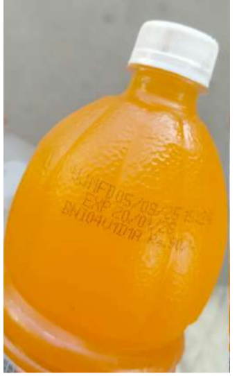
గుంటూరు, పేన్ పవర్, ఏప్రిల్, 11, రోగుల ప్రాణాలతో చెలగాటం