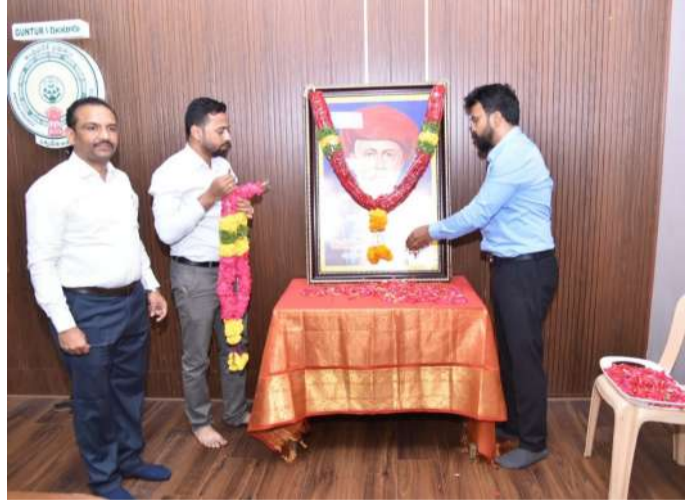
విధానం నేటి విద్యావ్యవస్థ బలోపేతం చేయడానికి, బాలికా విద్య పట్ల ప్రత్యేక చర్యలు చేపట్టడానికి దోహదం చేశాయన్నారు. సమాజంలో దురాగతాలను రూపుమాపుటకు బాటలు వేసిన మహనీయుడు అన్నారు. ఈ కార్యక్రమంలో అధికారులు, సిబ్బంది పాల్గొన్నారు.