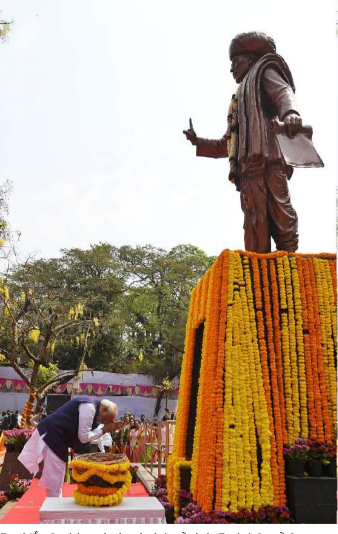
పెంపకోవాలి. సమాజ స్వయం సంస్కరణ సామర్థ్యంపై మన విశ్వాసాన్ని బలంగా చాటాలి. నైతిక స్పృహ, ప్రజా ప్రయోజనం రెండూ తోడ్పడతే.. ఈ సమాజ శక్తి దేశంలో అద్భుతాలు సృష్టించగలదని ఆయన జీవితం నిరూపించింది. అందుకే నేటికీ లక్షలాది మందికి ఆయన ఆలోచనలు బలాన్నిస్తున్నాయి. ఆయన మాటలూ, చర్చలూ నేటికీ ఆశను చిగురింపజేస్తున్నాయి. ఆయన జన్మించి దాదాపు రెండు వందల ఏళ్లు గడుస్తున్నా - మహాత్మా జ్యోతిరావు పూలే గత కాలపు శక్తిగానే కాకుండా.. నవ భారత భవితకు మార్గదర్శిగా విరాజిల్లుతున్నారు.