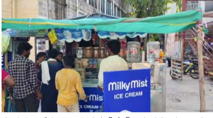
మాడు నెలల క్రితం కాలం చెల్లిన కూర్ (డ్రీంక్స్) అమ్ముతున్న దుకాణదారులు ఇదేంటి అని అడిగితే చూసుకోలేదు అంటూ విచిత్ర సమాధానం కనీసం నెలకు ఒకసారి అయినా దుకాణదారుల విక్రయాలపై దృష్టి సారించని ఆసుపత్రి పరిపాలన విభాగం మామూళ్ల మత్తులో ఊగుతున్నారా అంటూ అనుమానం వ్యక్తం చేస్తున్న రోగులు కనీసం ఫుడ్ సేఫ్టీ అధికారులు అయినా ద్రుష్టి సారినారా? రోగుల ప్రాణాలతో చెలగాటమాడుతున్న ఇటువంటి దుకాణదారులపై చర్యలు తీసుకుంటారా?? యధావిధిగా కచ్చులు మూసుకుంటారా వేచి చూడాలి?