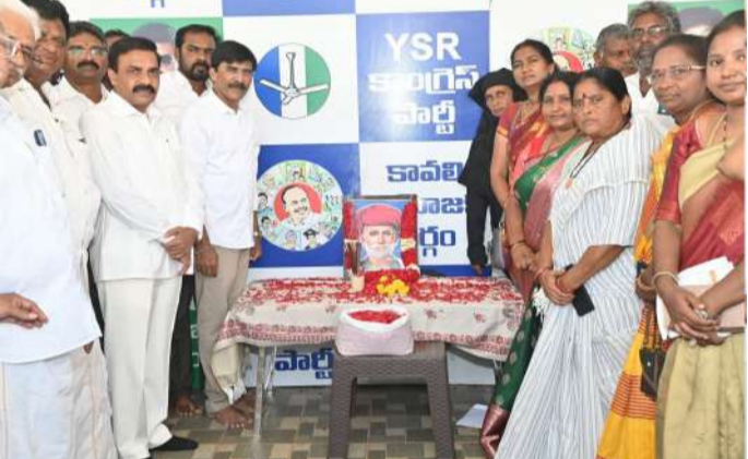
కొనసాగించాలని అన్నారు. ఈ కార్యక్రమంలో వైఎస్ఆర్సీపీ కావలి నియోజకవర్గ నాయకులు కార్యకర్తలు పాల్గొన్నారు.