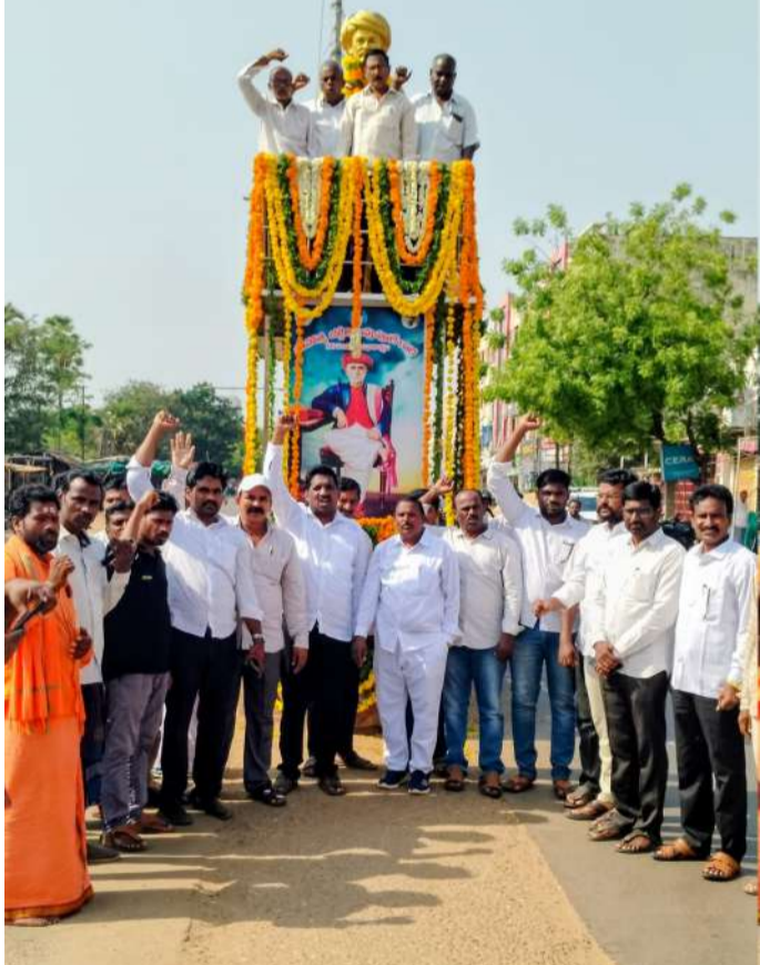
సమాజంలో అనగానిన వర్గాల అభ్యున్నతి కోసం వారి విద్యాభివృద్ధి కోసం కృషి చేసిన గొప్ప సంఘసంస్కర్త మానవతావాది మహోన్నత జ్యోతిరావు పూలే అని తెలిపారు. ఆయనకు భారతరత్న అవార్డు ఇవ్వాలని ఆయన జయంతి సందర్భంగా ప్రభుత్వం నెలవై దినం ప్రకటించాలని వారు ప్రభుత్వాన్ని కోరారు.