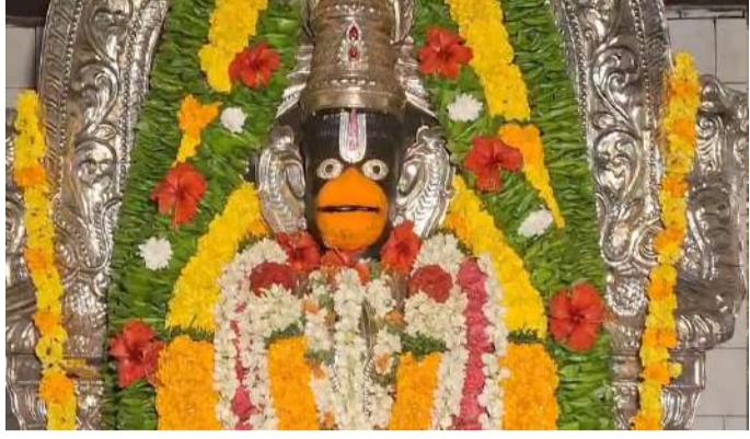
తిరునాళ్లలో ప్రధాన ఘట్టంగా వేద పండితుల మంత్రోచ్ఛారణల సదుపాయం హనుమత్ లక్షణ సమేత శ్రీ సీతారాముల కళ్యాణం కమనీయంగా, రమణీయంగా జరగనుంది. భక్తులకు ఎటువంటి ఇబ్బందులు కలగకుండా అన్ని సౌకర్యాలను పర్యవేక్షిస్తున్నట్లు ఆలయ కమిటీ ప్రతినిధులు తెలిపారు. ఈ అధ్యాత్మిక వేడుకకు భక్తులు భారీగా తరలివచ్చి స్వామివారి కృపకు పాత్రులు కావాలని కోరారు.

చిలకలూరిపేట రూరల్, పేన్ పవర్, ఏప్రిల్ 11 : చిలకలూరిపేట మండలంలోని బొప్పుడి గ్రామంలో వెలసిన శ్రీ ప్రసన్నాంజనేయ స్వామి వారి 43వ వార్షికోత్సవ తిరునాళ్ల మహోత్సవానికి సర్వం సిద్ధమైంది. ఈ నెల 13వ తేదీన నిర్వహించనున్న ఈ భారీ వేడుక కోసం అయి అధికారులు, పాలక వర్గ సంఘాలు అత్యంత వైభవంగా ఏర్పాట్లు చేస్తున్నారు. ఈ ఉత్సవాల్లో భాగంగా 11,12,13 రోజుల పాటు ఆలయంలో అధ్యాత్మిక కార్యక్రమాల మిన్నంటు నున్నాయి. స్వామివారికి ప్రత్యేకంగా నిర్వహించే అభిషేకాలు, నవగ్రహ హోమం, శాంతి యజ్ఞం వంటి కార్యక్రమాలతో ఆలయ ప్రాంగణం భక్తిపారవశ్యంలో మునిగిపోనుంది.