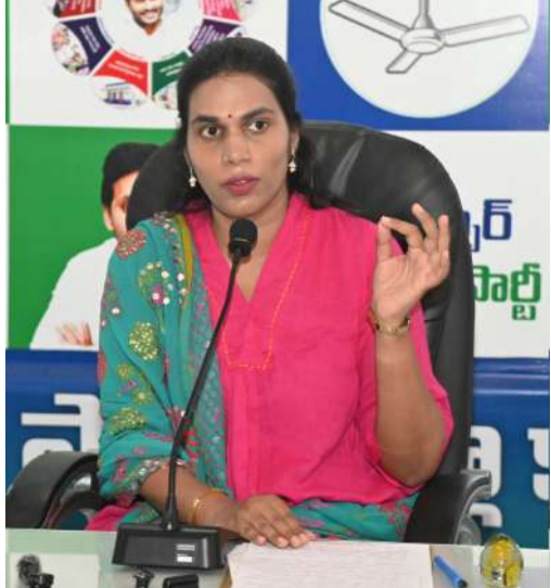
అమలులోనూ మహిళలకే ప్రాధాన్యత ఇచ్చారు