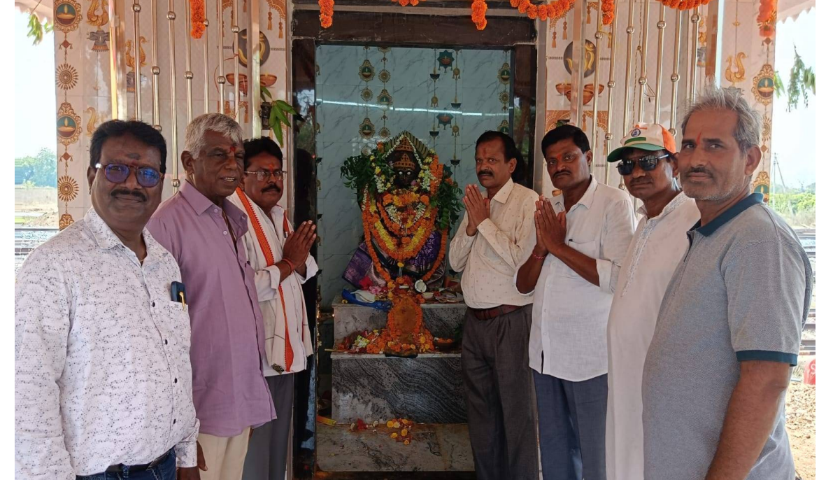
గార్ల, పెన్ పవర్, ఏప్రిల్ 11: గార్ల మండలం మర్రిగూడెం పంచాయతీలోని తిర్లాపురం గ్రామంలో శనివారం ముత్యాలమ్మ విగ్రహ పునః ప్రతిష్ఠాపన