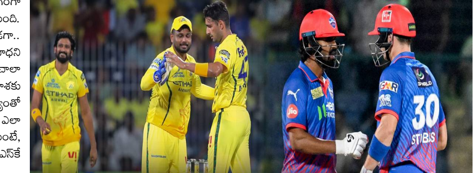
పాఠే ఛాన్స్ ఉంది. ఈ ఫ్లాట్ ట్రాక్పై టాప్ గెలిచిన జట్టు భారీ స్కోరు సాధించాలని లక్ష్యంగా పెట్టుకుంటుంది.

హైదరాబాద్ పెన్ పవర్: ఇండియన్ ప్రీమియర్ లీగ్ (ఐపీఎల్) 2026లో భాగంగా చెన్నై సూపర్ కింగ్స్ వర్సెస్ ఢిల్లీ క్యాపిటల్స్ మధ్య ఆసక్తికరమైన పోరు జరగనుంది. ఈ మ్యాచ్లో గెలిచి టోర్నీలో ఖాతా ఓపెన్ చేయాలని ఎల్లో ఆర్మీ చూస్తుండగా.. చెన్నై విజయం సాధించి గుజరాత్ పై ఒక్క రన్ తేడాతో ఓడిన బాధని దిగమింగుకోవాలని చూస్తుంది. దీంతో ఈ రెండు జట్లకు మ్యాచ్ గెలవడం చాలా ముఖ్యం. చెన్నై సూపర్ కింగ్స్ : ఈ సీజన్లో చెన్నై ఆటతీరు ఫ్యాన్స్ ని తీవ్ర నిరాశకు గురి చేస్తుంది. ఆడిన అన్ని మ్యాచ్లలోనూ ఓడిపోయిన సీఎన్కే, బ్యాటింగ్ వైఫల్యంతో ఇబ్బంది పడుతోంది. ఫామ్ కోల్పోయిన సంజూ శాంసన్ ఈ మ్యాచ్లో ఎలా రాణిస్తాడనేది ఆసక్తికరంగా మారింది. జట్టుకు ఊరటనిచ్చే విషయం ఏమిటంటే, విద్యుత్ కర బ్యాటర్ దేవాల్ బ్రెవిస్ తుది జట్టులోకి రావడం. అతని రాకతో సీఎన్కే బ్యాటింగ్ లైవ్ మరంత బలోపేతం కానుంది. ఢిల్లీ క్యాపిటల్స్ : అక్షర్ పఠేల్ సారథ్యంలోని ఢిల్లీ జట్టు అద్భుతమైన ఫామ్లో ఉంది. గత మ్యాచ్లో గుజరాత్ టైటాన్స్ తో జరిగిన పోరులో కేవలం ఒకే ఒక్క పరుగుతో ఓడిపోయినప్పటికీ, ఆ జట్టు ఆత్మవిశ్వాసం ఏమాత్రం తగ్గలేదు. డేవిడ్ మిల్లర్ గత మ్యాచ్లో అద్భుతంగా ఆడినప్పటికీ త్వరిత విజయాన్ని దక్కించుకోలేకపోయాడు.