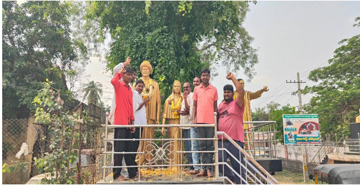
మహానీయులు పూలే అని ఆయన నడిపిన పోరాట స్ఫూర్తి నేటి తరానికి ఆదర్శం అని ఆయన ఆశయ సాధనకు ప్రతి ఒక్కరు కృషి చేయాలని అన్నారు ఈ కార్యక్రమంలో సిపిఐ మండల కార్యదర్శి