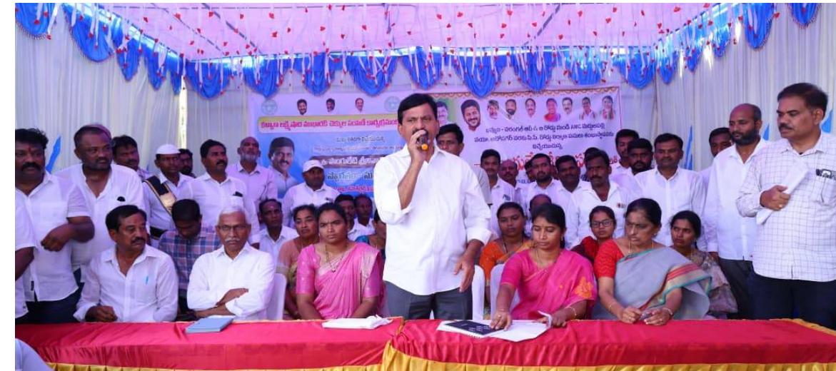
ఖమ్మం, రూరల్ పెన్ పవర్, ఏప్రిల్ 11: వరంగల్ క్రాస్ రోడ్డు ఆటోనగర్ నుంచి మద్దులపల్లి వ్యవసాయ మార్కెట్ కమిటీ వరకు రూ.4.50 కోట్లతో నిర్మించనున్న రహదారి పనులకు మంత్రి

భూమిపూజ చేశారు. ఈ సందర్భంగా ఆయన మాట్లాడుతూ.. మున్సిపాలిటీలోని 32 వార్డుల సమగ్ర అభివృద్ధి కోసం ప్రభుత్వం ఇప్పటి వరకు రూ.58.95 కోట్లు కేటాయించిందన్నారు.