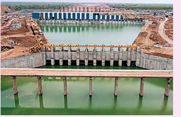
కరీంనగర్, ఏప్రిల్ 11, పెన్ పవర్: ప్రస్తుతం రాష్ట్రవ్యాప్తంగా కాళేశ్వరం ప్రాజెక్టు గు రించి చర్చనీయాంశంగా మారింది. కాళేశ్వరం ప్రాజెక్టు పునరుద్ధరణలో సమయమే ప్రస్తుతం అడిపెద్ద సవాల్ గా మారింది. వరదల